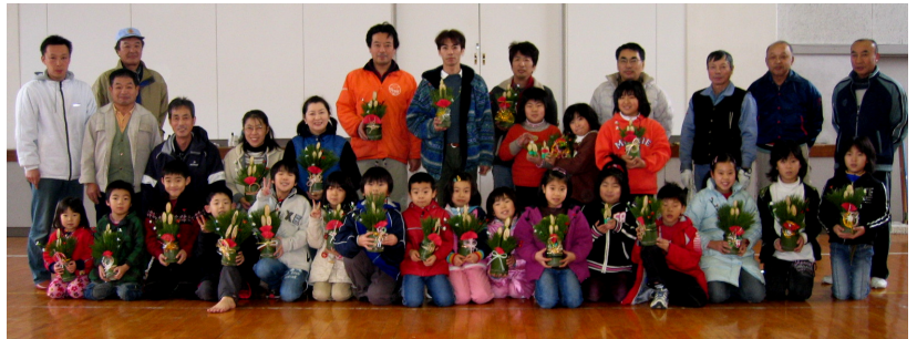
↑ミニ門松を手に記念撮影(こなかクラブ) ←ひよこ教室

『ミニ門松づくり』に挑戦地域の講師五名の指導のもと、竹を切ったり、飾りを付けたり。八丁紙作りに引き続き、子どもたちはお正月飾り作りに一生懸命取り組みました。ご協力いただいた地域の皆様、ありがとうございました。