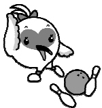
▲トキめき新潟 国体マスコット キャラクター 「キッピー」

*初参加者には、特別ハンティを贈呈! 賞品も多数用意しておりますので奮って参加ください。