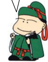
ならまわし麻呂くん