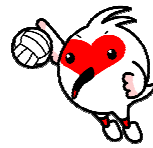
▲トキめき新潟国体 マスコットキャラ ター「トッピー」