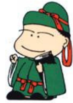
和島地域生涯学習キャラクター なら主わし麻呂くん