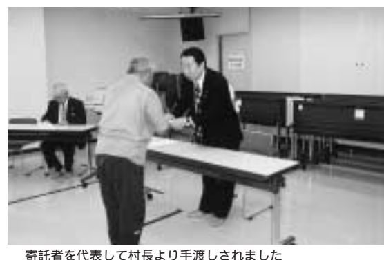
寄託者を代表して村長より手渡しされました