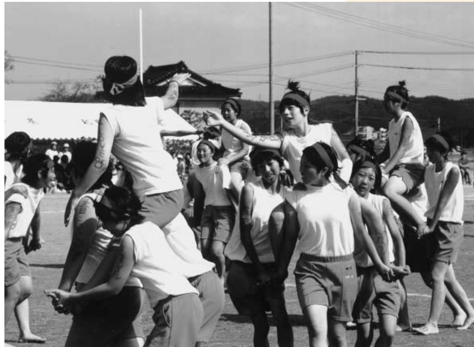
9月11日(土) 北辰中学校体育祭「騎馬戦」