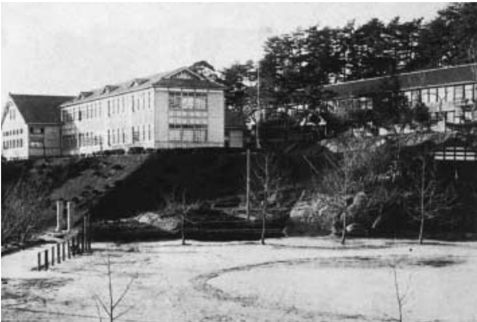
昭和2年校舎全景

しかし戦時体制が進んでいたときも村民の学校支援は行なわれていました。昭和17年には児童数増にに応じて2教室増築が行なわれました。また教室用ラジオ音声機や映写機などが寄贈されています。