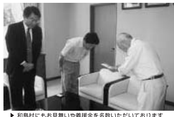
▶和島村にもお見舞いや義援金を多数いただいております