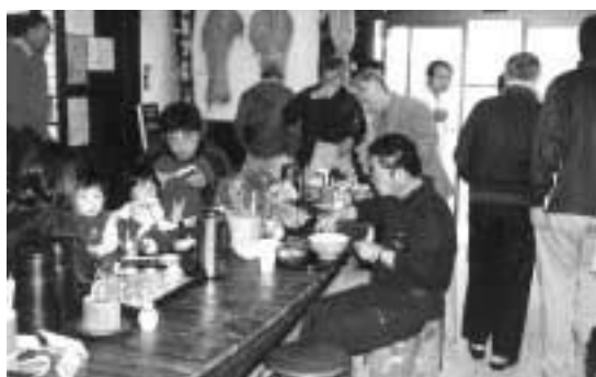
オープンしてから大勢の人が訪れています