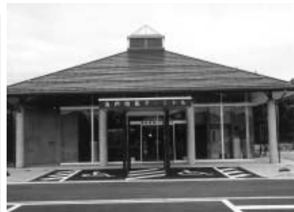
24時間利用可能です。