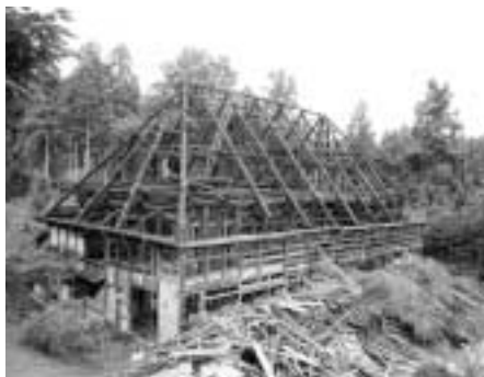
平成15年6月から工事開始