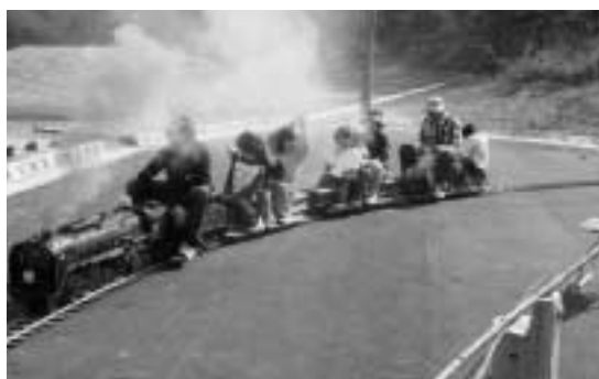
煙を上げてカブよく走る機関車