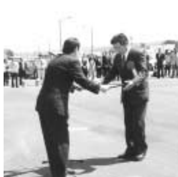
ご協力いただいた個人と団体、7名に感謝状贈呈