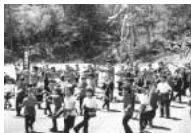
わしまよさこい「颯」