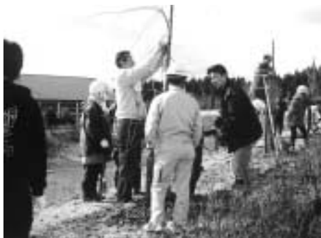
商工会青年部・女性部の植樹