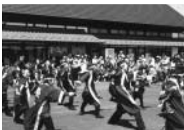
良寛わしまYOSAKOIソーラン隊