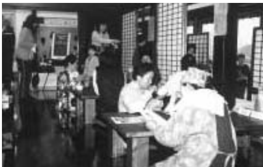
特別におしるこが振舞われました

4月19日(月)には一般公開が行なわれました。先着200名に特製のおしるこが振舞われました。