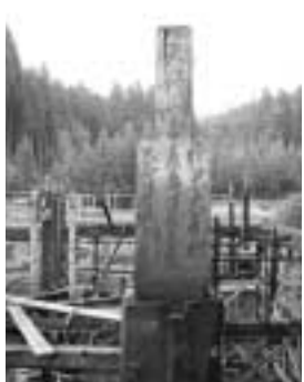
柱から天保三年の文字が