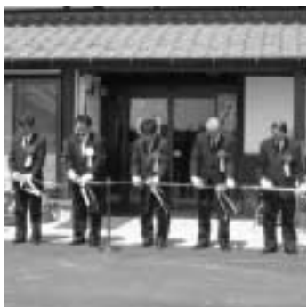
記念のテープカット