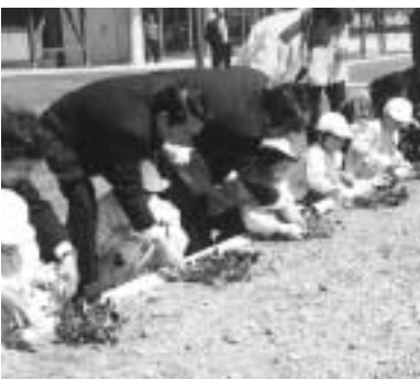
関係者と一緒にピオラを植栽

当日は国土交通省をはじめ多くの関係者が出席。最初に和島幼稚園児総勢38名が、花壇にピオラの花を植栽。その後テープカットが行なわれ、地域交流センター「もてなし屋」がオープンいたしました。この日はオープンとあって大勢の人がもてなし屋を訪れ、できたのけんさ焼やだんご汁の味に舌鼓を打っていました。