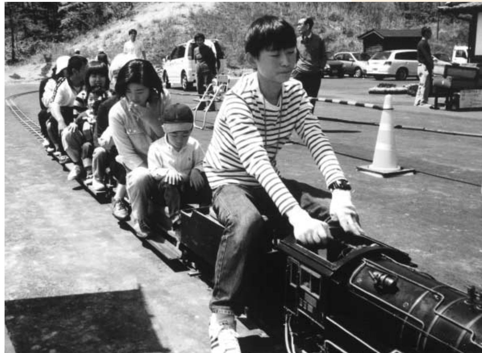
5月2日(日)道の駅ミニSL試乗会