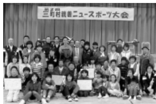
うまく近づいたかな?!(ベタンクの部)

結果については、前年度大会は総合優勝を飾りましたが、本年は優勝こそ出雲崎町チームに奪われ