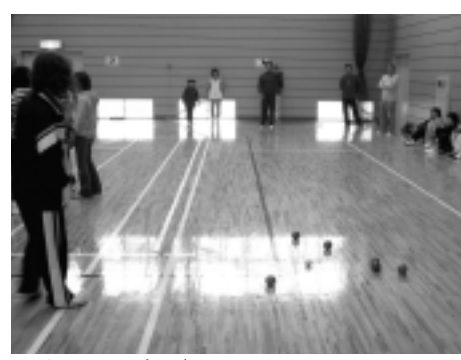
仲よくハイポーズ