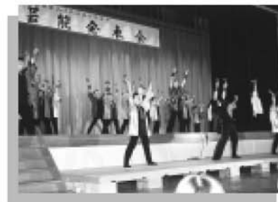
日頃の練習の成果を披露した芸能発表 ▲▶

老若男女問わず、誰しもが何かに熱中し生きがいをもって日々の生活を送ることが生涯学習の基本テーマです。みなさんは今年の生涯学習フェスティバルでどんな体験をしましたか。興味を抱いたものがあつたら、迷わずどんどんチャレンジしてください。きっと自分にあつた生涯学習のテーマが見つかるはずですよ。