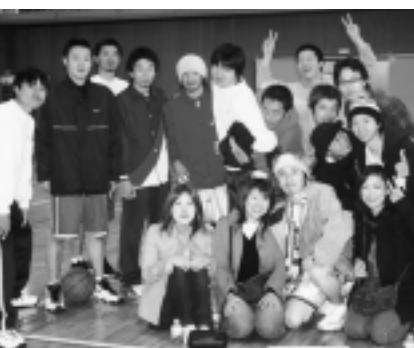
11年連続出場中のキムズチーム

申し込み 12月15日(月)までに公民館へご連絡ください。 (☎74-3111)