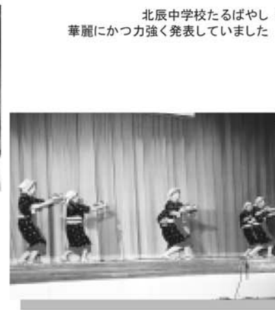
北辰中学校たるばやし 華麗にかつ力強く発表していました