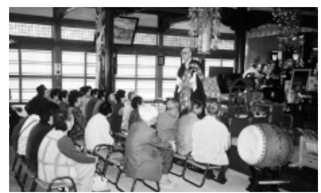
さいました皆さん本当に有難うございました。

参加者の皆さんの多くは、村内の文化財・史跡であつても知らない所が多かつたように感じました。今後、標柱・説明板等を整備しより身近な史跡を心掛けたらと思います。貴重な時間を割いて、説明くだ