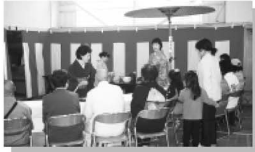
▲ 石州流のお茶席 日本の心「詫び寂び」にふれていました