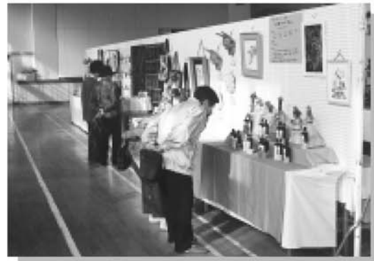
▲ 丹精をこめて作製した芸術品がずらりと並んだ作品展は、個性あふれる力作ぞろいでした