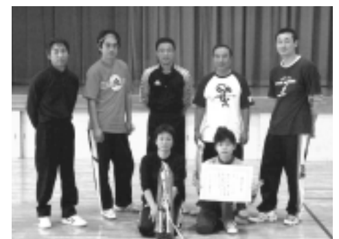
優勝したエンジェルス チーム