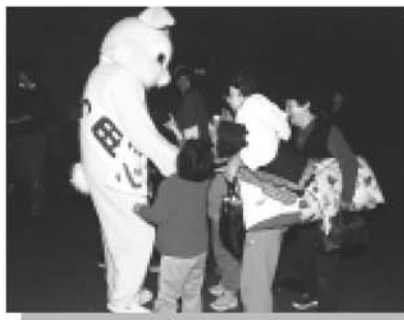
▶ 着ぐるみをもって防火PR 火の用心を呼びかけました。