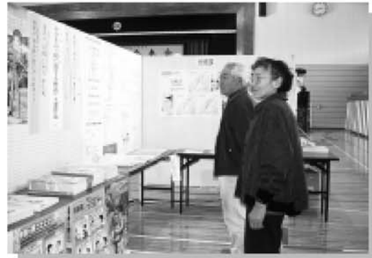
▲ 村民の生活に密着した行政情報などを展示した行政情報コーナー