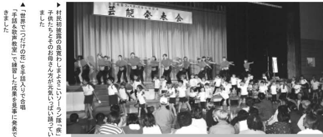
▶ 村民初披露の良寛わしまよさいソーラン隊「疾」子供たちとお母さん方が元気いっぱい踊っていました ▲ 「世界で「つたけの花」を手話入りで合唱「手話&歌声教室」で練習した成果を見事に発表できました

10月25日、26日の2日間にわたって公民館、勤労福祉センターを会場に「第23回生涯学習フェスティバルinワシマ」が「健康」をテーマに開催されました。このイベントは、村内で活動するサークルや公民館事業として行われている各種教室・講座など、村民の生涯学習の発表の場として、また、これから何かを始めようと思っている人たちへのきっかけ作りの場として、毎年開催しているものです。フェスティバルでは、マジックパルーン教室を皮切りに作品展示や芸能発表、福祉器具の展示などが行われました。「健康」をテーマにした今年のフェスティバルは「体力測定」や「アルコール体質判定チェック」そして「健康ウォーク」などが行なわれ、自分自身の健康を見直す良い機会になったのではないだろうか。