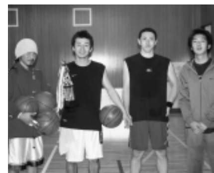
優勝した薬剤師チーム

11月16日(日)、和島村体育協会主催による村民バスケットボール大会が北辰中学校体育館で開催されました。今年は、10チームが参加エントリー。中学生や青年チームが多く、若いパワーが溢れるエネルギーあふれる大会となり、プロ顔負けの好プレー・スーパープレーも随所に飛び出されました。決勝戦は、追いつ追われつ接戦となり、39対36で、薬剤師チームが昨年の雪辱を晴らし、見事伝統の大会を制しました。