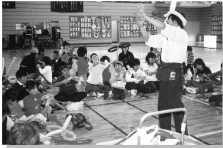
▲ 風船がアツという間にブードルに大変身 子供たちだけでなくお孫さんへのプレゼントのためご年配の方も一緒に作りました