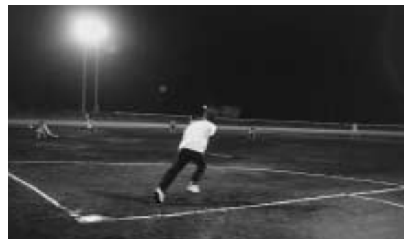
一塁に向かってダッシュ

「大人と子供そろって楽しもう」をテーマに行われた大会は、目的どおり、和気あいあいとハツラツとしたプレーや珍プレーの続出で和やかなムードで終わった大会でした。