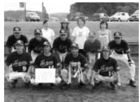
よろっとチームと応援団の皆さん

試合は、プロ顔負けの好プレー！珍プレー！逆転に次ぐ逆転や、逆転サヨナラ試合など見ごたえのある内容となり、参加者の皆さんは、爽やかな汗を流していました。決勝は、大会史上何十年ぶりに同点じゃんけん決戦となり、「よろっと」チームが優勝。