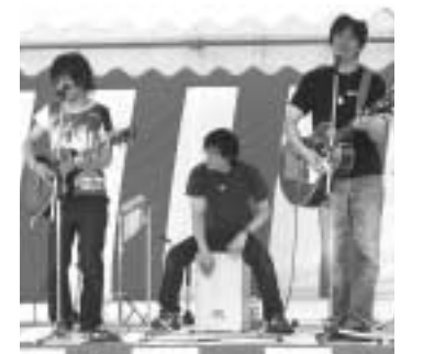
アマチュア アコースティックライブ

約1000人が参加した和島音頭 野球場芝生いっぱいひとつの大きな輪となりました。