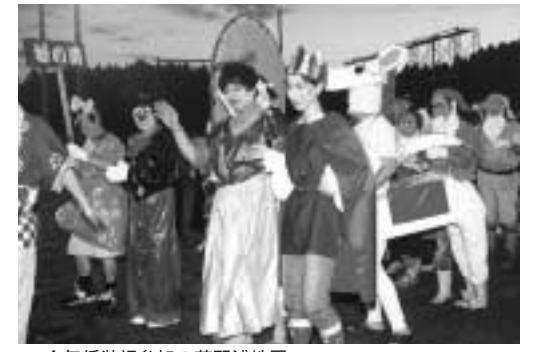
今年仮装初参加の若野浦地区