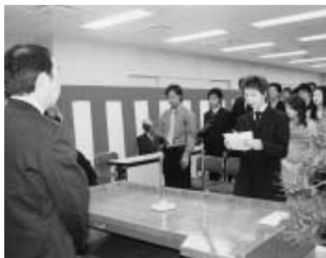
なります。」と謝辞を述べました。今年の和島村の新成人は77名(男38名、女39名)でした。