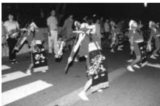
大夜祭「弓踊り行列」