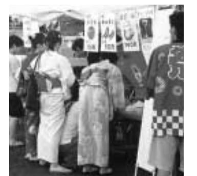
飲食コーナーも大繁盛