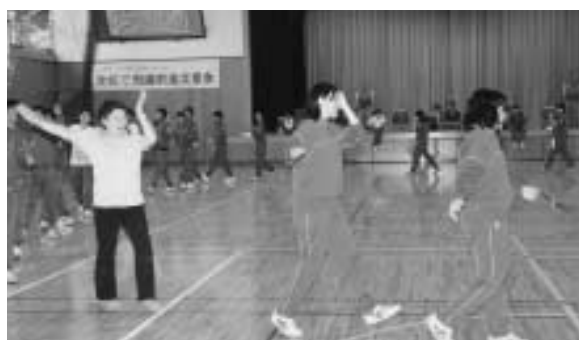
島崎おけさも輪になって練習しました

毎年、イベントの写真しか載せていなかったため、今年はイベントを実際にやった人の声も聞いてみようとして5人の方のインタビュー記事を書きました。インタビューをして感じたことは、わしままつりが和島村にとって一番の発表の場であるということです。小さな村で1000人以上のもの村民を集めるのは、あとは村民運動会くらいでしょう。この祭りに向けて多くの人が準備し、そして参加してくれていることが取材を通して知ることができました。例年になく大勢の人から参加してもらった今回のわしままつり。わしままつりも少しずつ変わります。来年もぜひご参加ください。