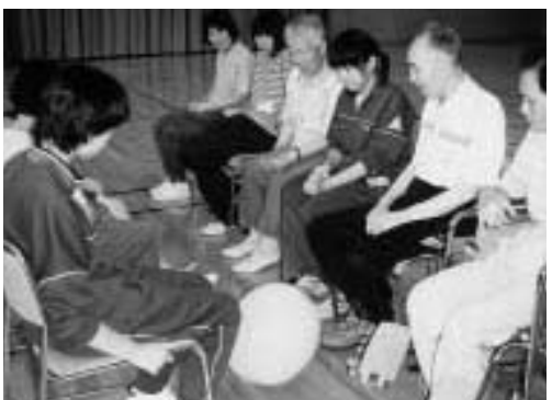
んも親切だったし、友達もできました。また来たいです。

また当日は、笠原村長も加わり正しい人権意識の普及高揚を呼びかけました。人権は尊重されなければなりません。人権のことに關して、疑問に思ったこと、困ったことなどがありましたら人権擁護委員または新潟地方事務局柏崎支局にご相談ください。