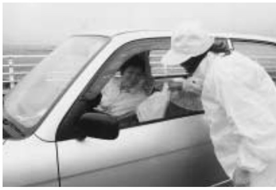
▶ドライバーに手渡しました

これは、夏の交通事故防止運動の一環として実施されたものです。残念ながら当日は、あいにくの雨となつてしまいました。一台一台車を止め、ドライバー一人ひとりに無事故の願いを込めて交通安全協会女性部が作った「わし麻呂てまり」が手渡されました。