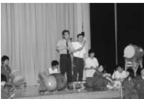
指導にも力が入ります

もう一つは親にも成長を感じて欲しかった。今の親は自分の子しか見ていないという部分があるでしょう。「まつり」を通じて自分の子が周りの子と比べてみて人間としてどのよう