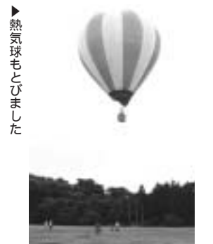
▶熱気球もとびました