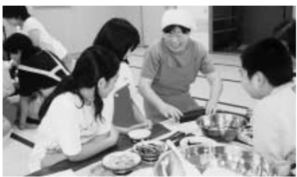
▶楽しく作りしました

当日は男女合わせて13名が参加。前半は自分の体脂肪率を測ったり、カロリーについて勉強するなど食べる大切さについて学びました。また後半は実践編として巻き寿司づくりにチャレンジするなど健康と食生活を見直す内容となりました。