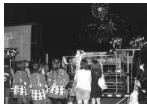
青年夢来クラブイベント