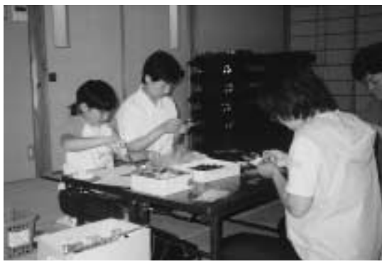
▶心を込めて作りしました

子供たちもお手伝いをするなか、交通安全の願いをこめて、一つひとつ丁寧に作っていききました。完成した、わし麻呂てまりは後日、宇奈具神社ではらいを受け、ドライバーにお守りとして手渡されました。