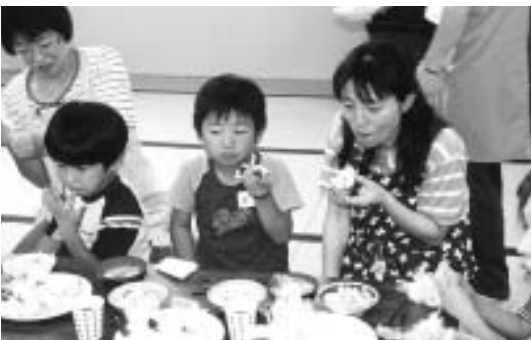
▶親子一緒においしくおにぎり