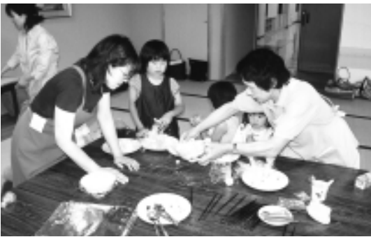
▶おにぎりの作り方をやさしく教わりました

6月21日(土)親子がふれあいながら楽しく、おにぎりを作ってもらおうと小学校1年生の親子を対象に、『親子ふれあひおにぎり教室』が保健センターで行なわれました。 当日は健康づくり推進員さん15人が、教室の運営からおにぎりの作り方の指導まで幅広く活躍しました。 教室には33人の親子が参加。最初の1時間はレクリエーションをして体を動かした後、お腹がすいたところで、おにぎりを作り始めました。 子供たちはおにぎりの作り方について推進員さんから教わりながら、一生懸命おにぎりを作っていました。 ある推進員さんは、「子供でも十分自分でおにぎりは作れます。お腹がすいたら自分でおにぎりを作って食べるような習慣を身につけておくのもいいかもしれません。」と話しておられました。 健康づくり推進員はこういった啓発活動も行なっています。