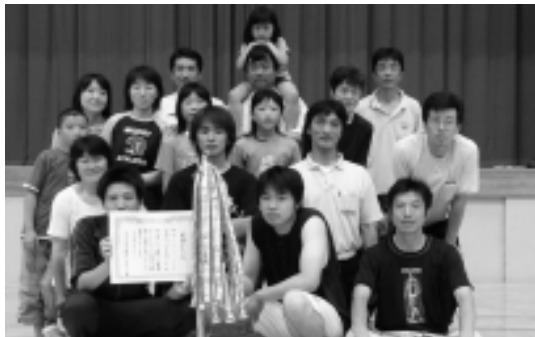
優勝した「ひまわりチーム」と応援団のこどもたち

両高地域の人達で構成された「ひまわりチーム」が昨年2位の下町上チームを決勝で取り、優勝!!女子高生チームは3位入賞という結果でした。なお、結果は次のとおりです。