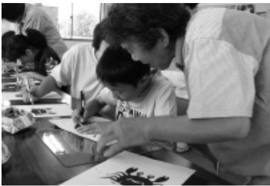
▲切り絵体験の様子

和島切り絵村のみなさんの親切な指導のもと、幼稚園児から大人まで多勢の参加者が切り絵に挑戦。うちわやカブトムシなどを夏をイメージする切り絵を制作。参加者たちは、3時間という長丁場にもかかわらず、休憩する間も惜しんで熱心に作品を仕上げました。