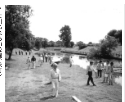
▶ 矢川ふれあい公園(巻町)

詳細については新潟県庁ホームページをご覧ください。 http://www.pref.niigata.jp/