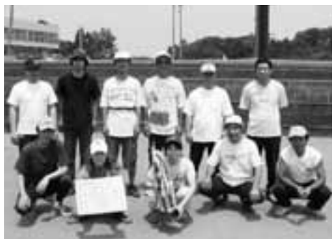
優勝した駅前Bチーム