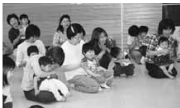
多くの親子が集まりました。

また、手遊びなどは忘れている人も多いと思いますから、にこにこルームに来て、毎回なにか遊びを覚えてもらい、家に帰って子供と一緒に遊んでほしいですね。 今後は各地区に出て公会堂などで出前保育などを行っていきたいと思っています。