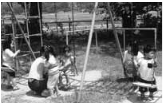
ブランコで楽しくあそびました。

「やっぱりここがいいのは、遊具と仲間。北野の公園にいても誰もいないときがありますから、そういうのに比べれば、ここに来れば、同じ年代の子供が必ずいますからいいですね。」と話してくださいました。