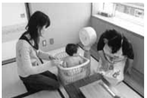
あーら大きくなったわね

最初は身体測定です。慣れない測定器に泣いてしまつ子供もいましたが、保健師さんが体重と身長をしっかりと測つて母子手帳に記入していました。