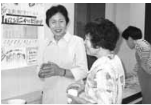
▶ 健康のためのお味噌汁は目標にしてください。