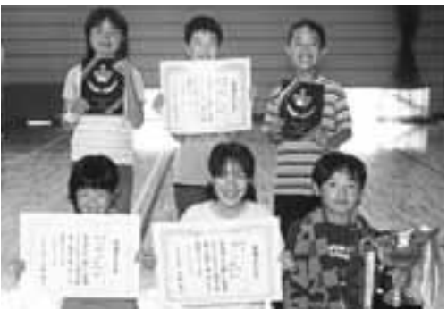
優勝した6 the winning team