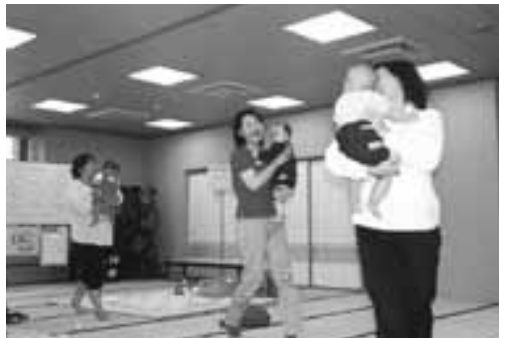
お馬でパッカパッカ

一応、乳児相談の予定はこれで終了です。でもお母さん方は残つて雑談。お母さん同士、また保健師さんや栄養士さんに話し掛けて交流や情報交換をしていました。終了予定時間を大きくオーバーして今回の乳児相談は終了となりました。