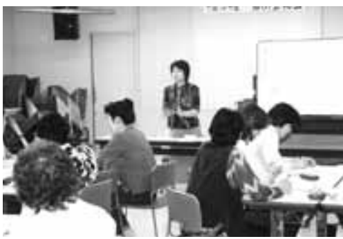
▶ 私達は健康づくりをすすめていく上で必要な知識・技術・心構えを勉強中です。

6月9日10日は基本検診を手伝いました。村民のみなさんが健康づくり推進員の仕事でイメージされるのはこれだと思います。今年も、受付や栄養相談など様々な場所で基本検診を支えました。この他、乳がんや胃・大腸がん検診などの検診でも健康づくり推進員は活躍しています。