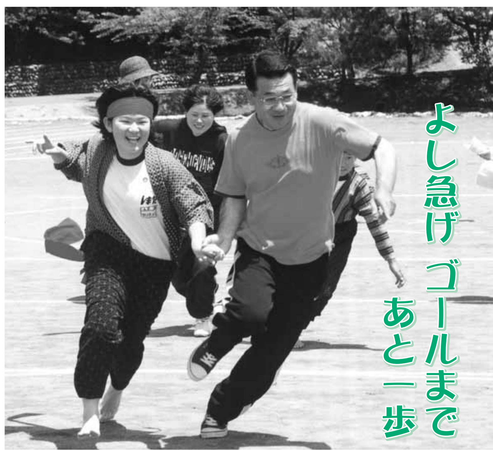
6月3日(火) 島田小学校運動会「激闘 島小百年物語」 (6年生競技)より