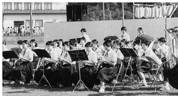
▲北辰中吹奏楽部の演奏