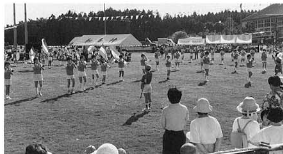
▲島小スクールバンド