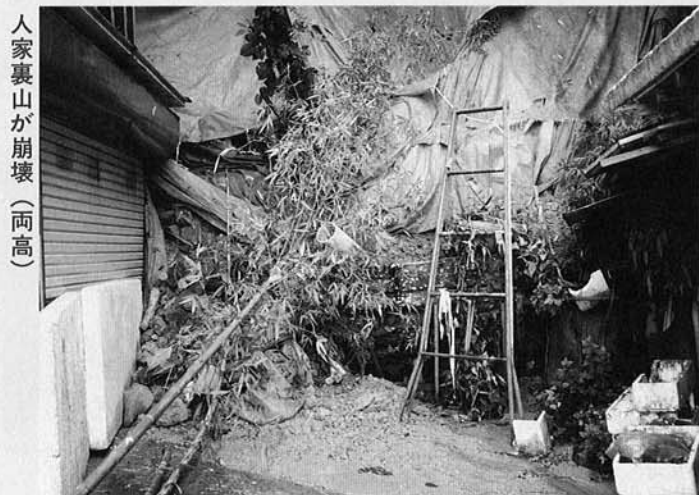
人家裏山が崩壊(両高)

七月中旬の集中豪雨は県内をはじめ各地に大きな被害をもたらしましたが、和島村においても七月十六日から十七日にかけての豪雨により災害が発生しました。 水田や道路の冠水をはじめ村内各地の道路では路肩の崩壊や土砂の流出等が起り、山に沿った場所では長雨により地盤がゆるみ人家裏山の崩壊がひき起こされました。 忘れた頃にやってくるのが災害です。 防災の基本は各世帯での備え。非常持出品を準備しておく、家族で災害発生時の集合場所・連絡先等話し合っておくなど、万一の災害に十分な備えを忘れずにおきましょう。