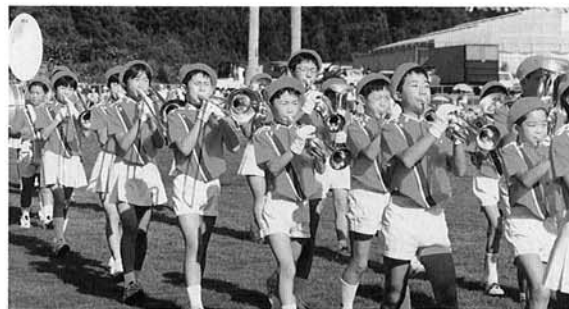
▲桐小スクールバンド