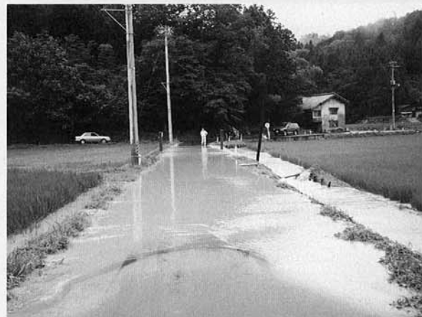
道路が冠水(日野浦)