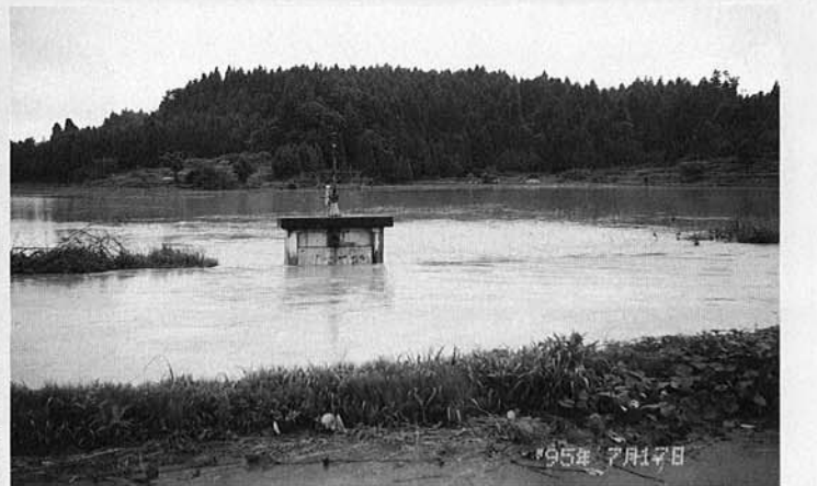
郷本川が増水し水田が冠水