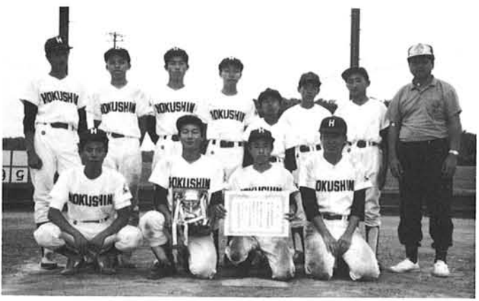
優勝した少年野球教室Aチーム

熱闘//第三回村民野球大会 毎年恒例の和島村体育協会主催、第二一回村民野球大会が七月三十日、八月六日の両日十八チームが二五〇名の参加のもとに熱戦が繰りひろげられ、決勝戦は少年野球教室Aチームと荒巻チームの戦いとなり、少年野球教室Aチームが五対三と荒巻チームを振り切り優勝しました。 優勝 少年野球教室A 準優勝 荒巻 三位 下町下 三位 村田