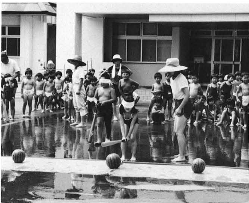
代わるがわる挑戦する園児たち

八月九日(水)、和島保育所前の広場で保育所、幼稚園合同のすいかわり大会が行われました。この日、朝から夏の日がジリジリと照りつける中、全員水着姿で集合しました。保育所、幼稚園の子供たち合せて百九十名が十のグループに分かれました。