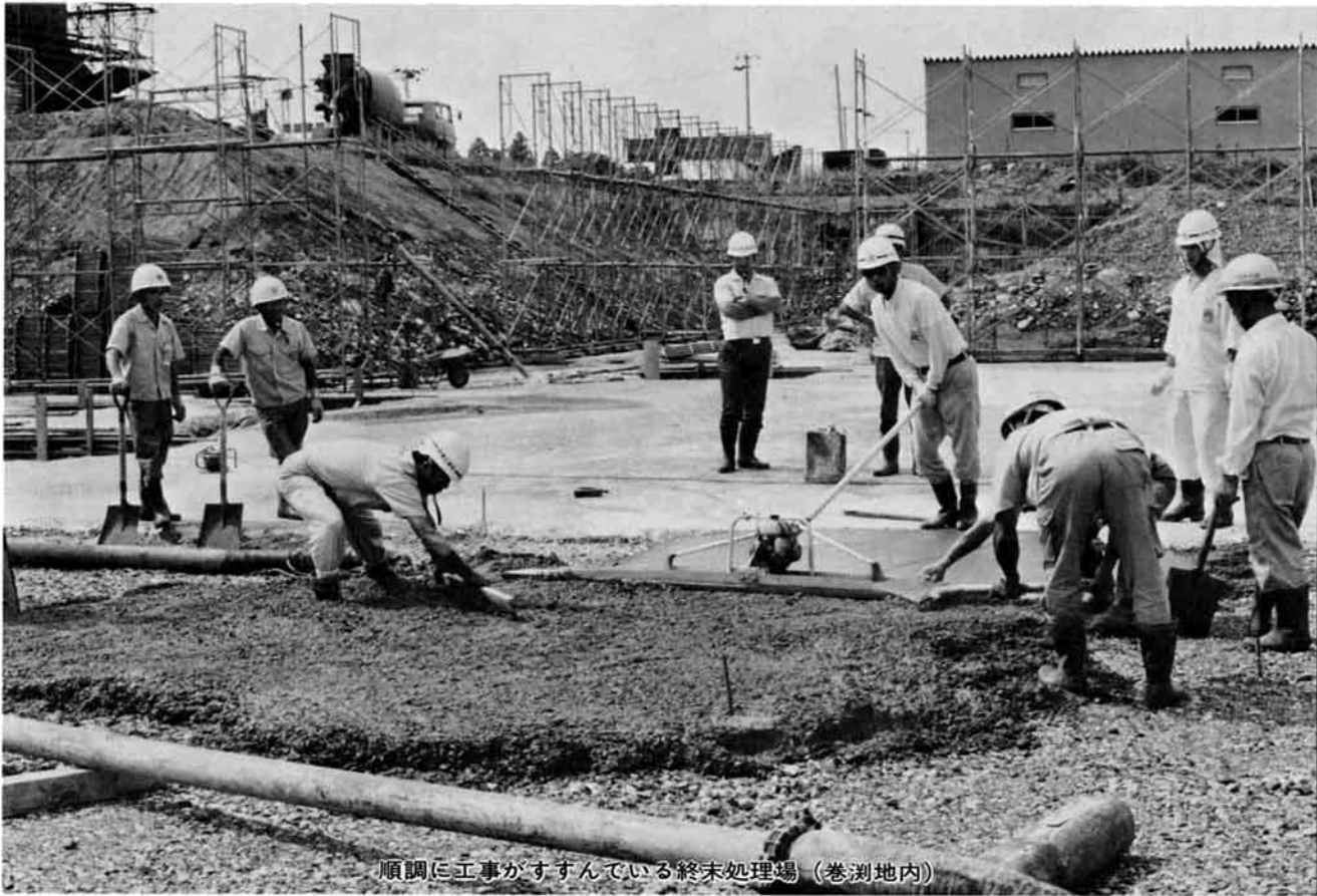
順調に工事がすすんでいる終末処理場(巻洲地内)

これだけの工事を昭和六十三年度までに完成させるため、市は鋭意努力していますが、国の財政事情は非常に厳しく、公共事業が抑え込まれている現状です。 下水道工事は、市民のみなさんが毎日の生活に欠くことのできない道路上で、通行を止めて工事を行いますので、周辺の方にはもとより一般通行の方々にも大変ご不自由をおかけしていますが、ご理解とご協力をいただき、これまで予定どおりに工事がすすんでいます。市は、みなさんのご理解とご協力に感謝しております。 来年度からはさらに、工事箇所・延長とも増加します。また、狭い道路での工事が多くなりますので、ガスや水道管の伏せ替え工事などが必要となり、工事もながびくことが予想されますし、ガスや水道の供給停止を伴うこととなります。 今後、市内各事業所の営業活動への影響や市民生活への不便、老人や幼児に対する危険性の増加など幾多の支障が生ずるかと思いますが、生活環境を改善し、きれいな川によみがえらせ「私たちのまちは自然と一体です」と、みんなが誇れる栃尾市にするため、下水道工事に、より一層のご理解とご協力をお願いいたします。