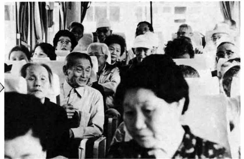
今日は、いろいろな施設を見学できてよかったの。まだまだ知らないところがたくさんあるの。(帰りの車中で)