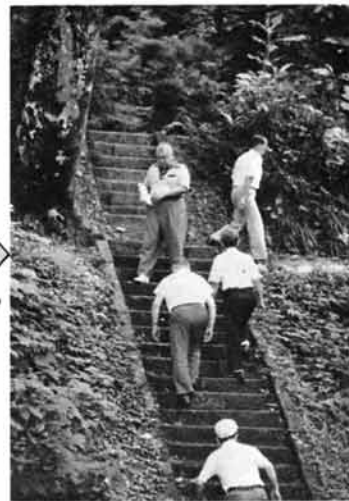
久しぶりにきてみたども、あいかかわらず冷たくて、いい水が流れている。また、キャンプ場もよく整備されているの。(杜々の森で)