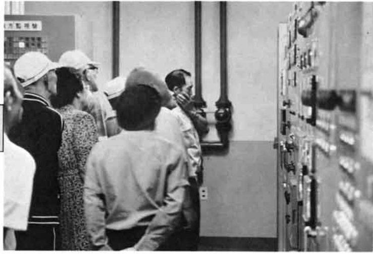
毎日飲んでいる水は、いろんな機械や装置を通して送られてきているがだの。(市浄水場で)