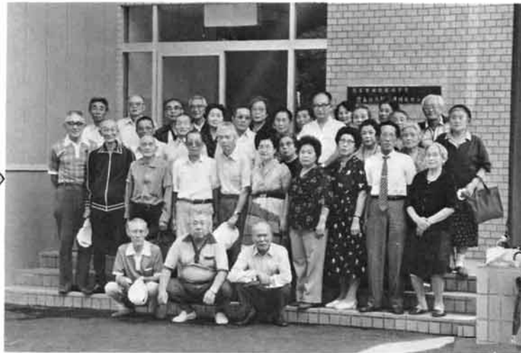
昼食後、センター前で記念撮影。ハイ、にっこり笑ってくださいな。パチリ。