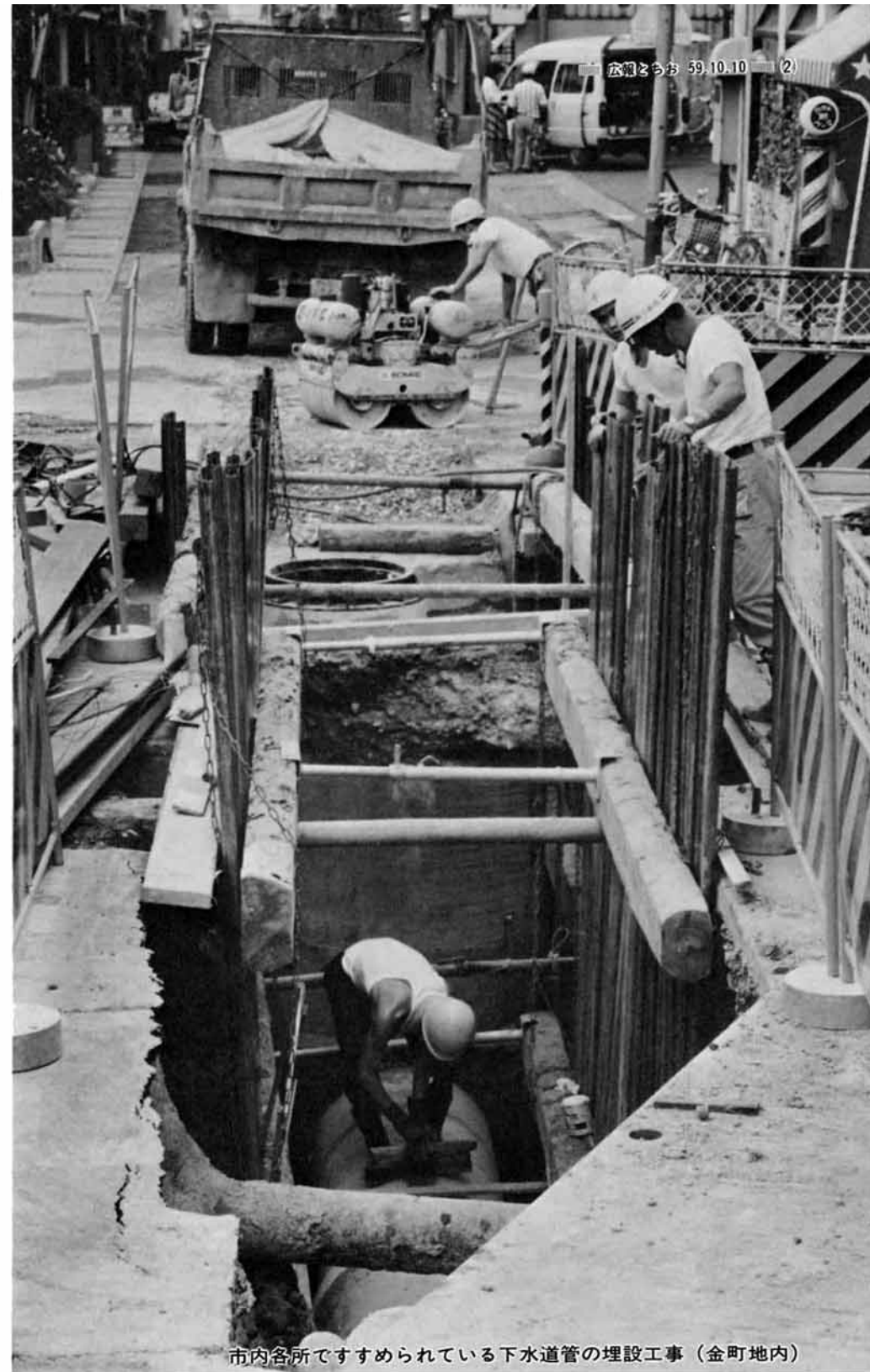
市内各所ですすめられている下水道管の埋設工事(金町地内)

汚水処理施設は、現在仮の名称を「栃尾市終末処理場」として、昨年度から建設をすすめています。この施設は、下水を集める区域を拡大するに従って(つまり、下水道管の整備区域が拡大すること)施設を拡張していきますので、最終の施設完成はずっと先のこととなります。