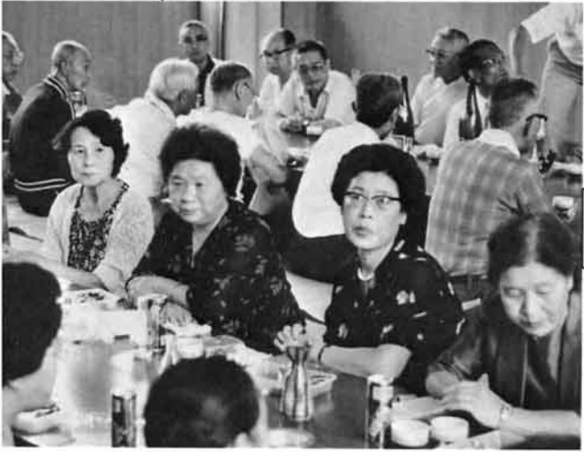
持参したおにぎりや飲み物で昼食。栗山沢の人たちの心づくしの枝マメや冷えたスイカのもてなしに、参加者一同大かんげき。(栗山沢冬期健康増進センターで)