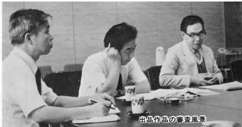
出品作品の審査風景

消防署は、家庭における防火安全の担い手である主婦や老人を対象に、火気の安全な使用方法、初期消火用具の適正な使用方法等について、防火教室を開いております。この機会に町内の婦人会や老人クラブを通して申込んで下さい。