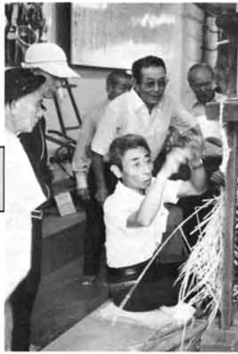
昔の農家の人たちは、冬仕事で「わらムシロ」を炉端で、このようにして作っていたがだの。(市農林業資料館で)