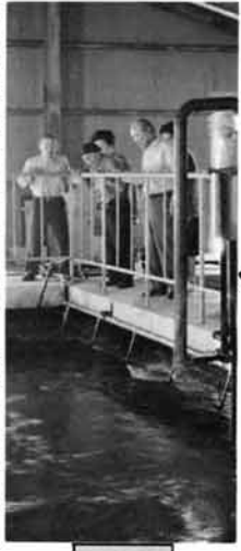
栃尾地区は、水洗トイレだそうだが、私たちの地域も早くせうなりたいたいものだ。(栃尾下水処理場で)