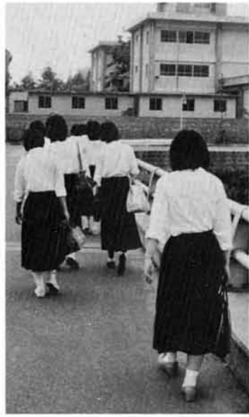
日ごろの生活に注視を

青少年の非行防止と健全育成を図るため市は、昨年十月一日、青少年育成センターを市役所内に設置しました。 センターの主な仕事は、①青少年の健全育成②青少年の生活実態に関する調査統計③非行青少年の早期発見とその生活指導④青少年の補導及び