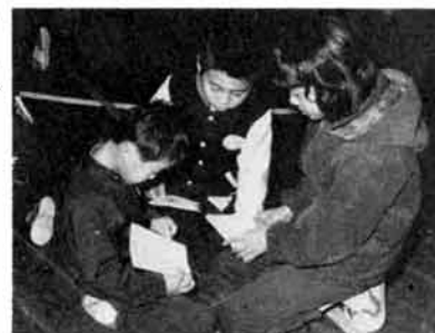
わかったあ？伝言ゲーム

児童会の役員は一年を二期に分け、前期、後期に決めています。行事計画はもとより学校生活の目標も出ます。今回は「ろうかを正しく歩こう」です。校舎の中を正しく歩くくせをつけることにより、道路でも正しく歩き、ひいては節度、規律を良くすることがねらいで、最近はその効果が現われているといます。 野球、ミニバスケットは試合前になると伝統を守るための練習に励みますが、野球はグラウンドが狭いため、一、離れた運動広場で練習です。児童は「広いグラウンドが欲しいなあ」と狭いグラウンドを見ての言葉でした。