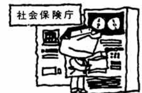
(年金の裁定・加入記録の管理)

問 私は国民年金の加入者です。毎月、保険料を納めたときにもらう領収書を保管しているのですが、先日、領収書を一部紛失していることに気がきました。それで心配になったのですが、私が、将来、年金を受けるときに私の国民年金の保険料の納付状態はわかるのでしょうか。 答 国民年金の被保険者(加入者)が老齢、または障害者になったり、あるいは被保険者の夫などが死亡したときには、それらの事情に応じた各種の年金給付がなされます。そして、被保険者やその遺族が各種の年金給付を受けるためには、一定の保険料納付要件を満たしていなければなりません。社会保険庁や社会保険事務所では、市役所からの届出をもとに、受給権の有無や支給額の決定のために、被保険者個々の資格取得日 や喪失日あるいはその間における保険料の納付状況を記録原簿に記録して、長期間、保管しています。 記録原簿は被保険者ごとに作成され、国民年金手帳の記号番号、氏名、性別、生年月日、資格喪失日、保険料納付状況及び給付に関する事項が記録されています。県では、被保険者台帳によって記録され、被保険者に住所変更などの異動があった場合は被保険者と行動をともにして新しい都道府県に送付され、異動後の記録は新住所地の都道府県で管理される仕組みになっています。 したがって、ご質問のように領収書を紛失されたしまった場合でも、将来、あなたの保険料納付状態がわからないといった事態は生じませんが、念のために領収書は大切に保管されたいほうがよろしいでしょう。