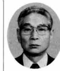
鈴木氏 大正14年1月2日生

十二月定例会市議会は、十二月十六日から二十三日までの八日間開かれ、昭和五十六年度一般会計、特別会計の決算、国民健康保険条例の一部改正五十七年度一般会計補正予算など十二議案と請願三件、陳情二件を審議しました。 おもなものは次のとおりです。詳細は来月二十五日発行の議会報でお知らせします。 国保条例の一部改正 来月一日から施行になる老人保健法の制定に伴う改正と被保険者であることを手続しなかったり、虚偽の届けをした場合などの過料を二万円から二万円に引き上げたものです。 56年度決算 昭和五十六年度決算は、表に掲げたような歳入歳出総額になり、一般会計で一億七百二十