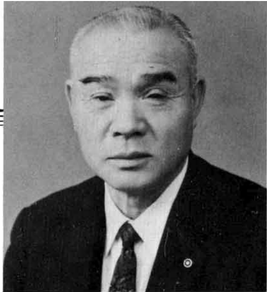
市長 渡辺 芳夫