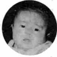
下来伝 佐藤明人 1月11日 3ヶ月児健診

会場 ▶ 市役所別館 時間 ▶ 午後1時までに集合 ※6か月児健診には、茶わん・スプーン・筆記用具を持参してください。 ※3歳児健診では尿検査を実施します。 ※必ず母子手帳を持参してください。 ※受診は栃尾市民に限ります。