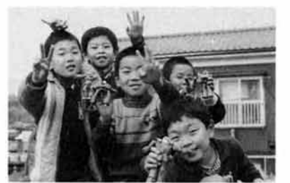
西片朗夫君ら右前 (栃尾東小)