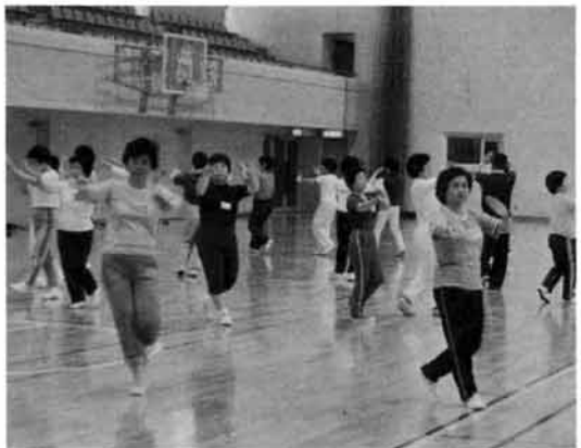
軽体操の「さわやか教室」

総合体育館の完成に伴って昨年、社会教育課が行った婦人さわやか教室、婦人バレーボール、高齢者すこやか教室は、おおせいの参加を得て終了しました。