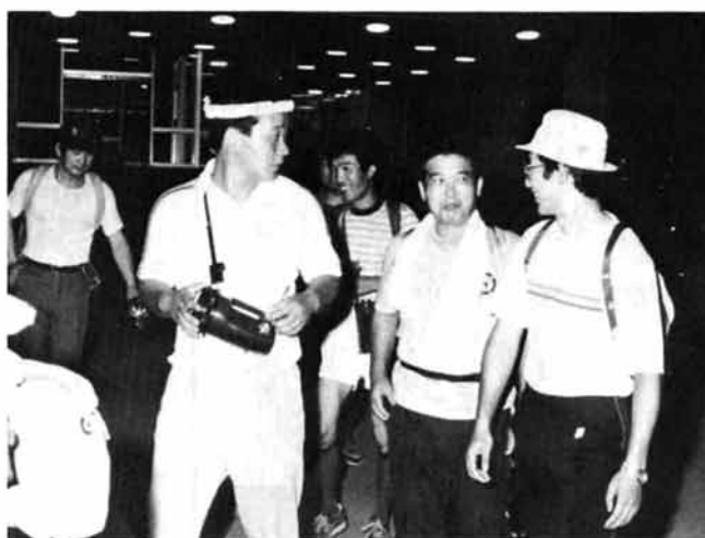
市民会館出発 午後8時30分

私たちの計画 したこの大会に、 こんなに多くの市民が参加されて うれしいと同時に驚いています。 車社会の今日、歩くことが健康 によいとわかっていても、一人では できないし、この機会にと参加 されたのでしょうか。 なんといっても全員が完歩でき たという、このことが一番うれし いことでした。アンケートでも、 やってよかったという人ばかりで した。来年もやりますよ。