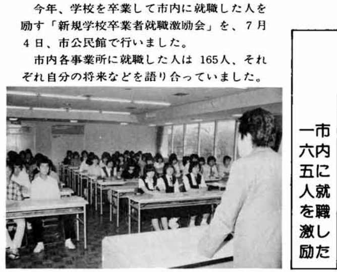
市内一六五人を 一六五に就職した 今年、学校を卒業して市内に就職した人を励ます「新規学校卒業者就職励会」を、7月4日、市民館で行いました。市内各事業所に就職した人は165人、それぞれ自分の将来などを語り合っていました。