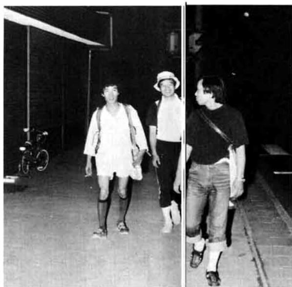
マイスタイルでマイペース