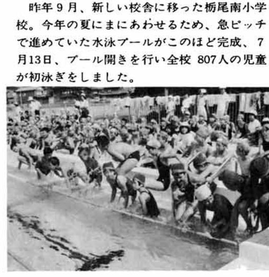
栃尾南小プール完成 八〇七人が初泳ぎ 昨年9月、新しい校舎に移った栃尾南小学校。今年の夏にまにあわせるため、急ピッチで進めていた水泳プールがこのほど完成、7月13日、プール開きを行い全校 807人の児童が初泳ぎをしました。