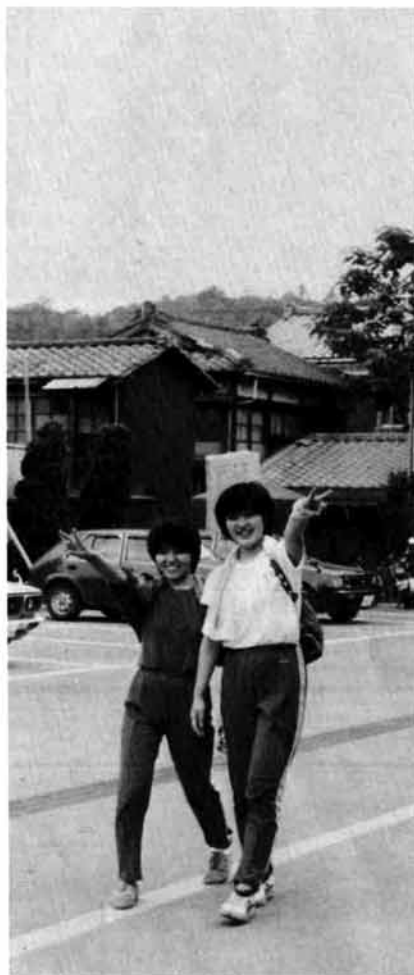
誓いどおりがんばってVサイン