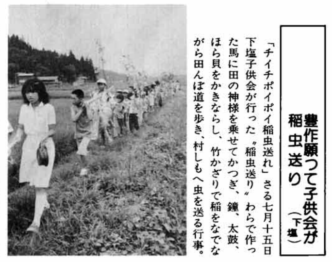
豊作願つて子供会が 稲虫送り(下郷) 「チイチイポイ稲虫送れ」さる七月十五日下郷子供会が行った。稲虫送り。わらで作った馬に田の神様を乗せてかつぎ、鐘、太鼓、ほら貝をかきならし、竹かざりで稲をなでながら田んぼ道を歩き、村しもへ虫を送る行事。