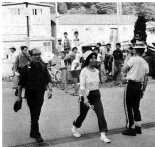
お疲れさま、と拍手に迎えられて