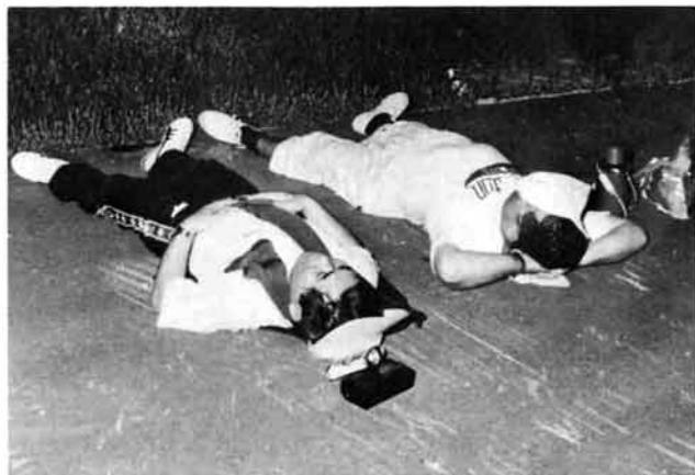
最後までがんばろう。やりましょう。いやまったく。そろそろ眠いですなあ。