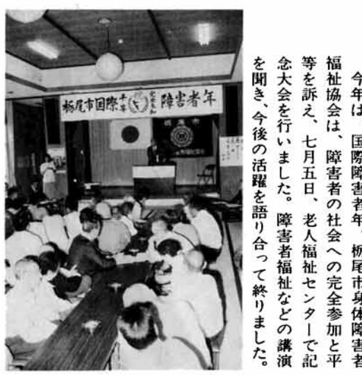
障害者年で記念大会 今年、国際障害者年。栃尾市身体障害者福祉協会は、障害者の社会への完全参加と平等を訴え、七月五日、老人福祉センターで記念大会を行いました。障害者福祉などの講演を聞き、今後の活躍を語り合っていました。