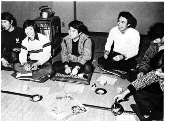
練習も終え、ふだん着に着替えての座談「何とかが型になってきたねえー」の話もできてきた。

古くから伝わる踊りをよみがえらせ地域のコミュニケーションづくりを進めている地区があります。過疎の歯止め対策として、地域づくり集会、連帯感を深めるために機関誌「ふるさと」を刊行している西中野侯地区がそれです。現在は百三十一世帯になった部落に二十八人が青年団を構成しています。若い人もムラに伝わる踊りを受けついで……と話がありました。踊りなんて」とすぐには飛びこめなかったが、今では中野侯地域の新山、繁窪の部落も合せて若者二十四人が冬場の毎週日曜日、部落のコミュニティセンター「ふるさと会館」で練習に励み、青年団が「おらのムラに伝わる踊りを受けついでくれる」と部落の人から期待がかけられています。