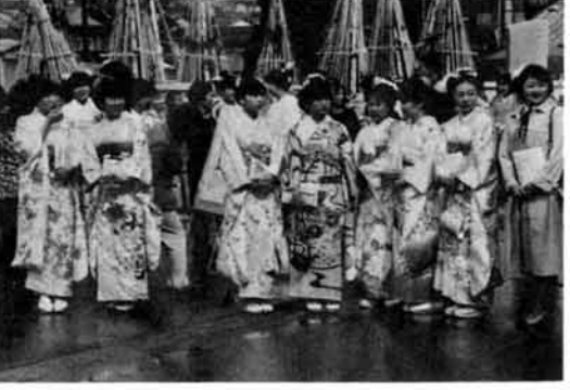
栃尾市33回成人式 五二三人が祝福を受ける

33回目の成人式をさる4月5日、市民会館で行い513人が成人の祝福を受けました。晴着姿に着飾った女子と近年多くなった羽織袴姿の男子が、式典のはじまる午前10時前に集まり、談笑に花を咲かせていました。