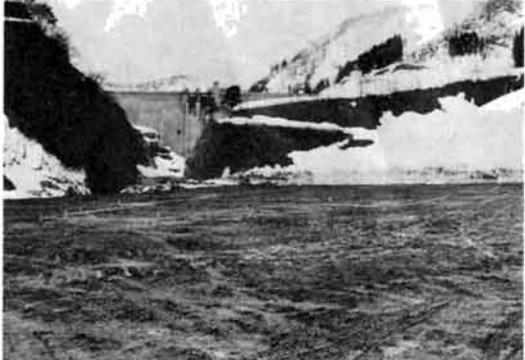
農協の保養センター 栃尾のダム左岸に建設

守門、道院周辺開発を進めている中で、栃尾市農協は、生命共済連の協力を得て、刈谷田川ダムサイトした左岸に建設することにしてた保養センター(933平方m)の起工式を、さる3月27日現地で行いました。