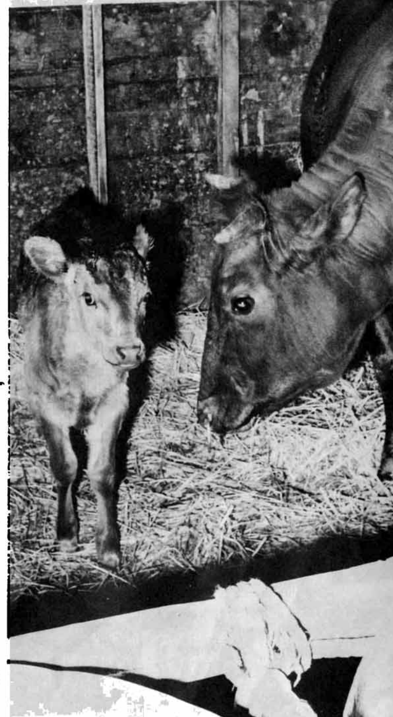
雌牛返せば素牛は自分のものに

高齢者、農業主で一定の期間出かせぎなどをしなければならぬ人に、雌肉牛を貸し付けて肉牛資源を増やしていく制度「高齢者等肉牛飼育事業」が軌道に乗り、子牛が誕生しはじめています。この制度は、昭和五十三年に農林水産省が、高齢者の生きがい対策と冬期間など一定の期間、農作業に従事できない人のためにはじめたもの。栃尾市は、五十四年度に十五頭、五十五年度に十四頭の育成雌牛を導入して、それぞれの借り受け希望者に貸し付けていました。この繁殖牛の雌牛を育成して市へ返せば、素牛は貸り主のものとなるものです。