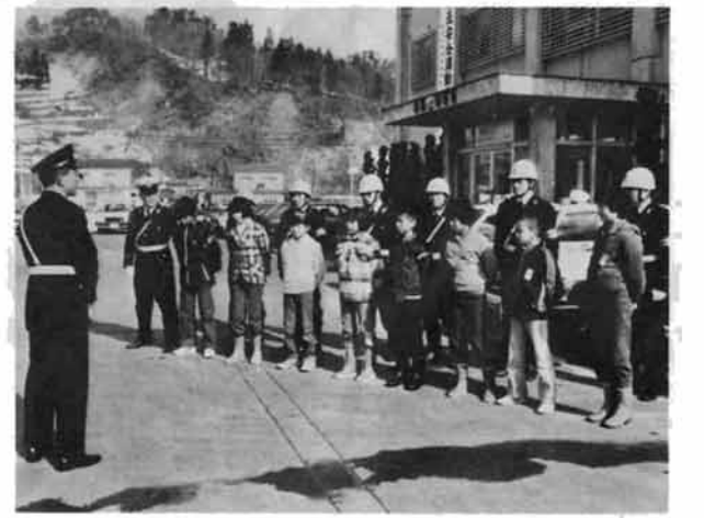
「パトロールで気づいたことは友達にも話して……」と中村署長。