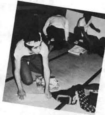
練習が終って衣装がたづけ