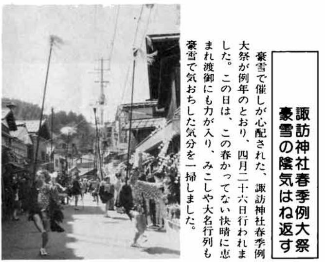
諏訪神社春季例大祭 豪雪の陰気はね返す 豪雪で催しが心配された、諏訪神社春季例大祭が例年のとおり、四月二十六日行われました。この日は、この春かつてない快晴に恵まれ渡御にも力が入り、みこしや大名行列も豪雪で気おちした気分を一掃しました。