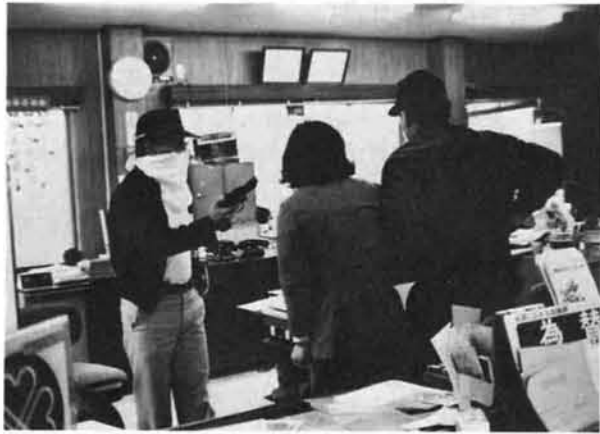
ピストルを手に現金を要求 (荷頃支所)

栃尾農協荷頃支所に二人組の強盗が入り、お客や女子事務員にピストル、ナイフを突きつけて脅かし、百万円を強奪して逃走、同支所は騒然となりました。しかし、四十分钟后に緊急配備の栃尾署員に逮捕された。