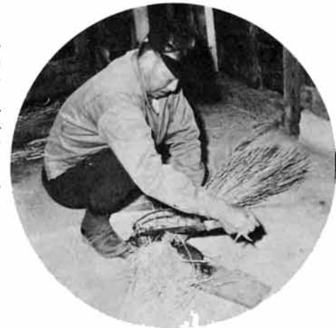
かわいい子牛のえさづくりに余念がない

飼育ができます。昭和五十三年度に入ってきた素牛からは、今年に入って子牛の誕生があいつぎ、栃尾の