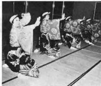
姉さんたちが見本を披露