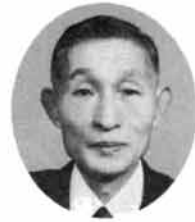
大港文治(三) 山田町七番四号三三六一

ないのです。これと同時に、万一、国家権力が不当に行使された場合には、これによる侵害から国民の自由などを保護する役割を持っています。このような役割を持つ法の下の国が、安心して平和な生活を営むことができるわけです。このように「法の支配」は、民主主義国家において欠くことのできない国家統治原理とされています。国民の一人ひとりが、自らの基本的人権を尊重し、法を守るといふ意識を持つことによつて「法の支配」は完全なものになるといえましょう。