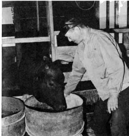
心のこもったえさを食べ、何か語り合うようです

この高齢者等肉牛飼育事業は、高齢者、農家で基幹的な役割をしている男子が一定の期間出かせぎなどで農作業に従事できない人に、それを補うとともに福祉の向上をねらったものです。乳牛、豚、鶏卵などの生産調整が行われていますが、肉牛は、資源確保が行われていることから明るい見通しの事 業といことができません。借り受け対象は、市内に住む六十歳以上の人か、農業主が年間百五十日以上出かせぎをしなければならぬ人などの要件はあるものの、借りた牛から五年間に雌牛一頭を市へ返せば素牛は自分のものになります。しかも、一人が二頭まで借りることができ、自家で飼料が確保できれば効率のよい