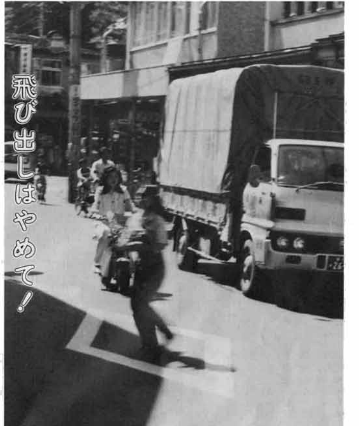
飛び出しはやめて!