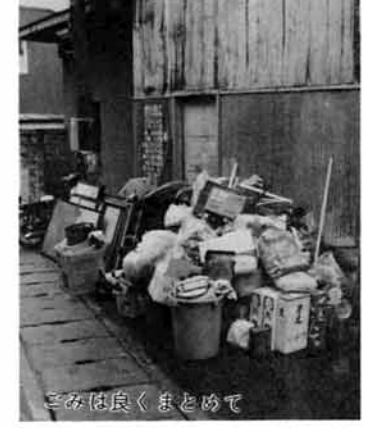
ごみは良くまとめて