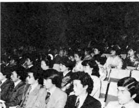
五九〇人が成人の仲間入り

さる4月6日、第32回成人式を市民会館で行いました。今年、成人式を迎えた人は590人(男305人、女285人)。式典のあと参加者は、精いっぱい青春をおうかしていました。