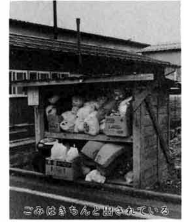
ごみはきちんと出されている

危険物も運搬や処理をしやすいうように梱包していただくことはもちろんですが、揮発性のものが入っていたかん類は数か所穴をあけるなどして安全策を講じてください。