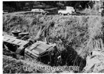
軽井沢市内の交通事故

群を抜いて多くなっています。次に、とび出します。自動車の前後からの飛び出し。ものかげからの飛び出しがその大半を占めています。車種別では、バイクが最も多く、原因も法令を守らず運転して事故に遭っているようです。たとえば、右左折の合図を出さずに方向を変えたり、むやみに大型車の間に突っ入りして事故にあっています。交通弱者といわれる児童、老人の事故は、夕方に多く日