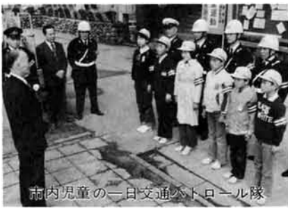
市内児童の一日交通安全パレード

このような環境にあつては住民一人ひとりが注意しあうと同時に、事故につながりやすい「スピード」を控え目に運転することです。また、幹線道路の駐車も目につきます。道路が狭いゆえに、車の前後からの飛び出しがあらうものなら、すぐ事故につながります。違法の駐車はやめましょう。