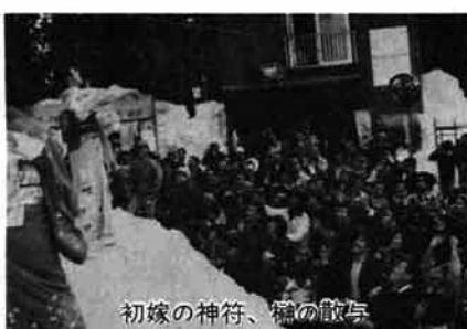
初嫁の神符、櫛の散与