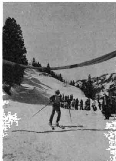
恒例の第三十九回守門滑降距離スキー新潟県選手権大会が、去る三月十六日(日)守門岳を会場に開催されました。 大会当日は晴天に恵まれ、参加選手二百二十名(滑降部門七十名・距離部門四十二名)、役員二百余名で競技運営が行われました。