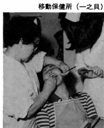
移動保健所 (一之貝)

百八十八万円となり、当年度純利益は、四万円の予定です。建設改良事業は、未普及地域の泉地区などに本支管を布設するため一億九千九百万円を計上し、安定供給を図るようにはしました。