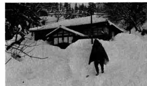
積雪四メートルを超える半蔵金地区に集落センターを建設