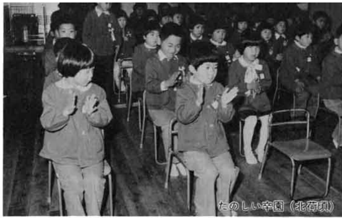
たのしい卒園 (北荷頃)