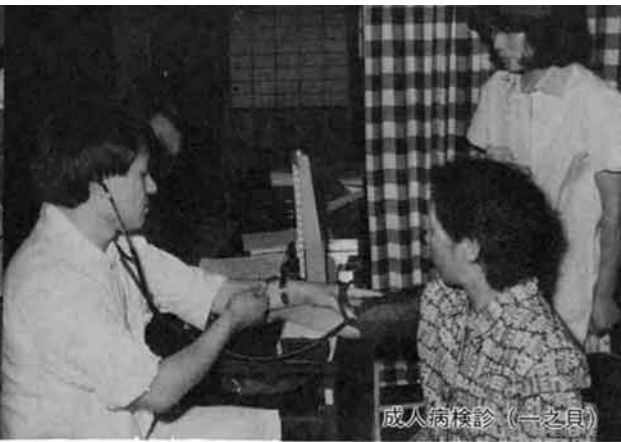
成人病検診 (一之貝)