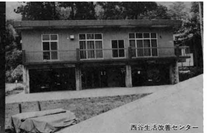
西谷生活改善センター