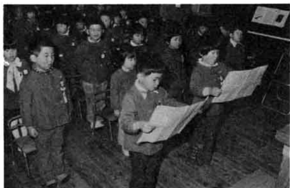
去る3月23日(日)、曹源寺保育園で卒園式がありました。今年市内の卒園者総数は400人で、男193人、女207人です。卒園おめでとう。