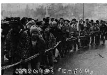
村内をめぐり歩く「じゆざくり」