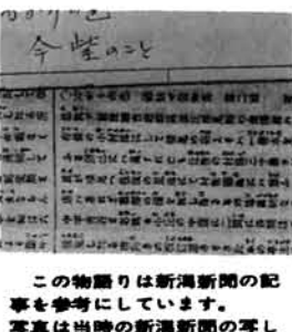
この物語りは新潟新聞の記事を参考にしています。写真は当時の新潟新聞の写し

り、単なる物語りではなくてその人間関係をかなり忠実に記しております。残念なことには、新聞、雑誌に掲載されたという任侠ぶりは何も伝えられておりませんが、筆者の実家の本家も今紫の生家とは親戚だったらしく、筆者の祖父が養子になったが、出稼ぎに行つたまま行方不明になつたと記されておりますが、母の記憶では大橋家に養子にな