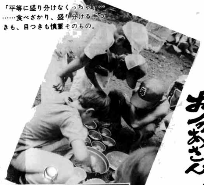
「平等に盛り分けなくっちゃ」……食べざかり、盛り分ける手つきも、目つきも慎重なもの。