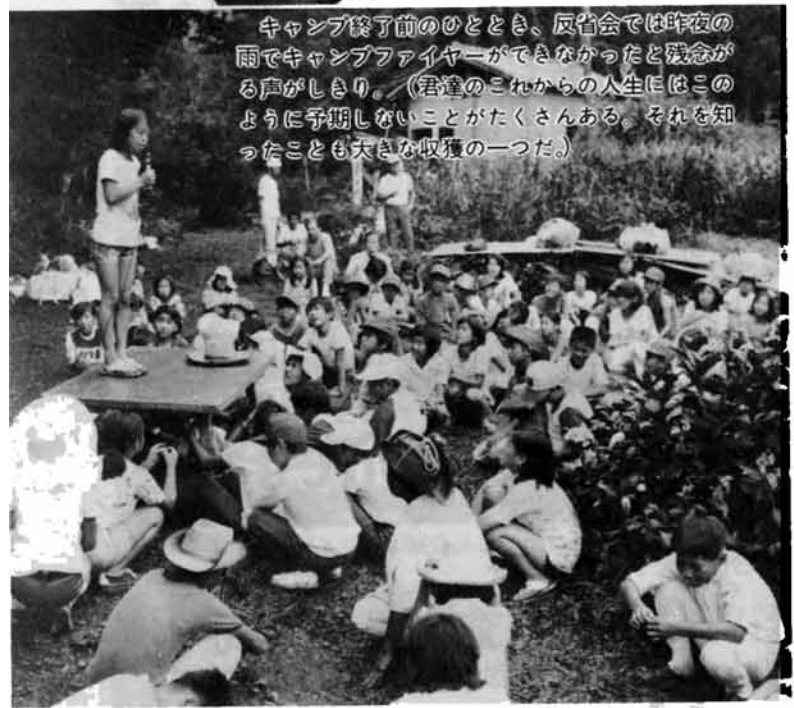
キャンプ終了前のひととき、反省会では昨夜の雨でキャンプファイヤーができなかったと残念がる声がいっぱい。(君達のこれからの人生にはこのように予期しないことがたくさんある。それを知ったことも大きな収穫の一つだ。)

この言葉を合言葉に、みんなが平等に責任を分かちあい、残り少ない小学生生活を締めくくるにふさわしい一泊二日の貴重な体験でした。