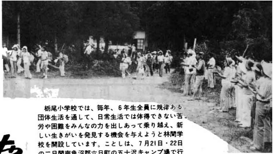
栃尾小学校では、毎年、6年生全員に規律ある団体生活を通して、日常生活では体得できない苦労や困難をみんなの力を出しあって乗り越え、新しい生きがいを見出す機会を与えようと林間学校を開設しています。ことしは、7月21日・22日の二日間南魚沼郡六日町の五十沢キャンプ場で行いました。(先発隊の拍手に迎えられて到着)