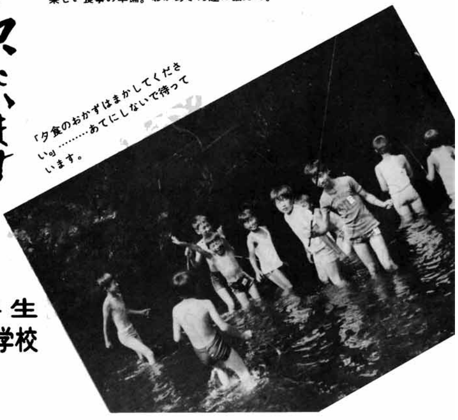
「夕食のおかずはまかして下さいます。……あてにしないで待っています。」