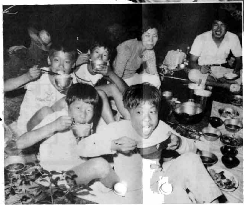
おう盛な食欲に、お母さんの顔もほころびます。