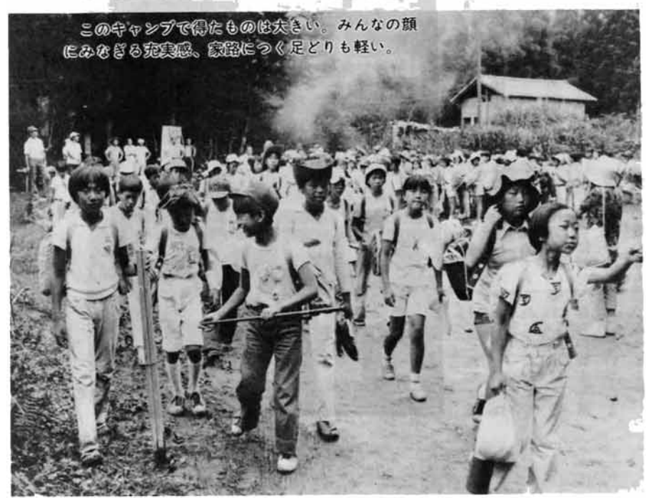
このキャンプで得たものは大きい。みんなの顔にみなぎる充実感、家路につく足どりも軽い。