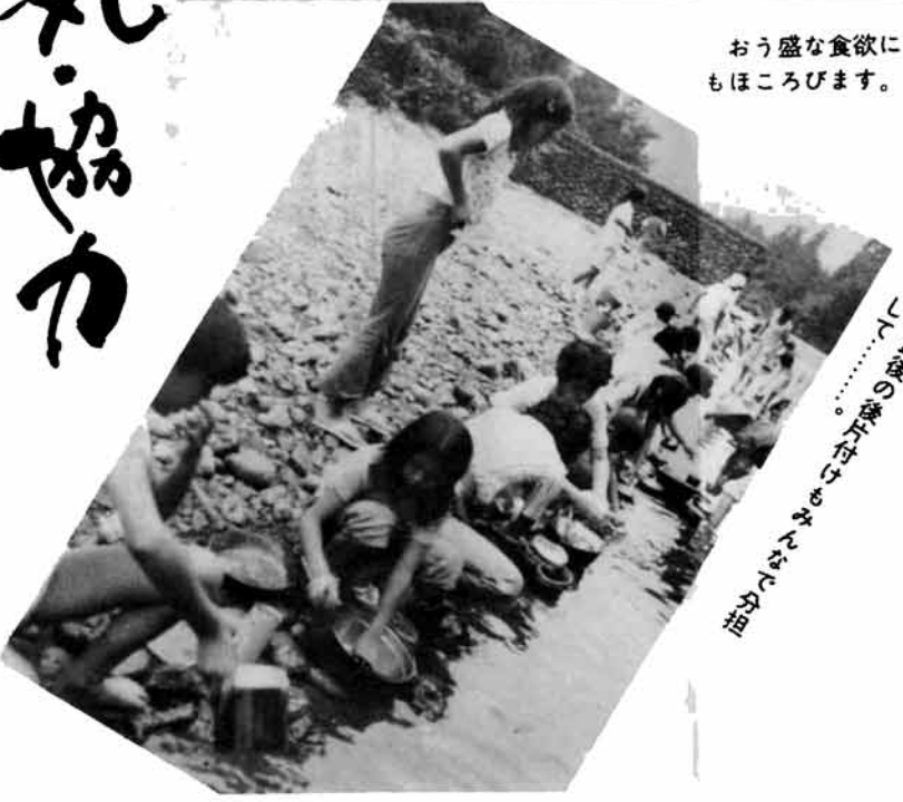
……はげしい自然の環境