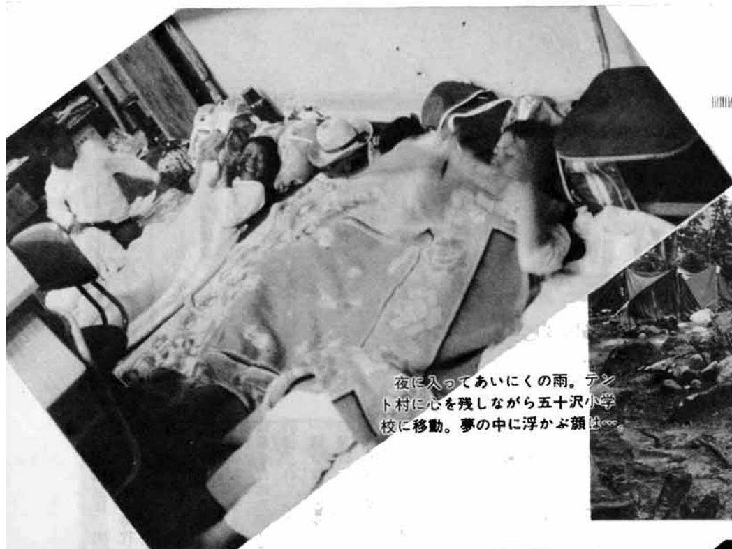
夜に入ってあいにくの雨。テント村に心を残しながら五十沢小学校に移動。夢の中に浮かぶ顔は...