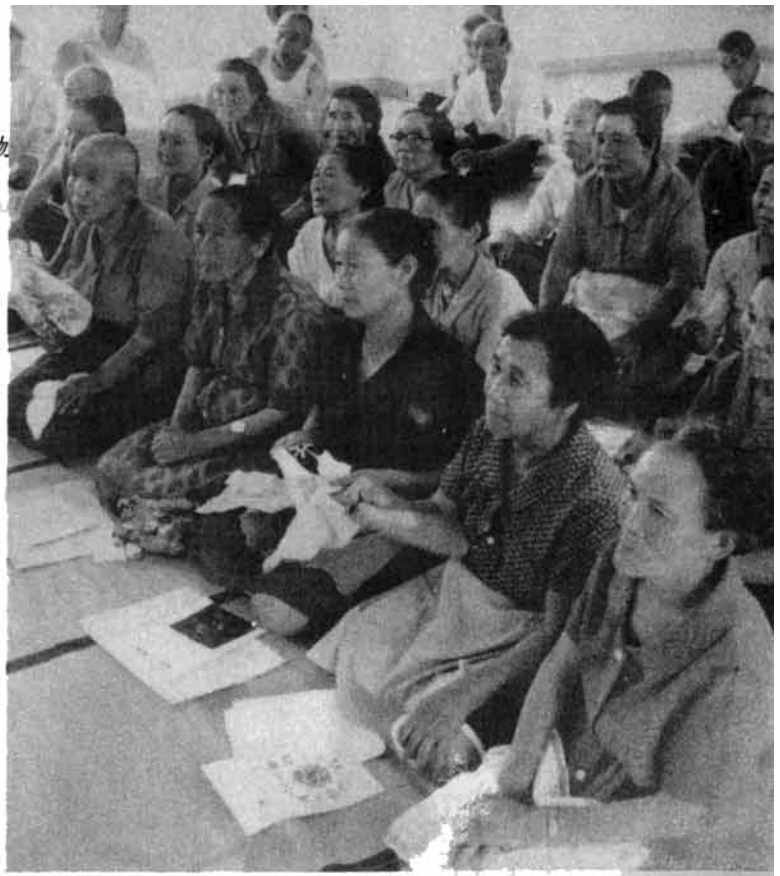
老人福祉週間 15日 から