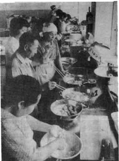
健康食の実習……高須老人学級

保健婦および看護婦 保健婦または看護婦の資格者(49年3月末日までに資格取得見込みの者を含む)で24年4月2日以後に生れた者 集会場は、市の中心部に市民会館、各地区には地区開発センター