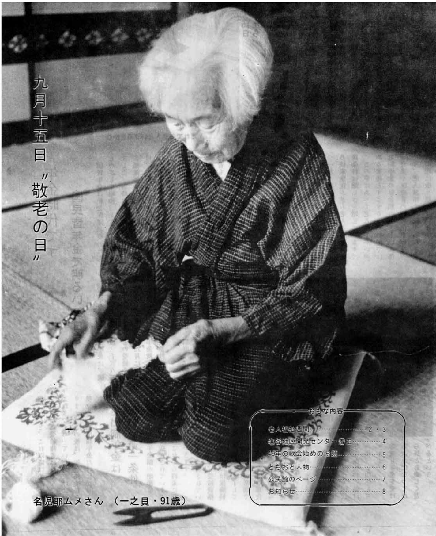
九月十五日 // 敬老の日 //