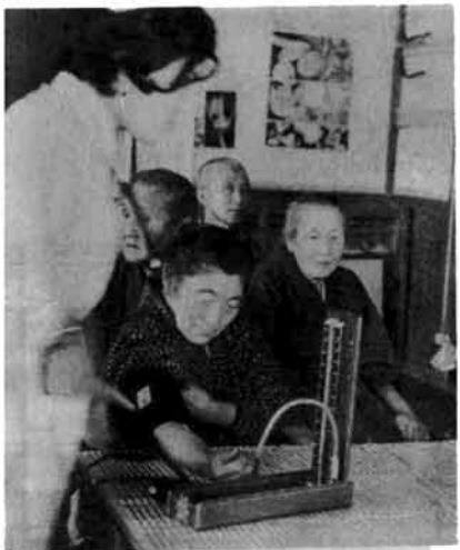
お年寄りには定期健康診断を

や克雷センターを建設して、今後大いに老人学級に力を入れます。 国の老人対策 国の老人対策は、厚生省を中心に各省庁においてそれぞれの立場から進められてきましたが、これを総合的な対策として進めるため内閣総理大臣を本部長とする老人対策本部を設置するとともに、内閣総理大臣官房に老人対策室を設置して各方面から総合的に老人対策を進めることにしています。