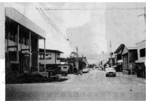
〔市街地の道路は整然と整備され将来の発展性を秘めている〕

白鷹町とは歴史と企業が縁結びとなり、友情と信頼にもとづき産業、経済、文化の交流を図り、互いに飛躍していくことになりました。白鷹町は、山形県の南部に位置し、最上川が町の中央を流れ、東、西、北方を飯豊連山に囲まれ、栃尾市に類似しています。しかし、国鉄長井線が長井市の今泉駅から白鷹町の中心地荒砥まで通っており、交通は確保されており、現在のところ計画はきまっていますが、白鷹町と相互に理解を