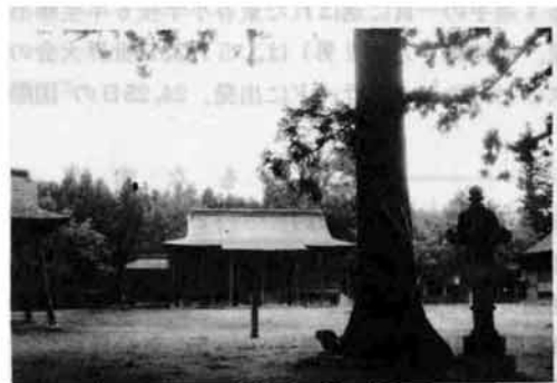
〔鮎貝八幡宮(鮎貝城址)本庄氏はこの地に居住した〕

深め、協調して産業、経済、文化の交流を深めていきます。白鷹町は、面積一五七・二二平方キロ、世帯数四、五四五世帯、人口二〇、〇三八人で産業は、農業が五八％、製造業が一四％、農家は五〇アールから一〇〇アールまでが一、〇九二戸一〇〇アールから二〇〇アールまでが九九八戸となっています。農産物は、米作のほかに、養蚕で耕作面積は平均八四アール、畜産、果樹、ホップ、タバコなどがおもなものです。このほかに、養蚕についても研究する意向があり、本市から稚魚を移送、持ち帰るなどして産業振興に意欲を示しています。