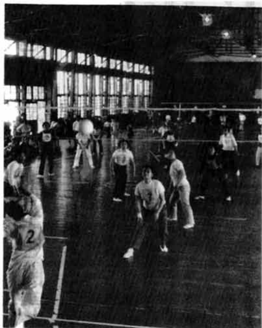
元気なかけ声で試合開始。バレーボールに汗を流すママさん選手たち

婦人バレーボール親善大会をさる五月二十八日、栃尾小学校で行なわれました。 これは、婦人スポーツの関心を高めるとともに、バレーボールの実践活動を通じて健康な心身の維持増進をはかろうと開催したものです。 この日、参加したママさんチームは六チーム。この日のために夜間7時半から九時まで、家庭の協力を得て練習とチームづくりをすすめてきたものです。 「お母さん、ガンバレ!」子ども達やお父さんの声援を受けて試合開始。公式試合は初めてのせいかなかなか練習の成果を発揮しきれず珍プレーが続出。 各チームとも三試合ずつのプレーで汗びっしょり。表彰式では腰の痛みも忘れ思わずニコニコ。各チームには、次のような賞がわたされました。 チームワーク賞 金沢チーム 敢闘賞 土々町チーム、努力賞 旭町チーム、同、表町チーム 奨励賞 栄町チーム、同 金町チーム。