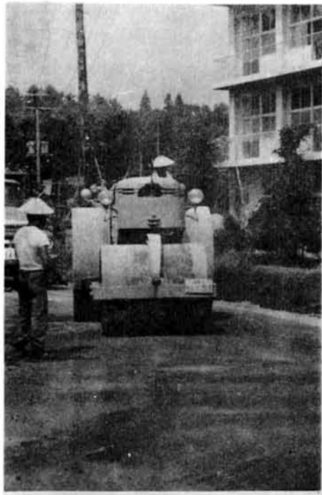
炎天下の舗装工事(下塩地内)

市は、市の発展は道路整備からと、いままです。道路整備を行政の重点施策にとりあげてきました。特に、ここ数年市道の舗装、改良に重点をおいています。今でも市内の各所で工事が行なわれており、みなさんには不便をかけるかもしれませんが早く良い道に生まれ変わるよう力を願っています。今月は、市道がどのようなようになっているかをとりあげてみました。