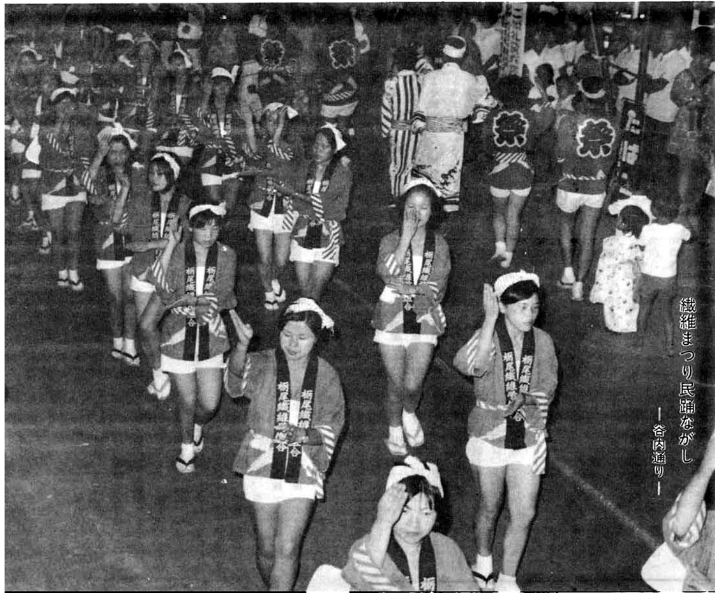
織まったり民踊ながし ——谷内通り——

とちお第一七七号昭和四十六年九月十日発行 毎月十日一回発行(定価一冊四円) 昭和三十三年二月二十日第三種郵便物認可