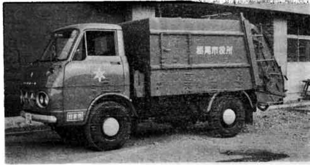
こと新しく購入したごみ収集車(ロードバッツァー)