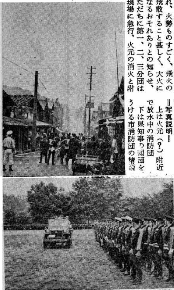
写真説明 上は火元(?)附近で放水中の消防団。下は県知事の周囲をうける市消防団の情勢。

防自動車も参加、猛火ならぬ猛煙(発煙筒を使用)の中を消火(?)にあたるようすは一朝有事の消防団として、心強いものがある。