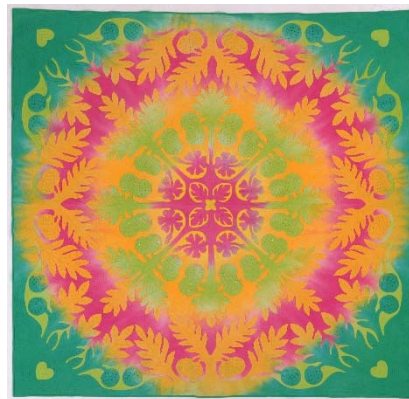
「サマーレインボー」

島の作品展です。故郷ゆかりのハワイアンキルトやアメリカンキルトなど、色彩豊かな作品を展示します。観覧料 一般600円、大学生・高校生300円、中学生以下無料