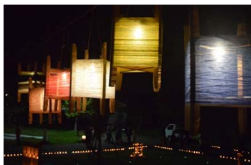
▲糸繰り木杵に栃尾産の糸や布を巻いて作られたランパ。雁木通りや神明橋、極楽通り、秋葉神社などに大小合わせて1,600個が飾られました。