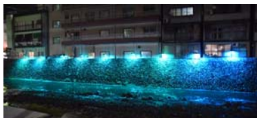
▲西谷川の護岸もライトアップ