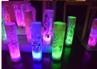
◀◀保育園・幼稚園の子どもたちが折り紙を使って作ったランパ(表町・雁木の駅)