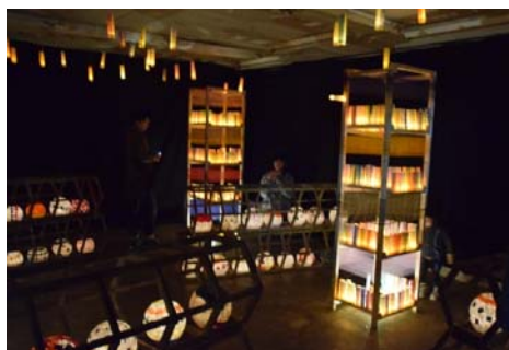
▲秋葉中は、来場者にもランパを設置してもらって参加型の展示(谷内・よつげ場)