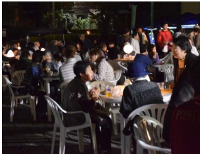
▲地元の商店などが出店した秋葉門前ナイトマルシェは大盛況

10月14日(土)~15日(日)の2日間のイベントに訪れたのは延べ約10,200人。