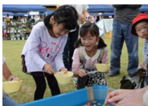
▲スーパーボールすくいに夢中の子どもたち