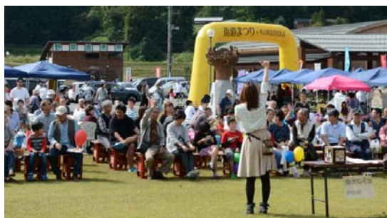
▲ビンゴ大会の様子。お得なプレゼントが当たりました。