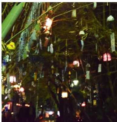
▲秋葉百八風鈴灯では、秋葉神社の参道に風鈴とランパで飾り付けた竹のアーチを作り、来場者を迎えました。

スタンプラリーも行われ、訪れた人はたくさんの方の手によって彩られた夜の栃尾を思い思いに楽しみました。