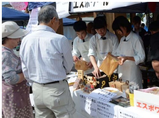
▲栃尾高校生の企画による、あぶらげを衣にしたコロッケ・「あげおのじゃがお」も販売。オープン前から行列ができ、用意した100個が約2時間で完売となりました。

訪れた人たちは美味しいものでお腹を満たしながら、ステージイベントなどで秋の1日を楽しみました。