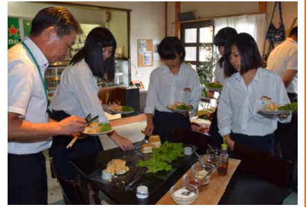
▲9月8日(金)に行われた試食会の様子

地域と連携した活動に取り組んでいる栃尾高校では、地元の飲食店などと共同で地元産食材を使った商品を開発しています。先日、高校生が考案した2種類のレシピを基に地元の飲食店が試作し、農業関係団体などを招いて試食会を行った結果、あぶらげを衣にしたコロッケの商品化が決定。その名も「じゃがお」。10月8日(日)に道の駅で行われる街道まつりでの販売に向け、準備を進めています。