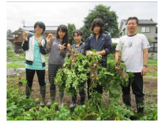
▲農村ホームステイのようす