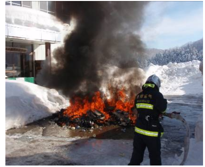
▲1月12日の発火事故のようす