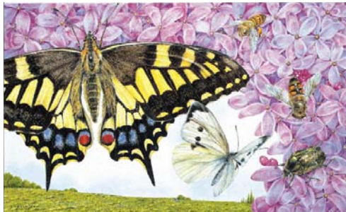
「花祭りのお客様」

自然を愛しながら、小さな命の尊さを描き続けた くまだちかほ 熊田千佳慕の作品およそ100点を展示します。 と き 7月20日(金)～9月6日(木) 観覧料 一般500円、大高生250円、中学生以下無料 問合せ 栃尾美術館 ☎53-6300