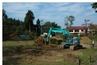
▲工事中の秋葉公園