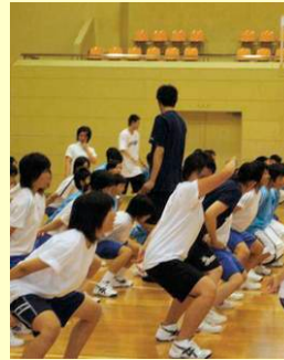
バスケットボール教室の様子