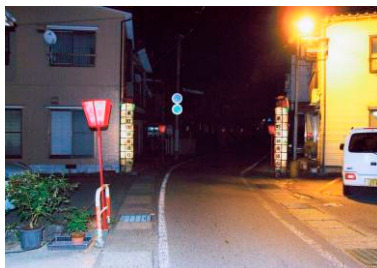
まつり灯籠の設置

【おもてなしの心を育む栃尾・誰でもガイド】 イベント開催時にガイドセンターを開設。また、新規ボランティアガイド養成講座の実施。