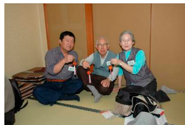
できあがったてまりを片手に満足顔のツアー参加者

【栃尾文化探訪「ふるさとの技・雁木・食を訪ねて」】 てまりや雁木についての講座を取り入れたバスツアーの実施。