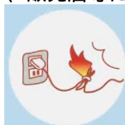
コードを束ねて使う