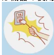
コードを無理に引っ張る