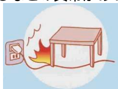
コードに物をのせる

コードが異常に熱くなる、変なにおいがする、コードに触れると電気が入ったり切れたりするなどの異常があった場合は機器の使用を中止し、販売店等に相談してください。