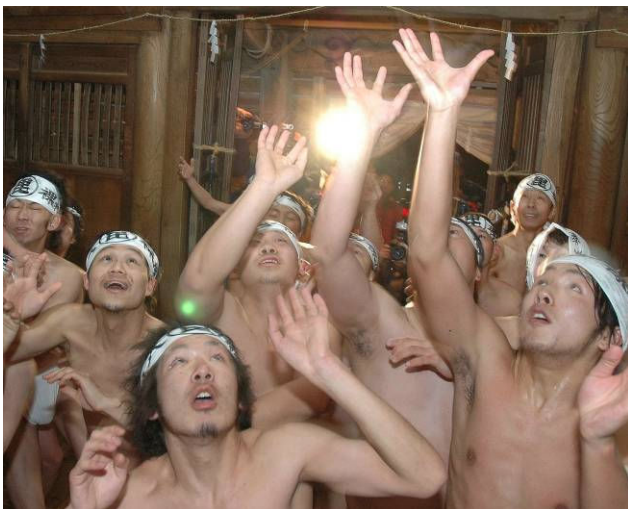
▲昨年の祭りのようす。天窗からまかれる270枚の福札を奪い合います。