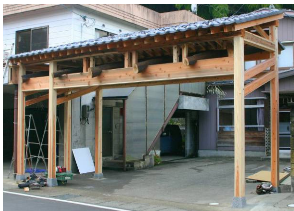
▲完成した雁木。古材と集成材を組み合わせることで世代を超えた交流を表現しています