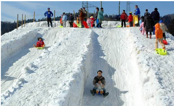
▲大人気の巨大すべり台

※無料シャトルバス運行します 中央公園⇄おりなす 運行スケジュール等はお問合せください。