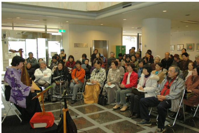
▲めずらしい薩摩琵琶の演奏会に多くの観客が訪れました

12月17日、栃尾美術館で薩摩琵琶演奏会が開催されました。川中島の戦いや那須与一など、栃尾地域ゆかりの物語が、薩摩琵琶の音とともに語られました。訪れた観客は「生の琵琶の音を聞くのは初めて、感動しました」と話していました。