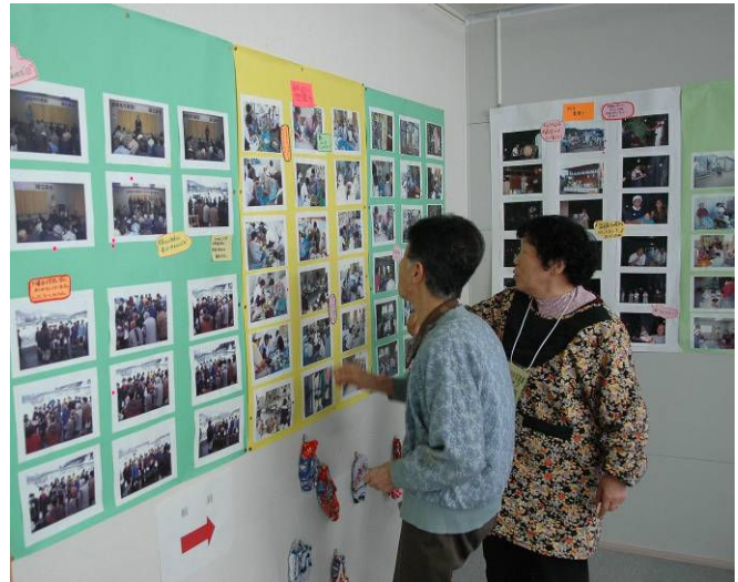
▲仮設住宅の住民の方から、写真の説明を受ける見学者。会場には約1,600枚の写真が展示されました