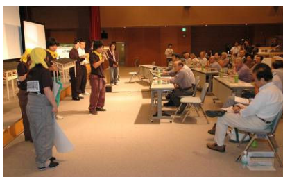
▲9班で競い合ったデザインコンペ（9月30日）

12月21日、栃尾表町（岩神）区と新潟大学が中心となって進めていた、雁木が完成しました。今年の雁木は、「表町おもてなし」をキーワードに、角材と丸太をたくみに組み合わせて、見る角度によって表情を変えるデザインとなっています。