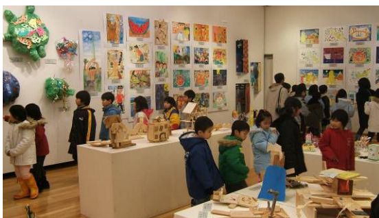
▲今年の作品展のようす