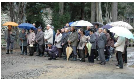
▲橋の安全を祈願する住民の皆さん

12月20日、主要地方道栃尾守門線の新山地区に架かる坂下橋が完成しました。震災により架け替え工事を進めていましたが、このほど竣工し、地元住民や関係者らが橋の安全を祈願しました。