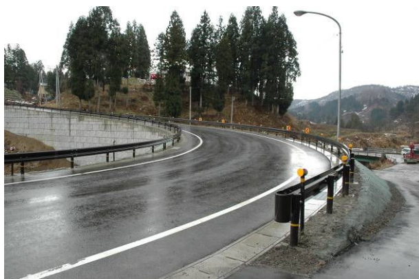
▲完成した坂下橋。右奥に見えるのは旧坂下橋