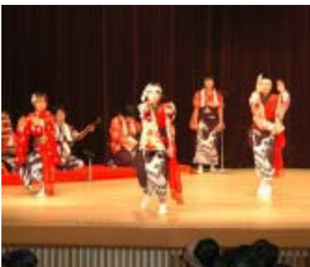
伝統芸能を披露した中野俣小児童

受賞対象となった功績 昭和五十年五月から平成十五年四月まで二十四年にわたり、市議会議員を歴任されました。この間、市議会副議長、議会運営委員会委員長、農業委員長、議会運営委員会委員長、農業委員長