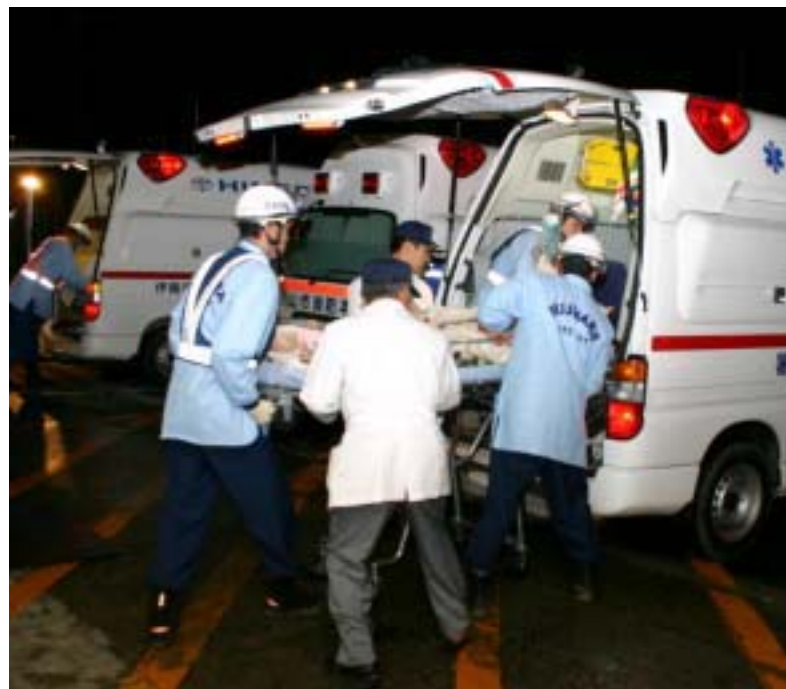
入院患者の安全を確保するため市外の病院に移送した栃尾郷病院。県内外の救急隊が救急車で搬送を行いました

10・23地震災害で被災された市民の皆様は、謹んでお見舞いを申し上げます。 さて、十月二十三日の午後五時五十六分に震度六弱の地震が当市を襲い、午後六時十一分に震度五弱、午後六時三十四分に震度五弱の地震が発生しました。さらに、二十七日午前十時四十分、震度五強の地震が起きるなど、おびただしい回数に余震に見舞われました。気象庁では、