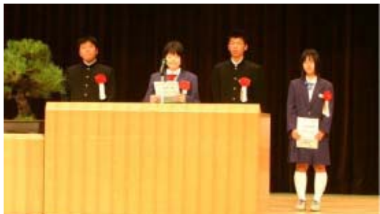
市民憲章を朗読する秋葉中学校と刈谷田中学校の生徒

これからの時代に対応する「自然と人が共生するまちづくり」のため、生活環境の整備、福祉・教育の充実、地域の活性化など課せられた諸施策の遂行に行政、民間活力等を結集して専心努力する所存であります。あわせて、栃尾市が栃尾気質をより一層強く磨き上げ誇れる栃尾市であるよう精進いたします。どうか今後とも、市発展のため特段のご支援とご協力を賜りますようお願い申し上げます。