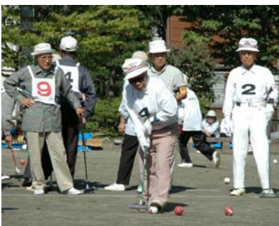
ゲームを楽しむ参加者