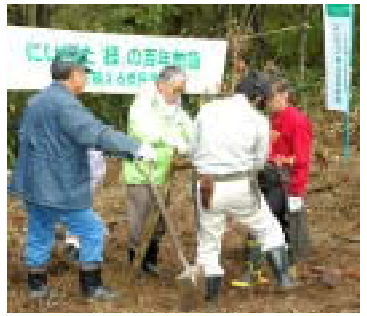
参加者全員で行った植樹

市は、大平山周辺（二百二十一ヘクタール）を自然と触れ合える森として整備を進めています。そこで、皆さんから親しまれ