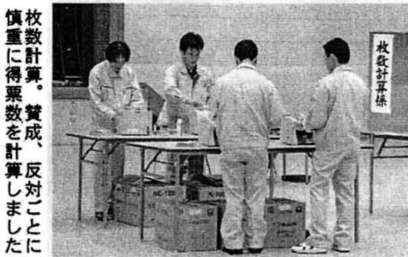
枚数計算。賛成、反対ごとに慎重に得票数を計算しました