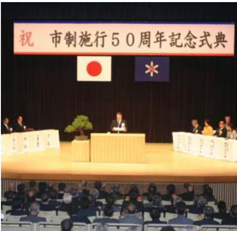
市内外から約350人が出席して挙行された記念式典（市民会館大ホール、10月20日）

本日表彰させていただきまます個人二十一名の方々と四団体の皆様方には、日頃、地方自治、産業振興、社会体育、環境、福祉または教育文化活動、地域活動等それぞれの分野において市政発展のため多大な貢献を賜りました。皆様方の長年にわたるご尽力に対し、心から敬意と感謝の意を表します。どうか皆様方にはますます健康にご留意され、一層のご活躍と市政へのかわらぬご尽力を賜りますようお願い申し上げます。 終わりに、本日ご臨席を賜りました来賓各位には今まで本市に対してひとかたならぬご厚情を賜り、心から感謝を申し上げますとともに重ねて厚くお礼を申し上げます。 今後とも一層のご指導、ご支援を賜りますようお願い申し上げますとともに、皆様のご健勝とご多幸を心から祈念申し上げます、栃尾市の発展を確信いたしまして、式辞といたします。