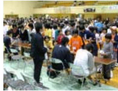
ファンの列ができたサイン会

栃尾市バスケットボール協会は十月十日、総合体育館で新潟アルビレックス・プレシーズンマッチ栃尾大会を開催しました。会場には千人を超える観客が詰めかけ、国内トップの迫力あるプレーに魅了されていました。試合は、三菱電機に六十三対八十六で敗れましたが、観客は「アルビー！アルビー！」と大きな声援を送り、ダンクシュートや三ポイントシュートが決まるたびに、会場は大きな歓声に包まれていました。また、試合前に行われた「栃尾選抜VS見附選抜」のミニバスケットボールと中学生の試合では、ミニバス女子が終了間際に逆転するなど、好ゲームが展開されました。試合終了後は選手のサイン会も行われ、Tシャツなどにサインをしてみらった子どもたちはとてもうれしそうでした。