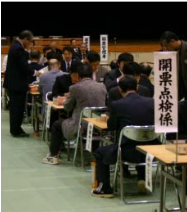
投票用紙を点検する開票点検係。1枚ずつ慎重に確認します（総合体育館、10月17日）