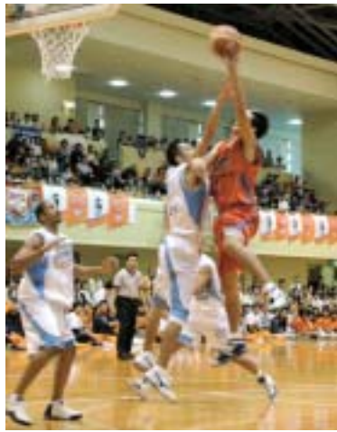
華麗なシュートを放つ新潟アルビレックスの選手

栃尾市バスケットボール協会は十月十日、総合体育館で新潟アルビレックス・プレシーズンマッチ栃尾大会を開催しました。会場には千人を超える観客が詰めかけ、国内トップの迫力あるプレーに魅了されていました。試合は、三菱電機に六十三対八十六で敗れましたが、観客は「アルビー！アルビー！」と大きな声援を送り、ダンクシュートや三ポイントシュートが決まるたびに、会場は大きな歓声に包まれていました。また、試合前に行われた「栃尾選抜VS見附選抜」のミニバスケットボールと中学生の試合では、ミニバス女子が終了間際に逆転するなど、好ゲームが展開されました。試合終了後は選手のサイン会も行われ、Tシャツなどにサインをしてみらった子どもたちはとてもうれしそうでした。