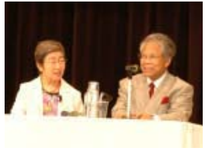
講演する真屋さんと高津さん

第六回社会福祉大会が、市民参加で作る福祉からのまちづくり」をスローガンに市民会館で開催され、福祉の向上に貢献した十六人と三団体が表彰されました。式典終了後の記念講演会では、真屋順子さん(女優)高津住男さん(俳優)夫妻が、「ありのまま、そのままだに生きる」と題して講演。リハビリ生活や夫婦愛など、ユーモアを交えて話しました。真屋さんの介護について高津さんは、「妻に降りかかったことは、自分に降りかかったことと思えば毎日介護をしています」と話し、真屋さんも「リハビリは意識的にやる」とすると大変です。ありのままの自分を信じて、ゆっくりと行っています」と語り、会場を埋め尽くした聴衆は熱心に聞き入っていました。また市民会館前では、ボランティア文化祭が行われ、あいにくの雨にもかかわらず大勢の人が訪れ、炊き出し実践コーナーやフリーマーケット、遊びコーナーなどを楽しむ入りにぎわっていました。