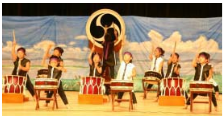
見事なパチさばきを披露したみどり保育園園児

受賞対象となった功績 「火の用心」の巡回活動を、昭和十五年ころから現在まで六十四年にわたり継続して実施。その成果により地域内では四十九年間無火災が続き、火災予防活動に功績を残されました。また、