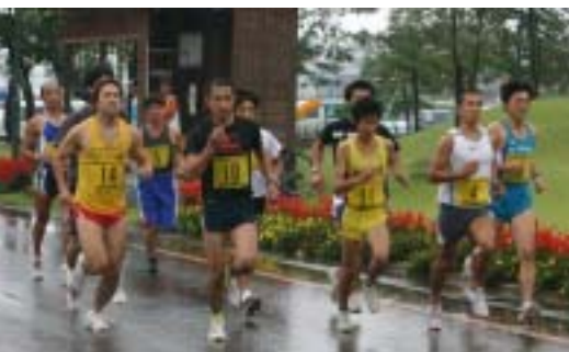
横一線にスタートした一般の部A男子