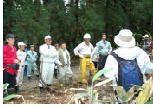
講師の説明を聞きながら自然観察をする参加者たち

これは、県の緑百年物語緑化推進事業に協働し、二十一世紀も市民が自然と触れ合える森を作ろうと行ったもの。この日は、地元住民や中学生、市外から参加した人など約百人が、植樹や自然観察会、林業体験を行ったほか、刈谷田森林組合の人たち