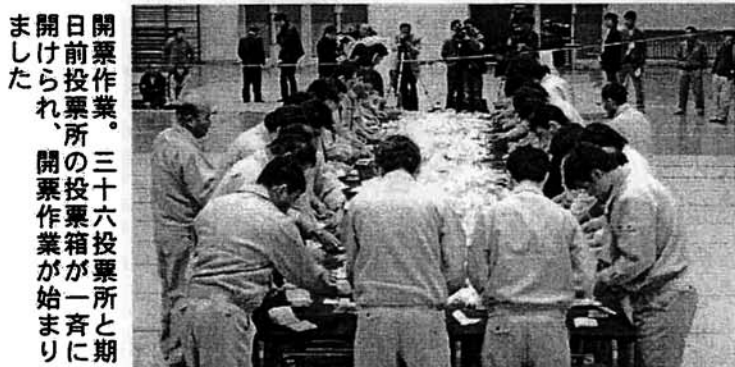
開票作業。三十六投票所と期日前投票所の投票箱が一斉に開けられ、開票作業が始まりました