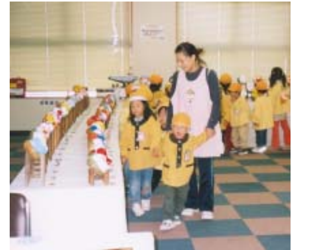
ユーモラスな作品を鑑賞する子どもたち