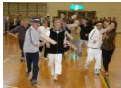
相手を見つけ、ゴールを目指して走った「交通安全標語呂合わせ競走」

元氣いっぱい!! 栃尾市老人クラブ連合会は、総合体育館で体育大会を開催しました。これは、スポーツを通じて健康でさわやかな心身の保持増進と親睦を図ろうと行っているもので、今年で三十一回目。大会には、市内各地の老人クラブから約八百人が参加し、交通安全標語呂合わせ競走や輪投げ競争など全六種目で熱戦を繰り広げ、西谷地区が優勝しました。