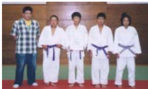
高学年の部 栃尾柔道倶楽部A