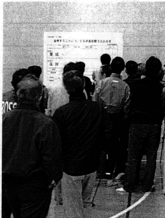
大勢の参観人が見守る中で発表された開票速報(総合体育館、11月7日)

合併することについての可否を問う住民投票については、十月十七日に告示され、二十四日の日曜日に投票が行われる予定でした。 しかし、投票日前日の二十三日午後五時五十六分、震度六弱の地震が栃尾市を襲い、さらに午後六時一分と六時三十四分に震度五弱の余震を観測。気象庁が命名したこのたびの「中越地震」は、市内各地に甚大な被害をもたらしました。このため、