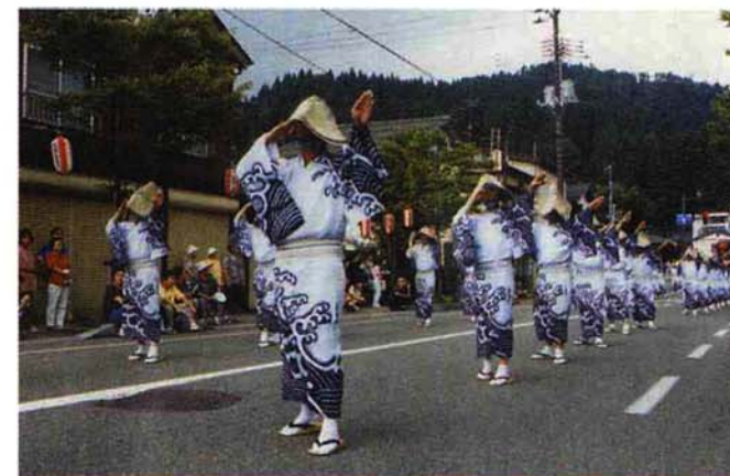
◀ 市役所…おなじみの「相川音頭」（チームワーク賞）