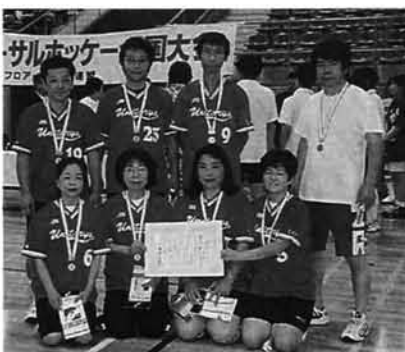
栃尾ユニホッケークラブの皆さん

7月29日に東京都で行われた第16回ユニバーサルホッケー全国大会に、県の代表として出場した栃尾ユニホッケークラブが、シニア(40歳以上)の部で見事3位に入賞しました。