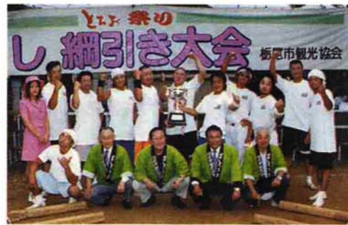
▲男子の部優勝のTEAM BEN 風神