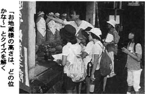
「お地蔵様の高さは、どの位かな」とクイズを解く

市民まちづくり団体「よつたかりうえぶ」は昨年に引き続き、枋坂の「自然・歴史・文化」などの宝物を探す「タウンウォッチング in 枋坂」を開催。小・中学生二十七人が七班に分かれ、七カ所のチェックポイントのうち三カ所を通ることなどのルールを設けたり、クイズに答えたりして、楽しみながら枋坂地内を歩きました。参加者は「地元に住んでいても知らなかったことがあった」などと、枋坂の宝物の多さにビックリしていました。