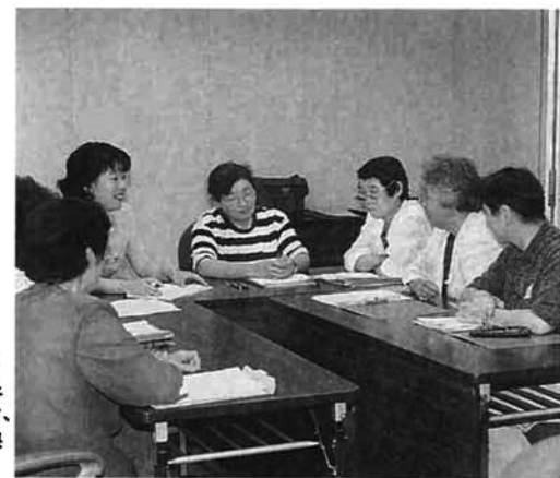
「変だな」と思うことや「ここがよい」と思うことを、熱心に意見交換する参加者

※【ワークショップ】 参加者が専門家の助言を得ながら、問題解決のために協同研究などを行う。