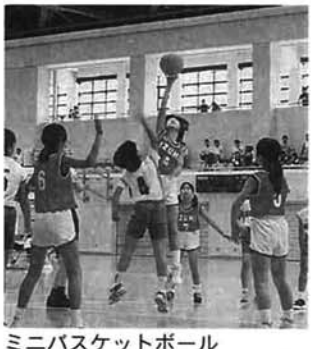
ミニバスケットボール クローバー(上の原町、滝の下町)対 宮・泉(宮沢、泉)