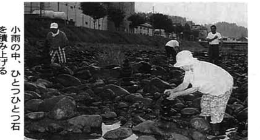
小雨中、ひとつひとつ石を積み上げる

石積みはお盆行事のひとつとして昔から受け継がれてきています。由来は地域により違いがあるようですが、小さい子どものうちに死んだ霊を慰めるために石を積むのだそうです。今年も早朝から、出雲橋付近で石積みが行われていましたが、年々人数が少なくなっているということです。