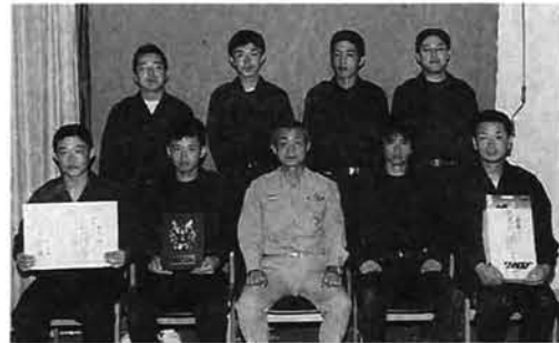
栃尾市消防団第二分団の皆さん

第52回新潟県消防大会 栃尾市消防団4位 8/5 下田村 県大会に市を代表して出場した消防団第二分団は、小型ポン