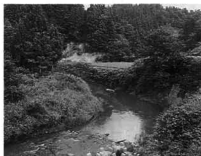
S字形に曲がった西谷川

では、地すべりはなぜ起こるのでしょうか。 新潟県は、全国でも地すべりの危険箇所が多くある県です。県面積の11パーセント、佐渡島の1.5倍の広さです。それは、気候と地質に関係するようです。