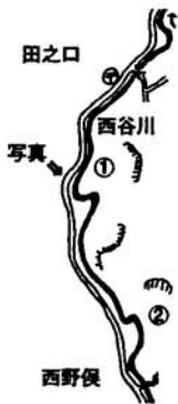
田之口と西野俣間の西谷川の蛇行の様子

西谷地区の田之口と西野俣間に、西谷川が急に直角に曲がっている場所が2カ所あります。ここを通るたびになぜ曲がっているのか不思議でしたが、その地形や地図を見てわかりました。曲がった原因は地すべりです。崩れた土砂により川が曲げられたのです。いづころでできたのか地元の人に聞いてみましたが、昔からすでに曲がっていたかかなり前だろうということでした。