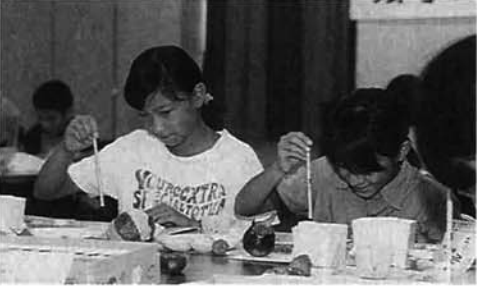
送る人へ思いを込めて、慎重に

「手紙は心と心の架け橋。手紙による交流は心を豊にします」。郵便局絵手紙の会では、会員が講師となり、小中学生の夏休みの思い出づくりにと絵手紙教室を開催しました。子どもたちは、ふだんと違う筆の持ち方や、色づかいにとまどいながらも真剣に取り組みでいました。