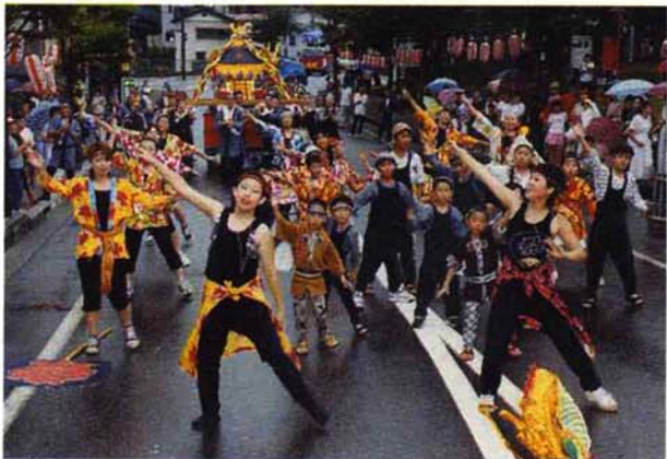
▲ 谷内2丁目…「モーニング娘。」の人気ユニット「10人祭」が歌う「ダンシング！夏祭り」（ハッスル賞）—表紙