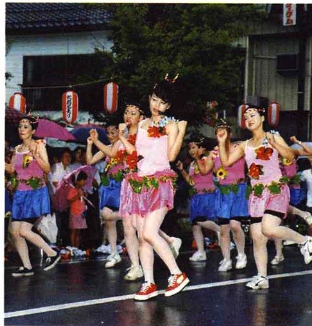
▲ 本町区…変身後の女性の「葉っぱ隊」。この後車の中から出現した男性の「葉っぱ隊」は、テレビで見る姿そのままでした（大ウケ賞）