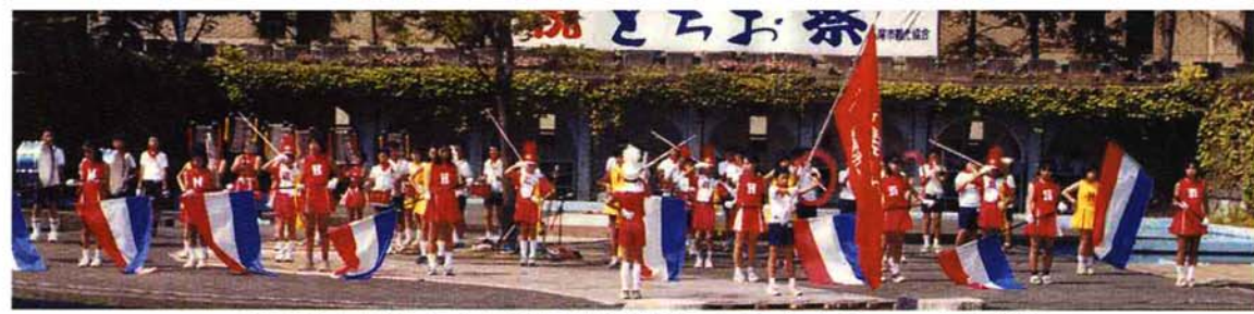
▲栃尾東小6年生61人による鼓笛隊が「こんにちはトランペット」を演奏