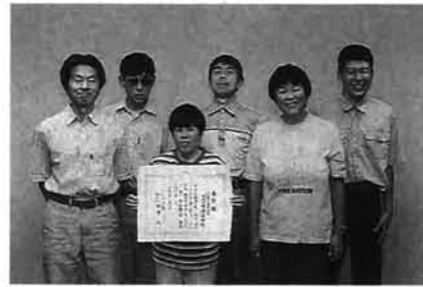
守門の里農芸班の皆さん

八月四日、上越市で開催された第44回全日本花いっぱい大会において、守門の里、浄水場の皆さんが、連盟表彰を受賞。守門の里は、平成二年から十一年間、毎年約六万本の花の苗を生産し、学校や保育園などに配布しています。また浄水場は、毎年約八百五十本の花を浄水場内の貯水池周辺に植え、施設のイメージアップと環境美化に努めています。これらの活動が評価されたものです。