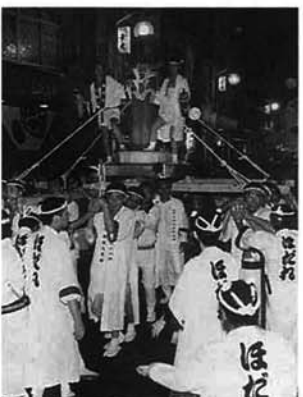
とちお祭のみこし渡御に参加

助成金は、(財)自治総合センターの一般コミュニティ助成事業の活用により、市を通じて贈られたものです。これにより、担ぎ棒や太鼓が新調されたほだれみこしは、「長岡祭り」や「中之島祭り」に参加。8月24日の「とちお祭」みこし渡御でも、元気に谷内通りを練り歩きました。