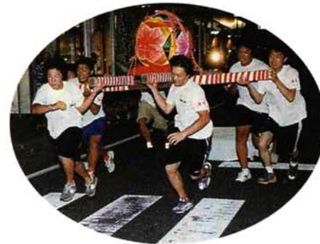
▲てまりみこしを持ち上げスタート。膝頭を赤くする選手もチラホラ