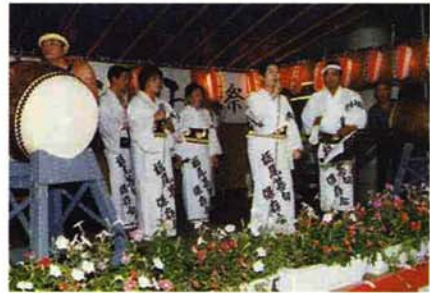
▲栃尾甚句保存会のみなさん