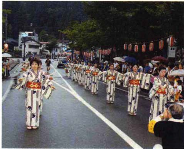
◀ 仲子町区：婦人部の踊り「守門小唄」。ほかに子どもたちがハシゴ乗りの演技を披露（チームワーク賞）