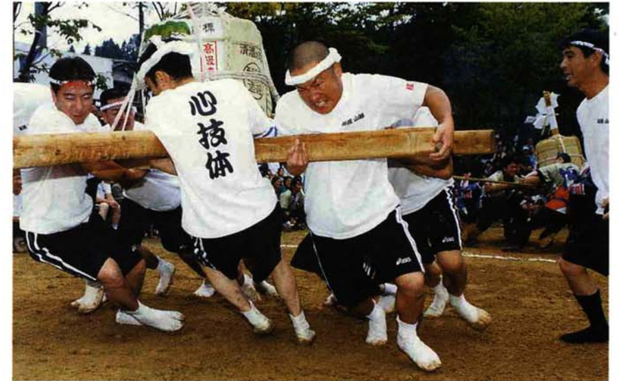
今年から、全日本選手権大会となった樽みこし綱引き大会。下田村から2チームが参加するなど、今年も数多くの熱戦が繰り広げられ観客を熱くしました

栃尾の夏のイベント「とちお祭」が、8月24日から26日の3日間、盛大に行われました。今年の祭りは、24日に前夜祭のてまりみこしタイムレースとみこし渡御。25日は午後からオープニングイベントと夜の大民踊流し。26日の仁和賀行進、樽みこし綱引き大会と続き、時折、雨が降るあいにくの天候でしたが、沿道には大勢の市民が見物に訪れ、3日間の夏祭を楽しんでいました。しかし、祭りの最後を飾る大花火大会は、雨のため延期となりました。