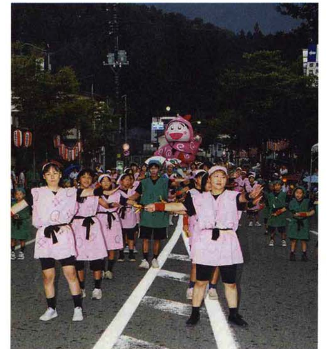
▲ 大野町区…テレビでおなじみ「にんたまらんたろう」（アイディア賞）