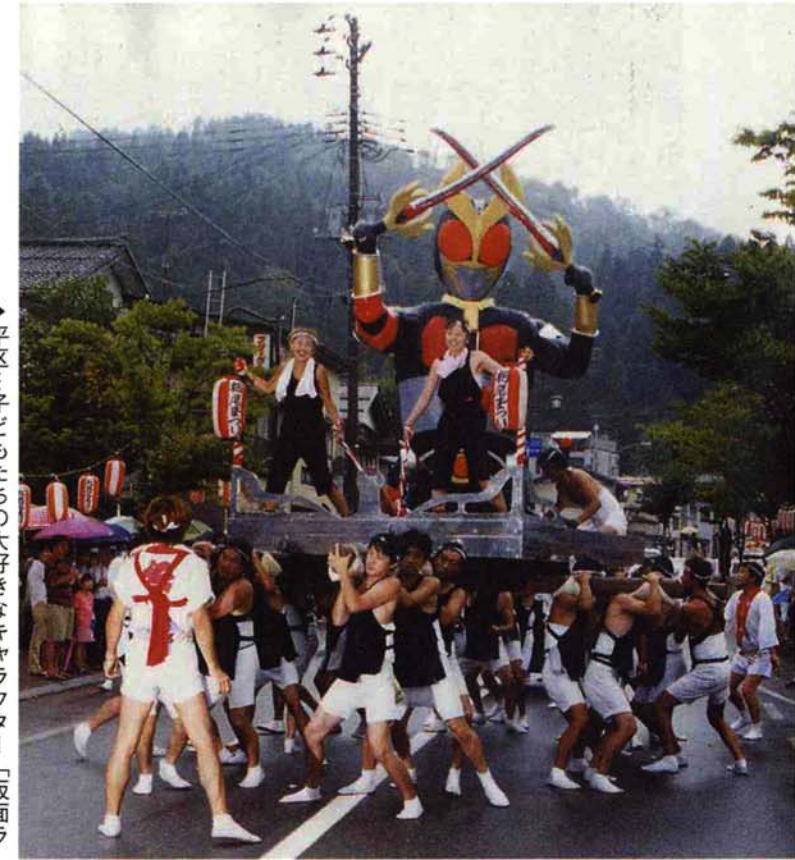
▶ 平区…子どもたちの大好きなキャラクター「仮面ライダーアギド」みこし（アイディア賞）