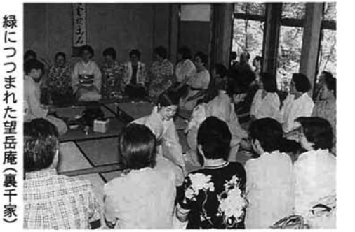
緑につつまれた望岳庵(裏千家)

樹齢数百年の木立の中から、こんこんと流れ出る冷たく澄んだ湧き水を求めて、大勢の観光客が訪れる杜々の森。今年も、この豊かな自然の中で名水茶会が開催され、市内外から三百人以上の人たちが訪れました。「アトレとど」では「宗偏流」が茶席を設け、望岳庵では「裏千家」、そして一般の人も気軽に参加できるようにと、地元西中野侯のみなさんによる茶席も設けられ、訪れた人たちを楽しませてくれました。