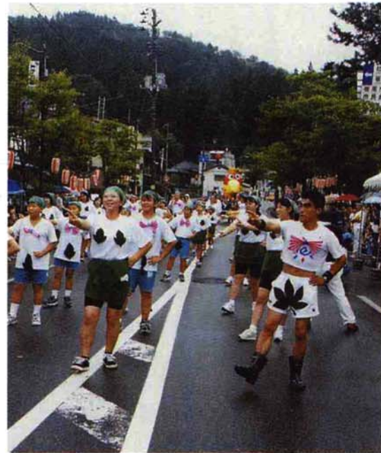
▲ 旭町区…巨大化したキョロちゃんと「オレたち、シアワセになり隊」（ユーモア賞）