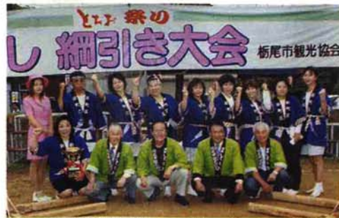
▲女子の部優勝のスマイル・パートII(新町)