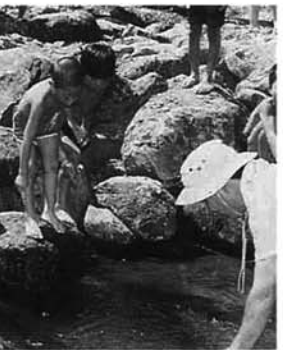
「ねえ、そこに魚がいるよ」と、子供たち大はしゃぎ

ふるさと交流広場前の刈谷田川、今年もニジマスのつかみどりが行われました。守門の里の招待者や親子連れなど二百五十人が参加。小さな子供たちは、25センチメートル程もあるニジマスをつかまえようと、びしょ濡れになりながら魚と格闘。夏の一日を楽しく過ごしていました。