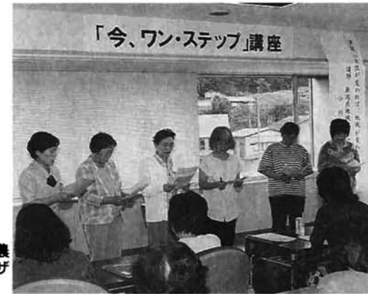
朗読劇を演じる農村生活アドバイザーの皆さん

栃尾市では、昨年度から「農業・農村男女共同参画推進事業」に取り組み、本年度は「今、ワン・ステップ(一步を踏み出そう)」講座を四回にわたって開催しました。 この事業の目的は、女性が農業経営や農村地域社会の維持・活性化に大きく貢献しているにもかかわらず、まだまだその役割や貢献に見合った適正な評価がされていない状況を見つめ直すとともに、少子・高齢化が進む中で地域の担い手として、女性の地位向上を図り、男女共同参画社会の実現を図ることにあります。 今回の講座は、なぜ今女性の社会参画が必要なのかを問い、聞き、考え、話し合ったりする中で、家や、地域、サークルやグループ活動そして社会において、「見方、考え方など意識を変えていく自分づくりを目指す」とことを目的に、三十七人の参加者を募り開催したものです。