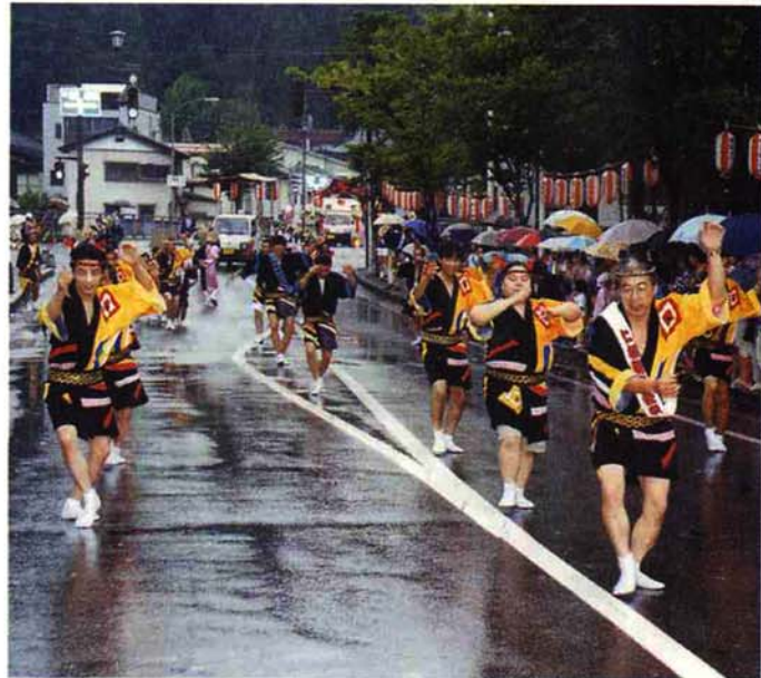
▲ 金沢区…リズムカルに「阿波踊り」（チームワーク賞）