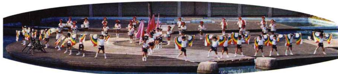
▲双葉保育園の3歳児、4歳児、5歳児の皆さんによる「可愛いベビー」ほか