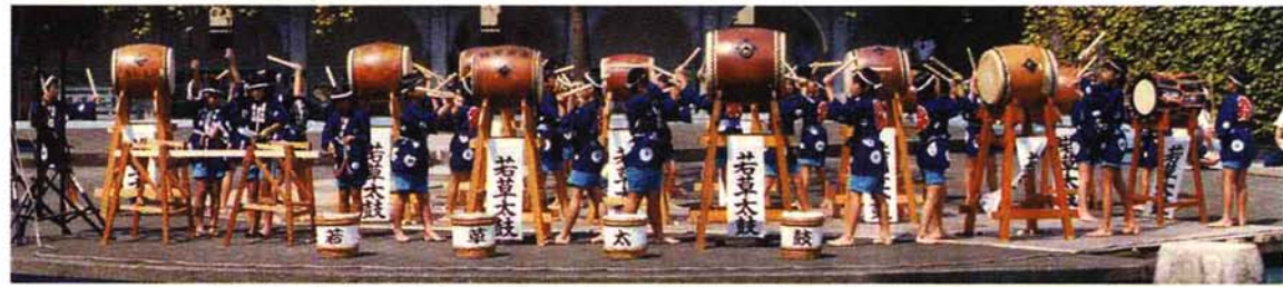
▲栃尾南小学校5年生による若草太鼓。曲は「若草第一太鼓」「子どもばやし」ほか