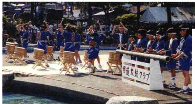
▲上塩小学校の明道太鼓クラブによる太鼓「大空」

大民踊流しは、仮装や民族衣装などを含む36団体1,840人に、一般飛び入り加わり、約2,000人が2時間を踊りきりました。