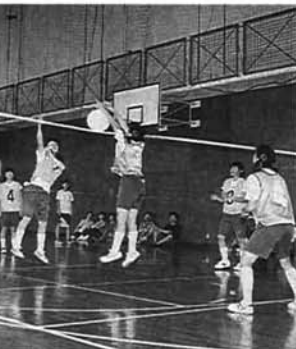
ソフトバレーボール クローバー(上の原町、滝の下町)対 新町(新町、金町)