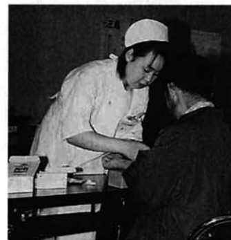
市の健診での採血

今年の基本健康診査で総コレステロール値が 200mg/dl～239mg/dl (50歳以上の女性は、220mg/dl～259mg/dl) までの人はぜひ参加してください。