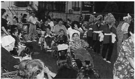
踊りの輪の中に入り、車いすで踊りを楽しむ

いずみ苑の入所者と地域の人たちなどが参加した納涼まつりが、今年もいずみ苑駐車場で行われました。まつりは地域の人やボランティアグループの人たちの協力で、盆踊りや花火などが行われ、入所者の皆さんは踊りの輪に入って踊ったり、綿アメやおでんなどを食べたりと、楽しいひとときを過ごしました。