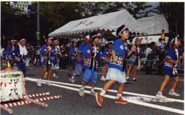
▲ 新町区…「およげ、たいやきくん パラバラ2001」にあわせて元気に踊る（ハッスル賞）