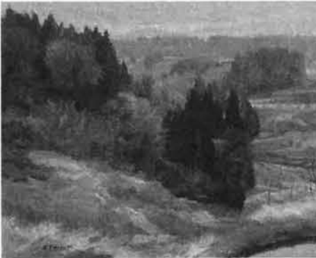
▼「山間部の春 (栃尾郷)」