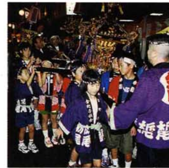
▲繁窪、新山、金町の子供みこしも元気よく参加