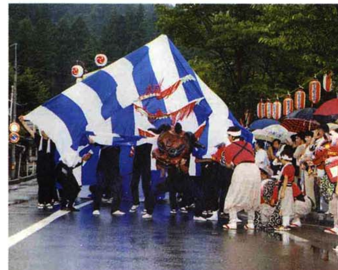
◀ 東町区…「東町神楽（あずまちょうかぐら）」が家内安全・無病息災・交通安全を願う（アイディア賞）