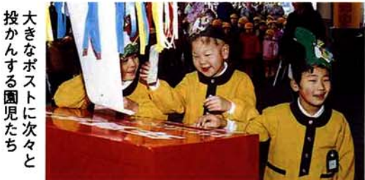
大きなポストに次々と投かんする園児たち

年賀状初差出し 園児たちが投かん 12/15 全国一斉に年賀状の受け付けが始まったこの日、栃尾郵便局前で初差出しが行われました。守門の里のみなさんによる「守門の里囃し」のあと、芳香稚草園の園児たちがくす玉を割り、年賀ポストに次々と投かん。そのあと、年長児二十一人が鼓笛「宇宙戦艦ヤマト」を演奏し、訪れた父兄や通行人から大きな拍手を受け、式典に花を添えていました。