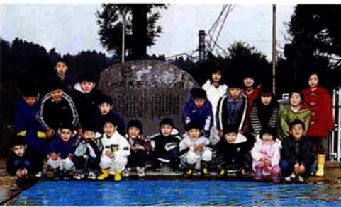
児童全員が記念碑の前で記念撮影

百二十七年の歴史を刻んだ一之貝小学校は、入東小学校、塩川小学校と同じく、統合のため来春閉校となることから、記念碑を作り除幕式を行いました。駆けつけた父兄や地域の人たち、来賓の見守る中で、全校生徒二十二人は今まで慣れ親しんだ校舎の思い出を胸に校歌を歌い、記念碑の除幕を行いました。五年生までの子どもたちは、四月からスクールバスで栃尾南小学校へ通うことになりました。