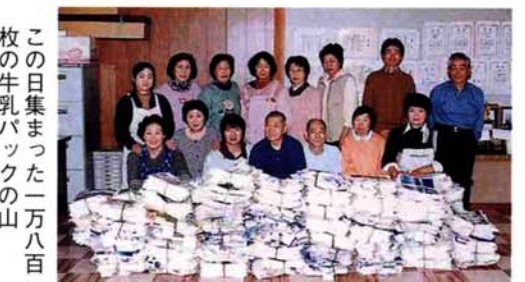
この日集まった一万八千枚の牛乳パックの山

資源保護のため、牛乳パックの回収とリサイクルのボランティア活動をしている栃尾牛乳パックの会が、今年最後の回収作業を行いました。四月からの回収量は十三万枚。収益金一万四千四百円は、社会福祉協議会を通じて三宅島近海地震の被災者に援助金として寄付されました。