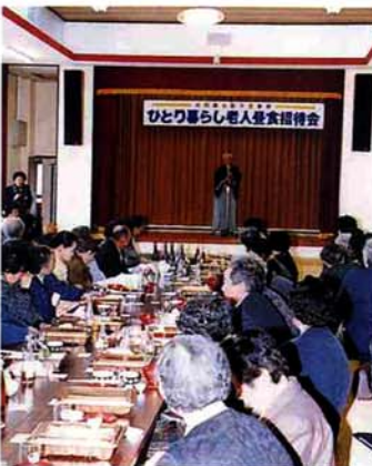
食事のあと尺八の演奏を楽しむ

社会福祉協議会は、ボランティア団体「愛のハガキグループ」の協力により、市内のひとり暮らしのお年寄りを皆楽荘に招待し、昼食会を開催しました。この日は、約百人が参加し、尺八の演奏や、ボランティアによるお楽しみ抽選会などで楽しい一日を過ごしました。