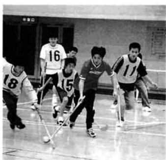
ユニホッケーの試合のようす

11月19日、総合体育館で5市町村・12チームが参加し開催。栃尾チームが上位を独占し、レベルの高さが目立ちました。