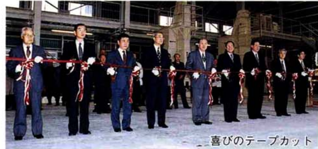
喜びのテープカット

J A 栃尾市は、将来の農業を見据え基幹作物である稲作の共同利用施設として、水稲育苗施設を建設し、完成。建設費は、約4億1500万円で、市は約3700万円の補助金で建設を支援しました。