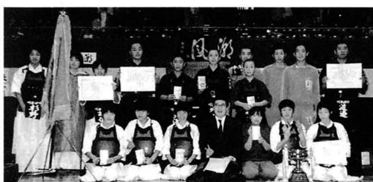
刈谷田中剣道部のみなさん