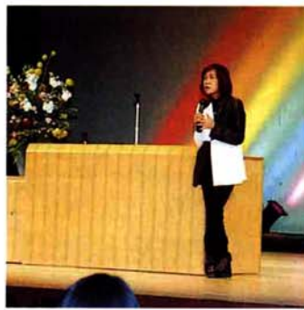
講演する香山リカさん

香山さんは「ふつうの子の生きにくさ」と題して、実際に自分が手がけた患者の実例をあげて、約一時間半にわたって講演。例は、全くふつうの子が突然家庭内暴力を振るうようになったというもの。この家庭では「母親が専業主婦で潔癖性、子供は幼い頃から親に嫌われないようにいい子を演じてきた」これを「見捨てられ不安」といい、「いい子」を演じている子供にかかるストレスは相当なもの。これがわずかなことで否定され、爆発したと分析。この例から「子育ては多少の寛容が必要。まじめな人ほど悩み、つまずくので、もっと気軽に、楽しみながら余裕を持って育児をしてほしい」と参加した三百九十人に呼びかけました。このあと参加者のうち百十五人が「しつけと遊び」「子育て環境」「思春期」など十のテーマに分かれて話し合いを行いました。各グループには同じ悩みを持った仲間が集まり、専門家を交えてさまざまな悩みや事例、意見の交換を行いました。