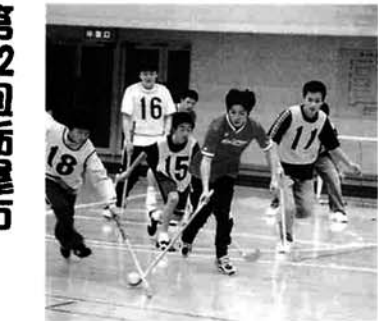
ユニホッケーの試合のようす