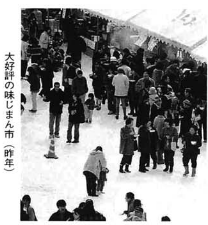
大好評の味じまん市(昨年)

市内小中学校の児童・生徒が、一年間学んだ美術学習の成果を紹介する展示会です。ぜひ、一度ご覧ください。 とき 1月30日(火)~2月25日(日) 午前9時~午後5時 ※月曜日は休館(ただし、2月12日(月)は開館して、13日(火)を休館します) ところ 美術館 観覧料 期間中は、全館無料 問合せ 美術館 ☎53-6300