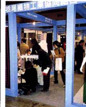
市内から16社700点余りを出展した織物協同組合のブース。多くの女性見学者が訪れた

日本で最大規模の繊維総合見本市「ジャパンクリエーション2001」が十二月六日から八日までの三日間、東京国際展示会場(東京ビッグサイト)で開催され、栃尾織物工業協同組合も出展。昨年を上回る六万人余の来場者がある中で、世界に向かって「トチオ・オリジナルファッション」の発信を行い、積極的に販売拡大と産地のPRに努めていました。