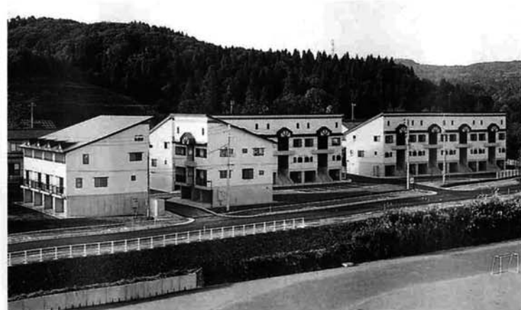
昨年秋上の原町に完成した、若者世帯向け賃貸住宅「ドリームハイツあきば」。住戸数22戸を大きく上回る応募があり、抽選で入居者を決定

この栃尾という町は、宝がまだまだ沢山隠されているように思います。ここをベッドタウンの拠点とし、現代人が求めている安らぎを多くの人に分け