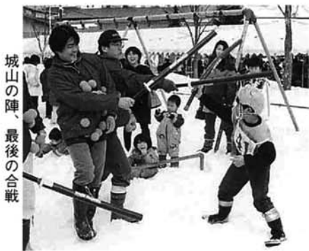
城山の陣、最後の合戦

とちお遊雪まつりは、中央公園や市営駐車場などを会場に行われ、天候にも恵まれ大勢の人でにぎわいました。今年のイベントは、城山の陣や迷路宝さがし、犬ぞり体験、味自慢市、豪雪ビデオなどの上映と、雪と楽しく遊び栃尾の美味しいものを食べるというものでいた。