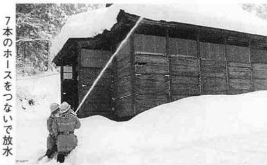
7本のホースをつないで放水

1月26日は、文化財防火デー。今年の防災訓練は、栃尾市指定文化財を保有している、表町の諏訪神社で行われました。午前10時、火災の通報とともに出動した消防署員は、素早く消火にあたりました。