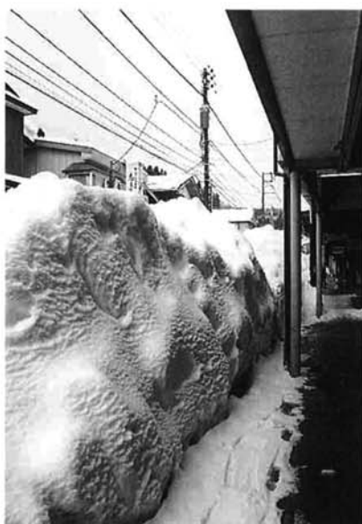
屋根からおろした雪の山。1月31日

流雪溝二月五日に復旧 一斉排雪は、二月二日の朝から表町、新町側から行われました。スノーロータリー車からダンプカーに積まれた雪は、つぎつぎと市役所前の西谷川に運ばれ、夕刻には通行可能になりました。また、故障したポンプは二月五日には修理が終わり、流雪溝も使えるようになりました。