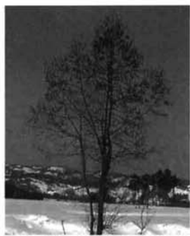
ハノノキ 菅畑 1983.3.20

これは「ハノノキ」といい、湿ったところに好んで生える木です。枝にたくさんの細長い実のようなものがついているのがわかるでしょうか。ネコのしっぽのようにも見えます。これが雄花です。茶色で、つぼみの状態です。実は、秋のうちにつぼみはできているのです。丸い実のようなものは昨年の実で、中には種が残っていました。ハン