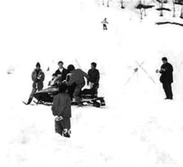
スノーモービルで雪原を走る

越後の美味しい酒と雪国の生体験を味わう地酒塾に、関東圏から二十人余りが栃尾市を訪れました。