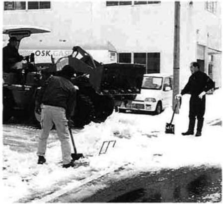
流雪溝を使った排雪作業

暖房器具の安全な取り扱い、ストープの上に洗濯物を干さない、などを心がけてください。家の冬囲いは、万一の場合を考えて、二カ所以上の非難口を作っておく工夫も必要です。