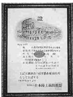
これが公認証です

雨に強いグラウンドに 刈谷田中学校のグラウンドは、雨が降ると水はけが悪く、体育祭などの学校行事や体育の授業、部活動に影響していました。そこで、昨年の夏休みから工事を行い、グラウンドにたまった水が自然に流れるようにしました。工事期間中は工事車両が校内を通るため、特に生徒の登下校には事故に注意しました。また、昨年の九月に行われた体育祭は、会場を吉水運動広場に移動して行いましたが、練習や道具の移動が大変。その他、昨年は陸上で全国大会や北信越大会に出場した生徒がいましたので、陸上の練習は秋葉中学校のグラウンドを借りて行うなど不自由をしました。