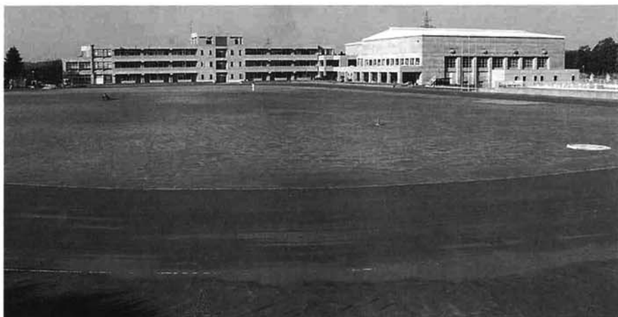
整備が終り、きれいになったグラウンド。雪解けとともに生徒たちが授業に、部活動に利用します

（財）日本陸連 第四種競技場に公認 完成したグラウンドは、走路も七コースから八コースと一回り大きくなり、フィールド内も整備され、きれいに生まれ変わりました。 教育委員会では、市内に（財）日本陸連上競技連盟公認のグラウンドがないことから、整備の終