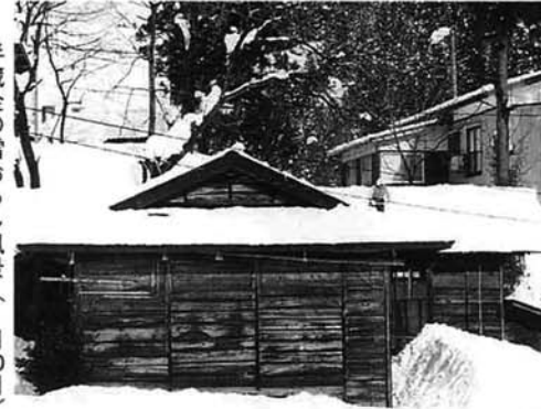
半蔵金の雪おろし風景（1月30日）

車間距離はしっかりとあける、急ブレーキ、急ハンドルは厳禁、カーブや下り坂手前ではシフトダウンする、滑りやすい日陰・橋の上では速度を落とす、わだちを走る…など冬