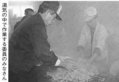
湯気の中で作業する委員のみなさん

栃尾市農業委員会委員は、2月6日から1週間、みそづくりを体験しました。これは、山内原開発畑の有効利用と農産振興を目的に、昨年度農業栽培した大豆135kgを使用したものです。