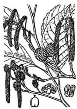
「牧野新日本植物図鑑」より

似たような花をつける植物にツノハシバミやヒメヤシヤブシがあります。花の時期は四月初ろです。 教育センター 渡辺国宏