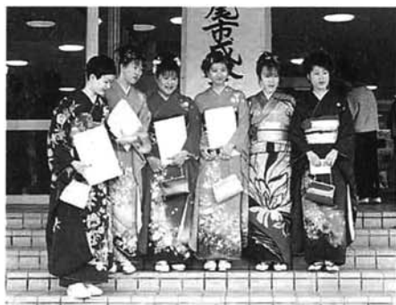
昨年行われた成人式

新しく成人となられたみなさんを祝福する「栃尾市成人式」を4月5日(日)に開催します。該当者には3月上旬に案内状を送付しました。もし、届かない場合は、社会教育課に連絡してください。 就学、就職などで市外に転出していても、実家が栃尾市にある人は、実家に案内状を送付しました。 問合せ 社会教育課 ☎52-1118