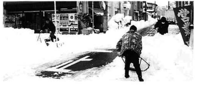
晴れ間をみて雪かきに汗を流す人たち（金町）