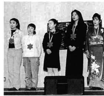
昨年のミスしだれ桜コンテスト

ミスしだれ桜募集中 栗山沢のしだれ桜まつり実行委員会は、「ミスしだれ桜」を募集しています。 対象 18歳以上の未婚の女性で、栃尾市の観光PRに1年間協力できる人 選出 ミスしだれ2名を選出 商品 参加者全員に豪華商品 応募方法 所定の申込用紙に写真を添えてご応募ください 問合せ・応募先 4月15日(水)まで