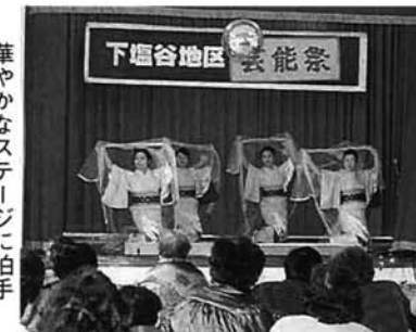
華やかなステージに拍手

分館が主催する新春恒例の芸能祭が皆楽荘で開催され、各サークルが日頃の練習成果を発表しました。プログラムは、幼児や婦人の民謡、大正琴、青年会のカラオケ、お年寄りの民謡。幼児の踊る十日町小唄に、笑いと喝采の場面も。観客も手拍子で声援をおくって、和やかな芸能祭を楽しみました。