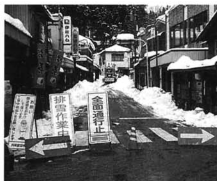
通行止めの表町。2月1日

私の営業は、土日は市場が休みだったため仕入れなどにも支障はありませんでしたが、開店休業状態のお店もありました。