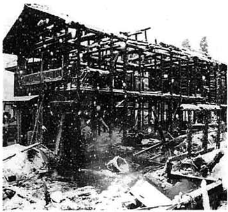
気をつけよう、冬の火災

雪の表面に亀裂ができていたり、小さな雪玉が落ちたあとがあったりする場所は、なだれの危険があります。危険な場所には近づかないよう