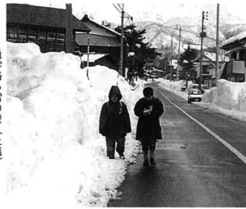
通学路も雪の壁（上塩）

市内には、なだれ危険箇所がたくさんあります（林野庁所管…五十四カ所、建設省所管…五十九カ所。重複もあります）。各地になだれ防止柵が設置され安全対策が図られました。また、毎年、市と県は道路や人家のある危険箇所に、立て看板