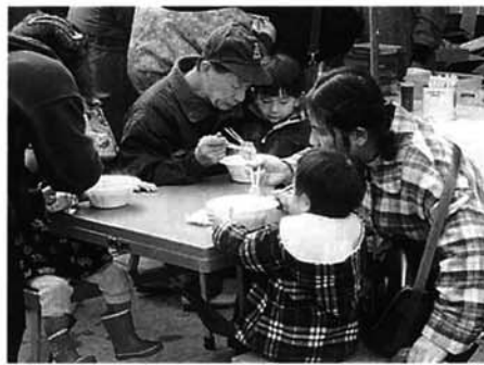
栃尾のご馳走に舌鼓をうちました

とちお遊雪まつりは、中央公園や市営駐車場などを会場に行われ、天候にも恵まれ大勢の人でにぎわいました。今年のイベントは、城山の陣や迷路宝さがし、犬ぞり体験、味自慢市、豪雪ビデオなどの上映と、雪と楽しく遊び栃尾の美味しいものを食べるというものでいた。