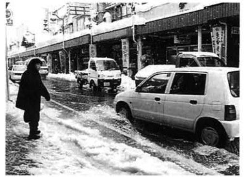
道路にあふれた流雪溝の水

この冬も、流雪溝から溢れ出た水が道路を流れ、川のようなになった町内がありました。冬の被害は、下流の人にとって大変迷惑なことです。雪は細かくして入れる、決められた時間に利用する、などのルールを守った流雪溝の利用をお願いします。また、流雪溝の転落事故は死につ