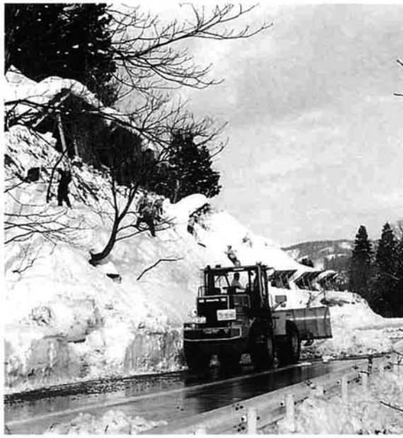
なだれ危険箇所の雪庇おとし作業（R290）

市は、高齢化が進んでも安心して生活できるようにと、平成二年度から「克雪住宅モデル事業」を実施し、工事費の補助をしています。