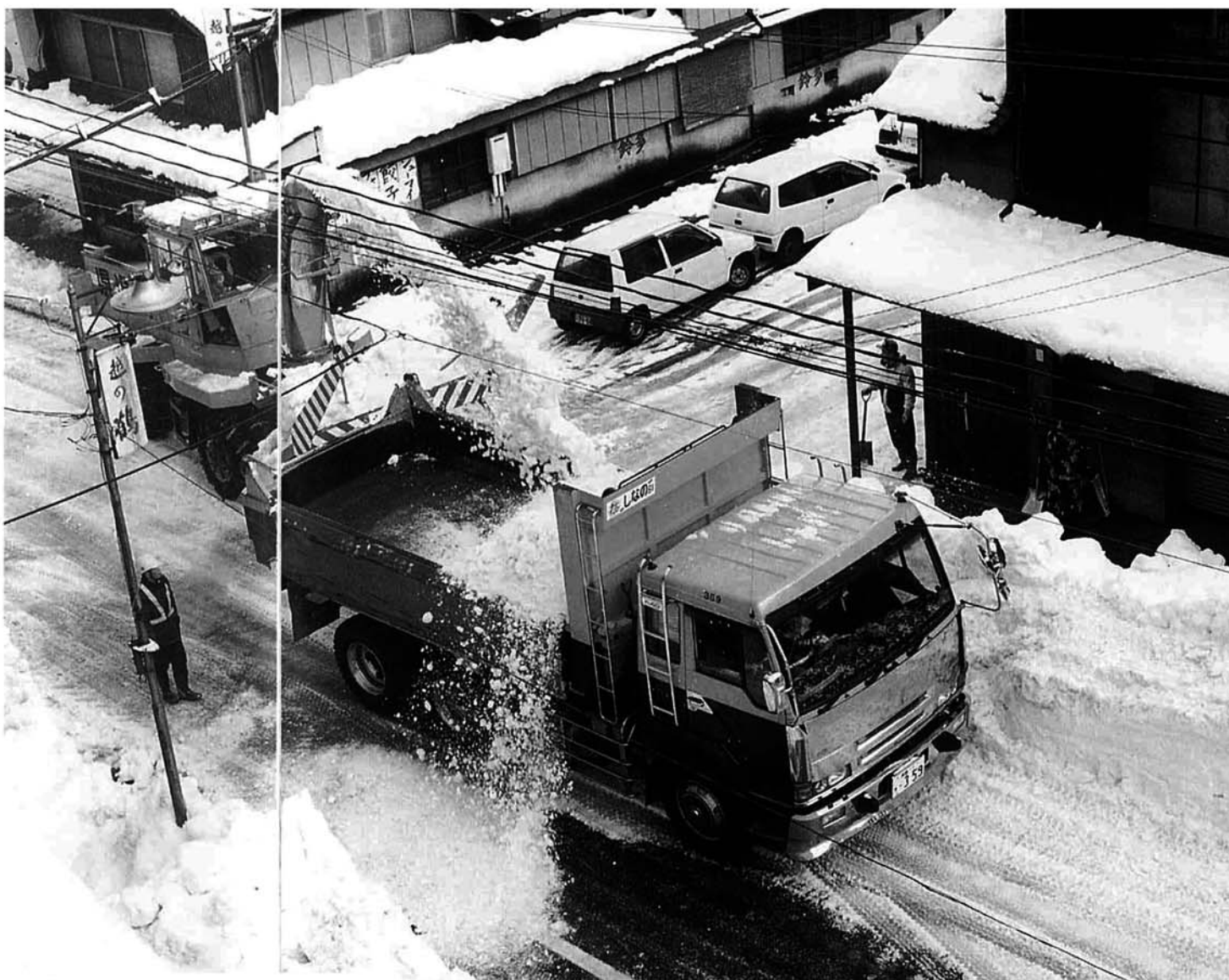
懸命な排雪作業が続く大町通り。2月2日

今回の雪は、これまでのデータからみると豪雪ではなく、平年並みといえます。栃尾市消防本部の記録によると、近年では昭和六十一年一月九日の一七cmが最高降雪、次いで平成八年二月一日の六〇cmとなっています。ただ、この数年間は降っては止み降っては止みの状態で、今年のように集中して雪が降ることはありません