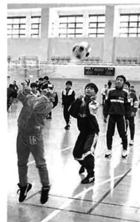
練習内容は、ボールコントロール重視の基礎練習を中心にやりました

サッカーの合同練習会が、総合体育館で行われました。講師は、プロサッカーチーム「アルビレックス新潟」の選手とコーチ。栃尾市からは、秋葉、刈谷田中学校と小学生が参加しました。