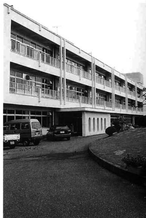
きれいになった栃尾東小学校の外壁

かなあ。」と、めんどくさがりな私は思っていました。 しかし、改築工事が終わった校舎を見てびっくり！ ところどころ汚れていたかべは、きれいなうす黄緑色で、汚れ一つ無くピカピカになり、サビでいて今にも折れそうだったペランダの手すりも、サビなんかどこにもない、いかにもじょうぶそうでした。 りっぱな手すりに大変身していたのでした。はじめ、めんどくさく思っていた改築工事も、ほんの少しがまんするだけで、校舎がこんなにきれいに大変身するとわかる。「なんであの時、ちよつとくらのことに、いちいちもんくをつけたのかなあ。」なんて、思ってしまうのでした。 学校は、外見がどれだけきれいでも、内、つまり、生徒の心がきれいでも、はならないと思います。そのためにも、学校がきれいになったついでに、心も少しいかえて、学校がよこれないように心がけたり、みんなにやさしくできるようにしていきたいです。