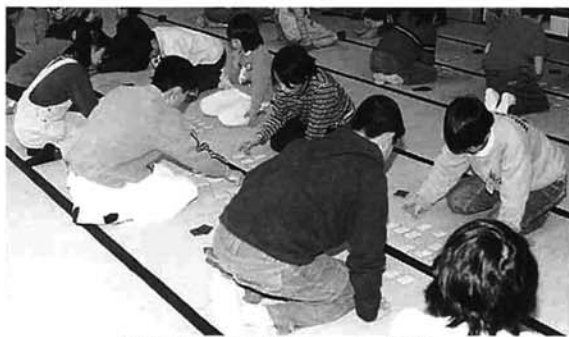
花の色は移りにけりないたずらに～