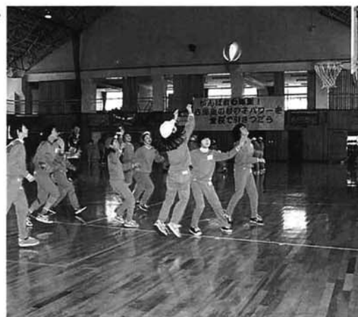
きれいになった体育館で元気にっばい動きまわる子どもたち

二十一年が経過 栃尾東小学校は、昭和五十二年に栃尾小学校から分離してできました。校舎はこの年に完成しましたので、二十一年が経過しようとしています。 この間、風雨や雪に耐えてきた校舎や体育館は、何年か前