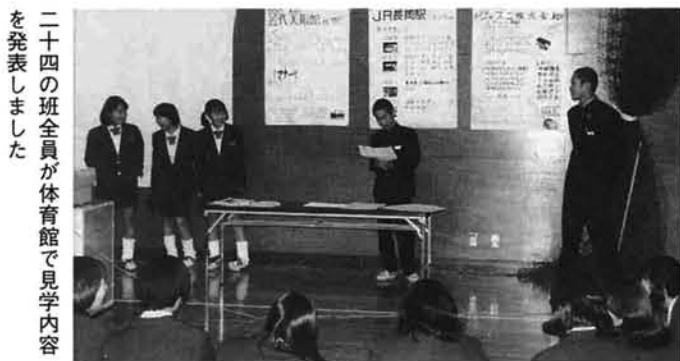
二十四の班全員が体育館で見学内容を発表しました

2年生は長岡市内の専門学校、高等学校、技科大などの学ぶ施設(午前)とJ.R長岡、県立近代美術館(午後)など二十八か所を訪問しました。実際に職場の仕事を経験する