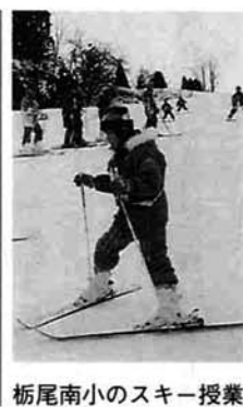
栃尾南小のスキー授業

「よったかり」の場づくり・人づくりをキーワードに、栃尾市地域住宅計画(HOPE計画)推進の母体、「栃尾市まちづくり推進協議会」の研究・活動が始まりました。 その部会の一つである「月の相談室」が住宅相談を行います。この相談室では、建築士会の会員が耐震・耐雪・税金・資金・リフォーム