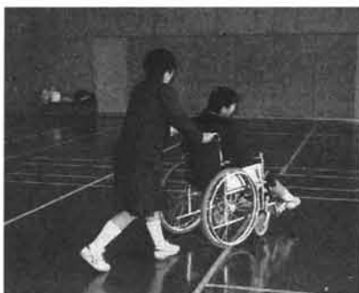
看護関係の専門学校で実際に車椅子を押す生徒