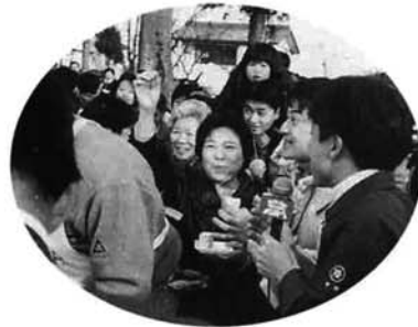
巨大油揚げに入った金のインゴットを見つけ大喜び

元旦スペシャル チャレンジ夢パワー1997 めざせ日本のナンバー1 日本一の巨大油揚げ生中継 一月一日 秋葉公園 元旦のテレビ番組「チャレンジ夢パワー1997 めざせ日本のナンバー1」(テレビ朝日系列NT21で放送)で栃尾の巨大油揚げ作りが生中継されました。 この番組は、同系列全国24局を中継で結ぶ五時間の生放送、チャレンジ部門に「日本一の巨大油揚げ」として実演。午前七時二〇分にクレーンを使って生地を大なべに入れるところ、八