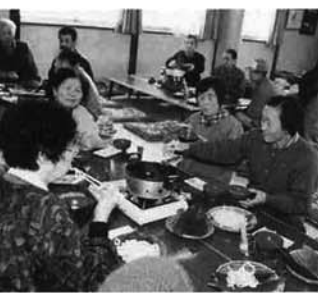
「おいしい」と好評でした

一月十六日は栃尾市の家庭の日。下塩区有志の人たちが、この日を子どもたちを交えて有意義に過ごしてもらおうと「手打ちそば・うどんを食べる会」を開催しました。 二回目の今年は、一一〇食用意したそば・うどんの出来ばえも上々。集落内の親子づれやお年寄りなどのほか、評判を聞いた近在の人たちも訪れ、おいしそうに食べていました。