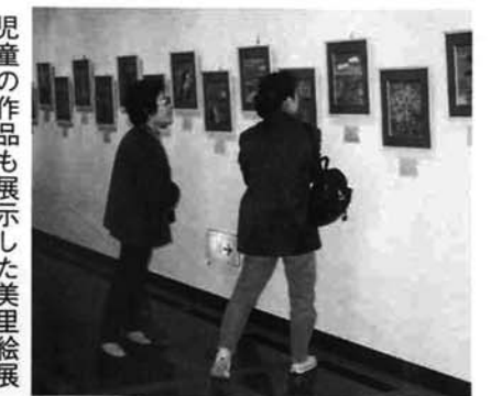
児童の作品も展示した美里絵展

今回の美里絵展をご覧になった、市外の数人の方からお電話やお手紙をいただきました。おかげで、新しい人とのつながりができました。将来、出品した子どもたちの中から美術館に展示されるような人が育ったらいいですね。