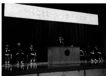
学級で全員発表会を行い、その代表が学年発表会でしっかり自分の考えを述べました

1年生は数人の班に分かれて、栃尾市内の商店、企業、病院、市役所、消防署など二十八か所を訪問し、働く人々の仕事に取り組み姿勢を学んできました。