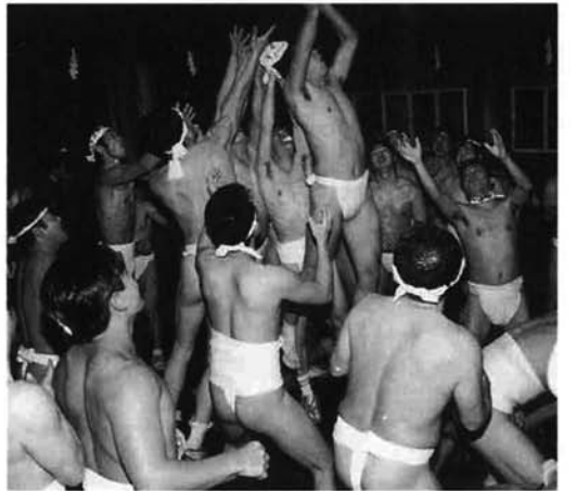
寒さを吹き飛ばす押し合い

「サンヨ、サンヨ」の勇ましい掛け声とともに、禰姿の男たちが押し合い、福札を奪い合う栃堀巢守神社の「裸押し合大祭」。 雪のない小正月とはいっても、寒の真っ最中。寒さを吹き飛ばすように、大ロークを両手で抱えた若者を先頭に男たちは神社の石段を駆け上がり、狭いお堂の中は一気に熱気に包まれました。 神社の境内には観客の列ができ、順に神殿に入ってお参りをした後、押し合いを見物。御神酒や甘酒のサービスもあり、焚き火の回りではスルメを焼いたり、御神籤を引いたりして祭りの一夜を楽しんでいました。