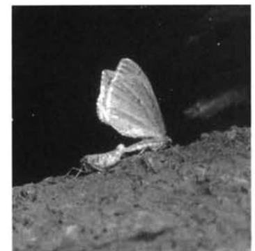
写真はウスバフユシヤク

フユシヤクが栃尾市内で見つかったという報告は、まだありません。（小千谷市ではあります。）フユシヤクはシヤクガの仲間です。日本では約二十種類が確認されています。晩秋から冬にかけて活動するガです。フユシヤクは、羽根の色も地