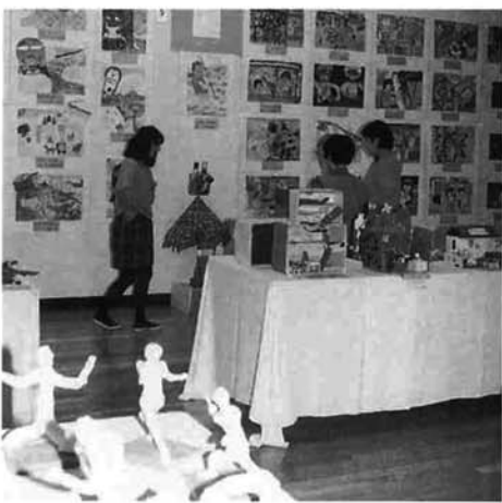
23日まで「とちおのこども作品展」を開催