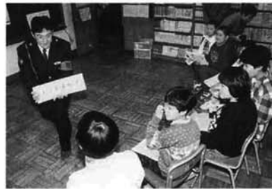
本番さながらの模擬逮捕に続き「110番クイズ」で学ぶ子どもたち

一月十日は一一〇番の日。栃尾警察署吹谷駐在所員ら三人が栗山沢小学校を訪れ、警察の仕事や同小学校前で「引き逃げ事件発生」の想定で一一〇番の仕方などを説明。「事件、事故を見たらすぐに一一〇番」とPRしました。