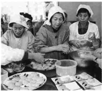
大野原、天平、沖布の人たちが協力しておいしい栗もちを作りました。

夢しお21(上塩地区のむらグループ)では、地域の特産品にと「栗もち」を試作しました。栗ともち米を「塩の宮」の塩水にひたしてからついたもち米は、栗の薄黄色、香ばしさとほんのりとした塩味が好評。「夢しおまんじゅう」の塩の宮の塩水で茹でた卵につづき、製品化へ向けて取り組んでいます。