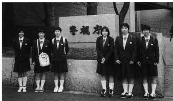
これから訪問する警視庁前「緊張の瞬間」(3年生)

24時間仕事を休まず続けられるのがすごいと思ふ。将来は山崎パンにパンを作るのを見たい。パンをおみやげに沢山もらった。女席した。山崎パンはすごい。パンは作っているから、自分の作業を自分でしたい。