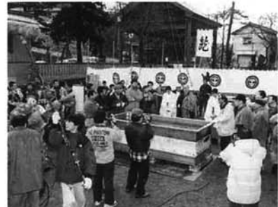
大なべに生地が入れられ完成を待ちます

時四十六分の油揚げ完成の二回が放送されました。 獅子舞やお囃子で賑やかな秋葉公園には、延べ一〇〇〇人が集まり、振る舞われた地酒や揚げたての油揚げなどに舌鼓をうち、正月を楽しんでいました。