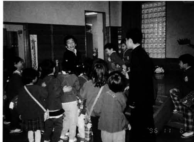
1年生の職場訪問：保育園で園児と和やかに遊ぶ生徒

刈谷田中学校では、「生徒が自分の個性や将来の生活について理解を深め、自分を生かしながらどのように生きていくのかを考える」という力を育てる教育方法の研究を進めています。それらの実践がどのようになされているのか、その一部を紹介します。