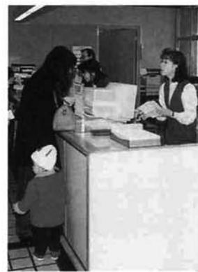
4月から、25の事務が身近な市役所で処理されます。

栃尾市に移譲される二十五の事務は、別表のとおりで、福祉事務所・環境衛生課など六課が担当することになります。今後、県と事務引継ぎを行います。四月からはそれぞれの担当課で事務を行います。いま担当する各課では、必要な規則等の改正を行ったり、事務マニュアルで勉強しているところなどです。この二十五事務が県から移譲されることにより、事務量は多くなりますが、これに伴う職員