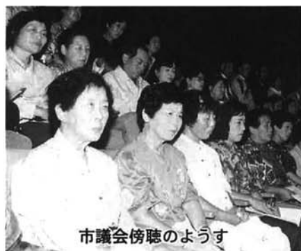
市議会傍聴の様子

一般会計、国民健康保険事業特別会計、下水道事業特別会計、水道事業会計、ガス事業会計 平成七年度会計補正予算について