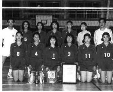
若さがみなぎる栃尾クラブ

「平均年齢二十一歳と大変若いチーム。真剣にバレーボールをしたい人ばかりなので、練習に熱が入り指導のやりがいがある。県大会では、練習以上のものを出すことができた。チームワークの勝利。勝負は時の運。全国大会では精一杯頑張ります。」