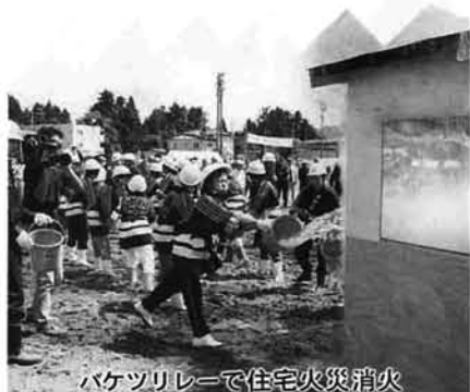
バケツリレーで住宅火災消火