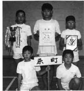
団体優勝の原町チーム