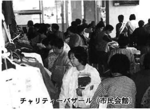
チャリティーバザール (市民会館)

家庭には、使わないうで眠っている品物がけっこうあるものです。まだ充分に利用できるものがたくさんあって、もったいないですね。 今月はそれらの品物を集め、チャリティーバザールを開催し、売り上げ金を福祉活動に寄付するなどの活動をしているグループを紹介しします。