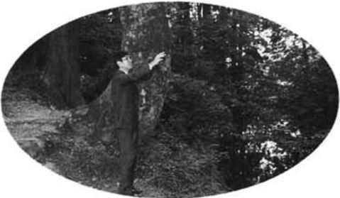
杜々の森の自然を楽しむ