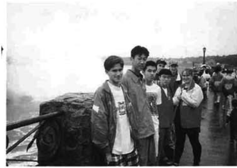
カナダの友人らとナイアガラの滝の前で

8/7 午前中バスで午後からファミリーデイ、夜はゴルフ場でパーティー。パーティーの前にみんなでゴルフをしました。初めてで、むずかしかつたけど大変おもしろいスポーツですね。広大な土地で誰でも気軽にゴルフが楽しめることは、日本では考えられないことです。