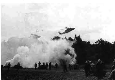
ヘリコプターで消火（比礼）