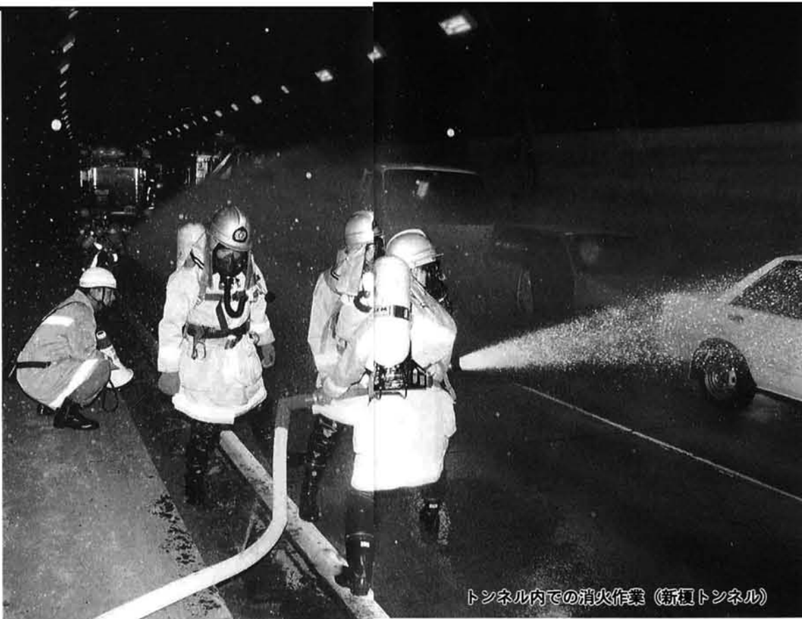
トンネル内での消火作業（新穂トンネル）

「九月一日午前八時二十分、県中部でM7.5のかなり強い地震が発生し、長岡市で震度5、震源地に近い栃尾市では震度6の烈震を記録。このため、市内各所に大きな被害が出ている。」という想定のもとに平成七年度新潟県・栃尾市合同総合防災訓練を、秋葉中学校ほか四会場、七十二機関約四九〇〇人の参加で実施しました。 この訓練は、阪神・淡路大震災の教訓を生かし、震災への対応を重要視しています。また、山林面積が多い栃尾市の特色を考慮し、林野火災およびトンネル内自動車事故の訓練を行い、小・中学校でも児童・生徒、地域住民の避難訓練を実施するなど、住民のみならずからも多数参加していただきました。