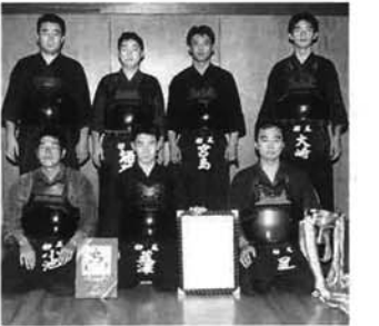
熱心な稽古を続ける栃尾市剣道連盟チーム

県大会予選リーグを二位で決勝トーナメントに進出。強敵三島郡チームを三勝二敗で取り、決勝戦へ。決勝の相手の白根チームを二