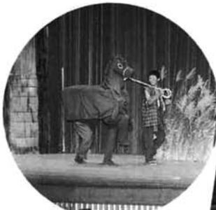
「ばくろうときつね」キツネが化けた馬を引く

栃尾の民話を題材にして演劇活動をしている劇団「猫」では、夏休みを利用して子ども演劇体験教室を行いました。小学六年生から中学三年生まで十一人の子供たちが参加し、七月から毎週水・土曜日に一生懸命練習しました。 演目は、お馴染みの「三枚のお札」「ばくろうときつね」。初めて手にする台本片手に、緊張気味な初舞台。衣装合わせでやんちゃなところを見せる子供