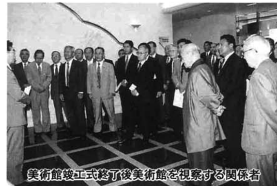
美術館竣工式終了後美術館を視察する関係者

『ふるさと美術館』という構想のもとに建設を進めてきました『栃尾市美術館』が完成。去る9月22日に竣工式を行いました。現在、11月24日のオープンに向けて準備を進めています。開館時の展覧会は「郷土ゆかりの作家秀作展」を開催します。今回は、展示を予定している7名の作家の略歴をご紹介します。