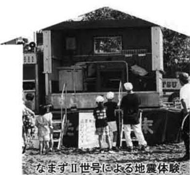
なまずII世号による地震体験

阪神・淡路大震災では、いたるところで同時に火災が発生しました。これを教訓に、各所に