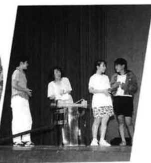
舞台けいこに熱が入ります

発表会では練習の成果があつてか、すっかり役者気分が板につき、名演技で場内いっばいの観衆を沸かせていました。