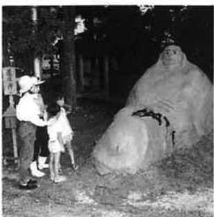
安産と子供の成長を祈願

上樫出では音子神社のお祭りを裏山に行っています。百三十年前から続いているもので、安産と子供の成長を祈願。区民九十人が集まり、長さ四尺、高さ二尺の地藏様を土で作りました。