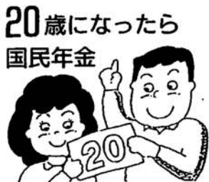
20歳になったら国民年金

A1 二十歳以上六十歳未満の日本国内に住所のある人は、すべて国民年金に加入することになっています。それは、国民年金がすべての国民に共通の「基礎年金」を給付することを目的とし、その費用を、国民年金の被保険者が公平に負担しようという制度だからです。