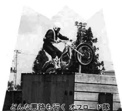
どんな悪路も行く オフロード隊