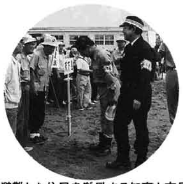
避難した住民を激励する知事と市長