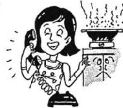
天ぷら油火災 今年すでに3件発生

◆その場を離れるときは必ず火を消してから(火を小さくしてコンロを離れる人が多いが食用油は350度程度で自然発火します)。