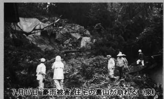
7月17日 豪雨被害 住宅の裏山が崩れる(泉)

昭和56年に発生した「6・26水害」では、梅雨前線による豪雨で大野町、半蔵金地区に大規模な地滑りが発生し、家屋の全壊7棟、被害総額32億6千万円という被害がありました。最近では、今年の7月17日の集中豪雨が、農作物や道路などに8億3千万円余りの被害を与えています。