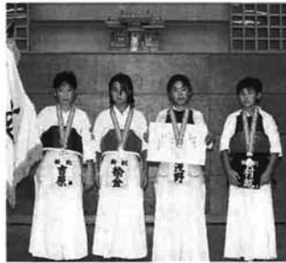
優勝した栃尾市剣道連盟チーム

8/27 新潟市体育館 第二十回新潟県少年少女剣道大会で、栃尾市剣道連盟チームは小