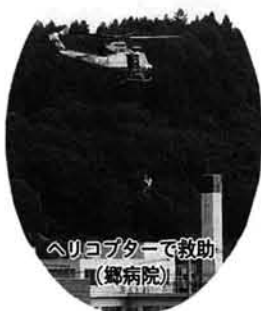
ヘリコプターで救助 (郷病院)

「三階湯沸かし室付近が炎と煙に包まれています。」看護婦の発見により直ちに一一九番通報がなされ、同時に院内放送により避難を開始。職員や看護婦が患者を担架で避難させたり、自衛消防隊が必死の消火活動を行いました。屋上に取り残されている人々を梯子車で救出し、逃げ遅れた患者を県警機動隊航空レンジャー部隊がヘリコプターで救助しました。