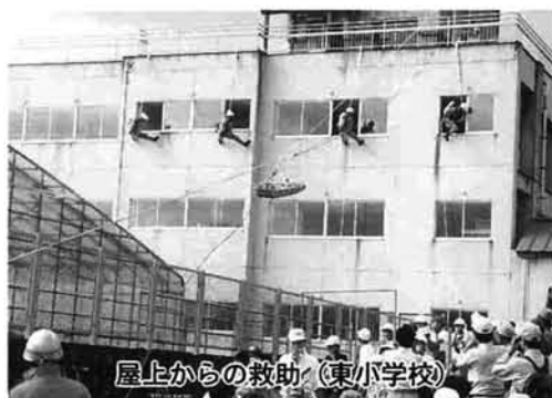
屋上からの救助（東小学校）

逃げ遅れた被災者を屋上に発見。航空自衛隊新潟救難隊のヘリコプターで無事救出しました。「地震により付近の町内で火災が発生し、多くの倒壊家屋がありました。」このため、約一千世帯が危険な状態になったので、住民が東小学校グラウンドに避難。多数の被災住民に救援物資の供給が必要。道路が寸断しているのでヘリコプターを使って空