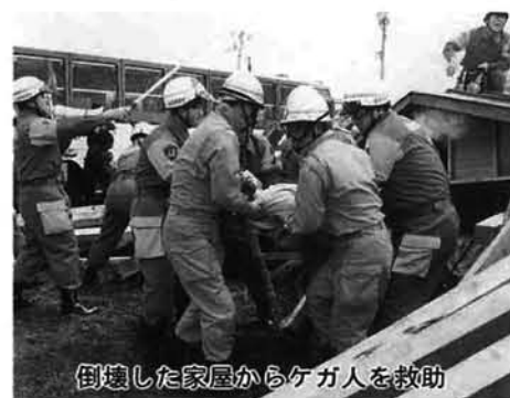
倒壊した家屋からケガ人を救助