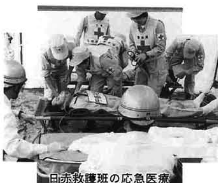
日赤救護班の応急医療