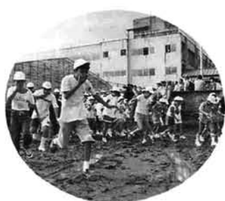
煙を吸わないように避難 (東小学校)