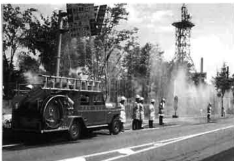
防火水幕で延焼を防ぐ（中央公園）

で消火活動を開始。なお延焼中なので県消防防災航空隊ヘリコプター「はくちょう」が、空から消火バケットでドラム缶5本分の水を一度に放水しました。「トンネル内では、地震のため運転を誤り側壁に衝突し、その後統車数台が衝突、車内に数人が閉じ込められました。」長岡市、栃尾市の各消防本部から一斉に出動し、救助工作車などを使用して救助活動にあたりました。