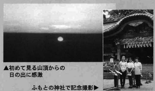
▲初めて見る山頂からの日の出に感激