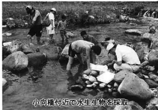
小向橋付近で水生生物を採取

「カナダは国土がとても広大で、素晴らしい大自然、そして多くの資源に恵まれています。」とは社会科で習うことですが、実際に行ってみるとそのスケールの大きさに感動します。 広い敷地に大きな家。ほとんどの家庭に全館冷暖房システムが完備されていて、その普及には国が援助をしているそうです。一番不安だった英会話は、相手が分りやすく話してくれたせいもあって、なんとか通じました。時折辞書を使いましたが、自分の英語力がここで発揮でき、少しうれしくなりました。国際交流には、英語が大切ですね。最後に、このようにバスケットを通じて国際交流出来たことを、とてもうれしく思っています。そして、この遠征の計画、援助していただいた人達に大変感謝しています。 ありがとうございました。