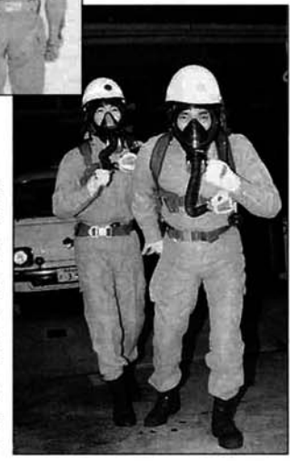
▶状況によっては、送風機によって空気を送り込み、呼吸器を着用しての救助に。 ▲救助隊員は、この救助用ヘルメットを着用し、ロープで降下して救助に向かう。