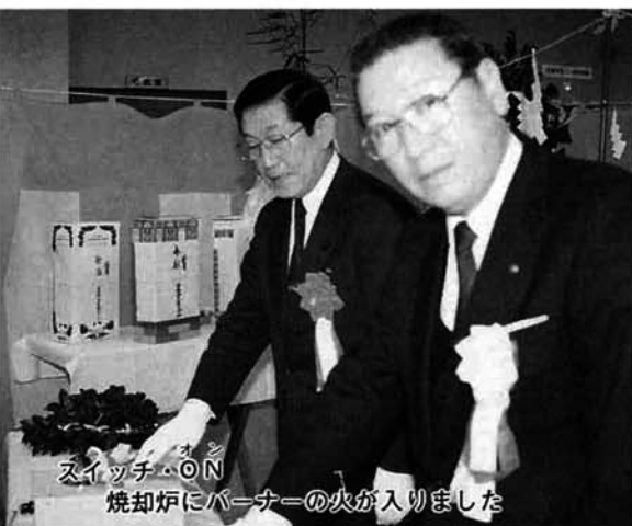
スイッチON 焼却炉にパーナーの火が入りました