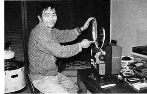
大会を記録した8ミリ映画。「機会があったら上映したいですね」と斎藤さん。

またまた若い者には負けない現役の選手です 私が初めて守門スキー大会に出たのは、30年の第7回大会と記憶しています。栃尾山岳会5人のメンバーで、山頂から栃尾小学校まで滑り降りしました。単板のスキーで、ラビットのワックス。スタイルの金具でした。 その後大会には情熱を傾けてきました。思いに残るのは、第12回大会に優勝するため道院で10日