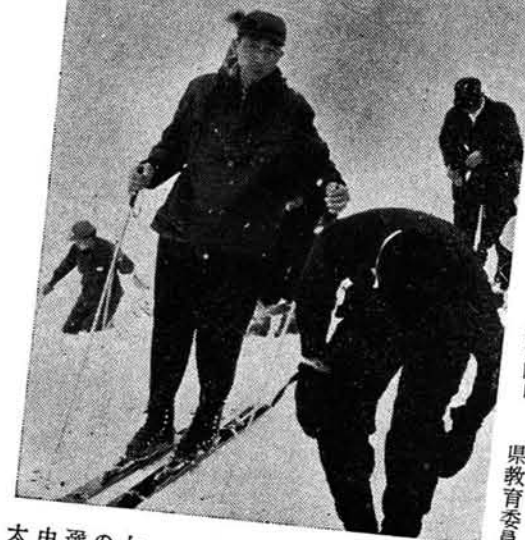
日の丸の旗の中を