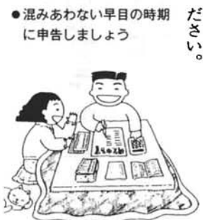
●混みあわない早目の時期に申告しましょう