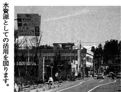
水資源としての活用を図ります。