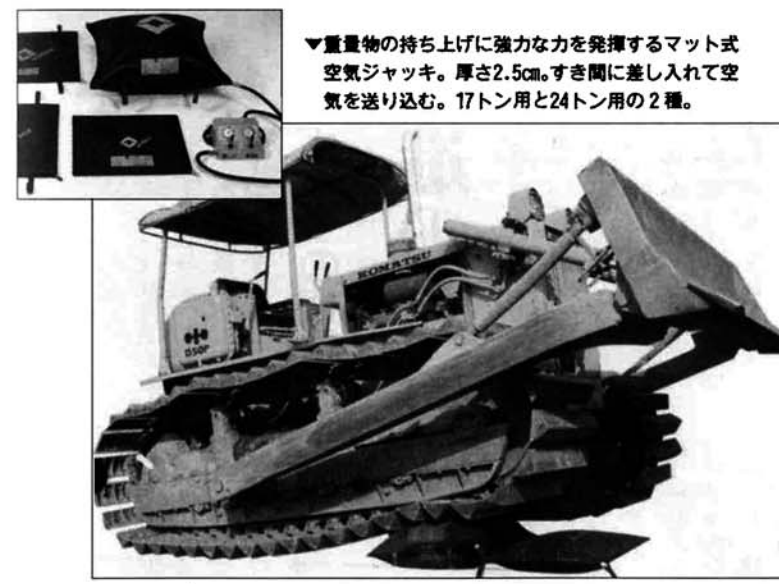
▼重量物の持ち上げに強力な力を発揮するマット式空気ジャッキ。厚さ2.5cm。すき間に差し入れて空気を送り込む。17トン用と24トン用の2種。

建設現場でのブルドーザーや、農業用トラクターの運転を誤ってその下敷きになった。石塚が倒れ通行人がその下。山崩れで大木や大石の下に人が閉じ込められた。こんなとき一刻も早く救出し、病院に運ぶことが必要です。すぐ、救助工作車を呼んでください。マット式空気ジャッキを利用すればブルドーザーも持ち上げます。また、強力クレーンも装備しています。