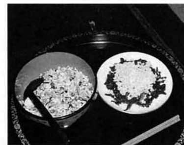
栄養がたっぷりの五目炒り豆腐(左)とホーレン草のホロホロ卵かけ

一日に三十種類以上の食品を取ることが必要だなんてよくいわれます。我が家ではいろんな野菜を取り入れた料理を心掛けています。そして、私たち夫婦の健康の秘訣が日曜菜園。小貴に畑があって、日曜日のたびにでかけています。