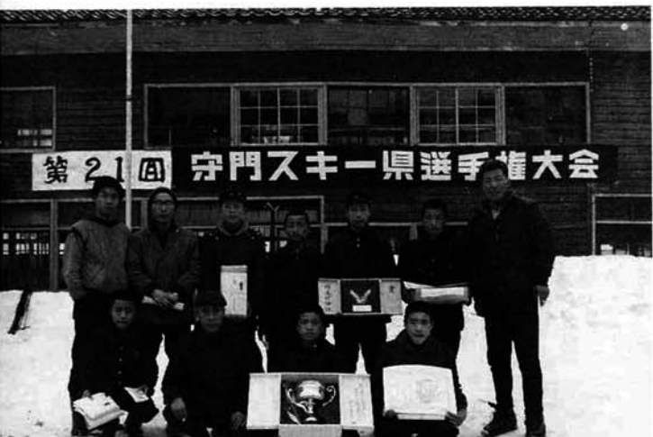
第21回 守門スキー県選手権大会