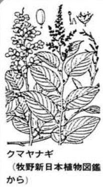
クマヤナギ (牧野新日本植物図鑑から)

降雪が多くなると、雪下ろしや道路みに、かんじきが活躍するようになります。近頃では、もっぱら市販のものを使いますが、昔は大半が手作りであったと聞きます。竹や杉などの材料を囲炉裏の火や湯で熱して曲げ、「こすり縄」を組んで仕上げたものだそうです。