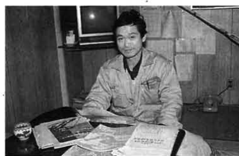
これまで出場した大会の記録集を前に語る権さん。大会の様子を伝える貴重な資料です。

○ 成年組3部：46歳以上 団体構成 各組とも三人以上四人以内で一チームとし、上位三人の合計タイムで順位決定。 滑降距離レース 一週一・五計を、青年組・成年組1部は四週、これ以外の組は二週する競技。 滑降レース 青年組・成年組1部は、峠頂上から新屋敷までの二・三計、その他の組は峠の下から新屋敷までの一・九計 参加料 千円(中学生は五百円) 参加申込・問い合わせ 2月28日までに市総合体育館内のスキー大会事務局(☎52局五五七二) おおぜいの皆様の 応援をお願いします ○ 50回記念功労者表彰式と開会式(午前8時30分) 栃尾区事務所 ○ 距離スタート 午前10時 ○ 滑降スタート 午後0時