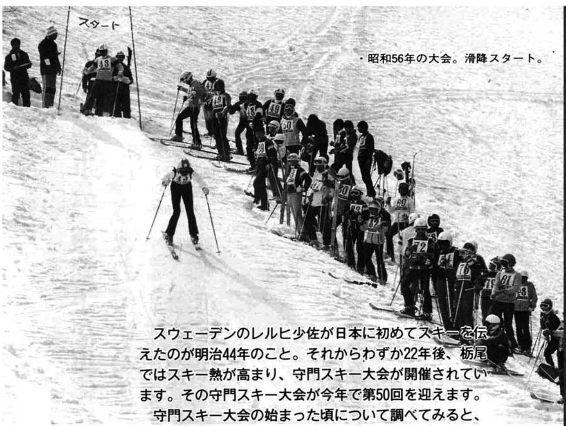
・昭和56年の大会。滑降スタート。

スウェーデンのレルヒ少佐が日本に初めてスキーを伝えたのが明治44年のこと。それからわずか22年後、栃尾ではスキー熱が高まり、守門スキー大会が開催されています。その守門スキー大会が今年で第50回を迎えます。守門スキー大会の始まった頃について調べてみると、スキーの振興に努力した人、道院ヒュッテの整備に努力した人など何人もの姿があります。そこで今回は、守門スキー大会に関わった皆さんの声を紹介してみます。