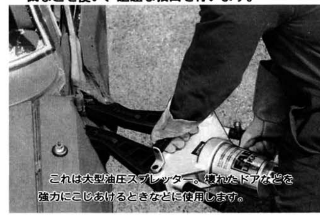
これは大型油圧スプレッター。壊れたドアなどを強力にこじあけるときなどに使用します。

増加する交通事故。つぶれた車体に挟まれ、負傷した人を引き出せない事故が発生しています。また工場内部で機械に従業員が巻き込まれる事故も起きています。こうした場合、早急に周囲の金属部分を切断して負傷者を収容し、病院に急送する必要があります。救助工作車には、状況に応じて使い分けする各種の用具を積んでいます。例えば、大型油圧切断機、エンジンカッター、チェーンソー、ガス溶断機などを使い、迅速な救出を行います。