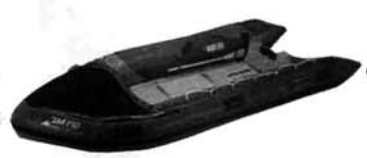
●救助に使用する救命ロープ発射銃(右)と救助ボート(中)、そして救命胴衣(左)