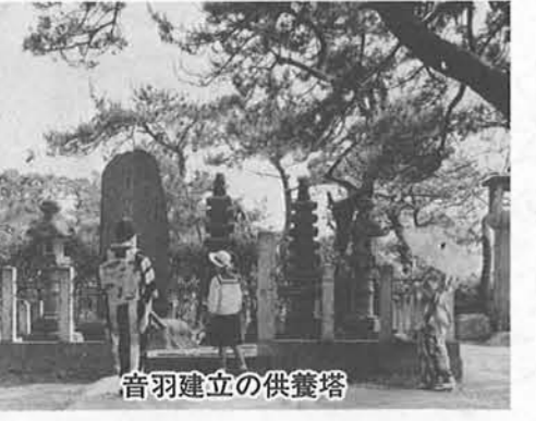
音羽建立の供養塔

いつの世でも戦いは尊い人命を奪い、生活を根こそぎ破壊する。そして幸福を踏みじられた女は陰で泣き、犠牲を強いられる。 鎌倉初期、源平合戦で二人の子を失った母親は悲嘆の果てに出家し、承久の乱に敗れた順徳上皇の佐渡配流に供奉した女房たちの忍従は、女人史の一齣である。 建久元年（一一九二）、奥州丸山城主佐藤庄司の妻音羽が、源義経に従い、西国で平家追討の戦いに加わっているわが子嗣信・忠信の消息を案じて寺泊まで来た。このとき宿を同じくした一人の山伏から、平家の滅亡、兄弟戦死の悲報を聞き、丸山の城で耳にした不吉な風の便りが、もはや否定できない事実であると知って、その場に泣きくずれた。そして近くの円福寺で出家して菩提を弔ったという。 『円福寺略縁起』には「はらからの方方はるかに尋ね来しかいもなぎさの泡と消えしか」と詠じつつ玉栄妙照と法名し、持てる宝鏡・念珠・懐剣をこの寺に納め、兄弟のために二基の石塔を建てて供養し、尼は陸奥に帰りしとむ」と 悲しい物語を今に伝えている。承久三年（一一三三）秋、順徳上皇は北条義時によって佐渡遠流となった。上皇は寺泊から佐渡へ渡られるが、供奉を命じられた八名のうち、冷泉中将為氏はお見送りもせず都に留まり、花山院少将能氏は病と称して途中から都に帰り、左衛門佐範経は重病のため寺泊に留まり、結局乗船したのは左衛門大夫康光と三人（二人説あり）の女房だけであったという。 女房とは、現在は妻の呼称であるが、昔は宮中などに仕え、一室をたまたわっている女官のことです。この場合は上皇の身のまわりの世話をする女である。三人とは、右衛門佐局（藤原範光娘）・別当局（藤原範朝娘）・帥典侍（藤原実清娘）である。このうち右衛門佐局は、既に順徳上皇第三皇子彦成王の母であり、三歳の愛児を都に残したままの悲しいお供である。上皇には中宮立子（九条良経娘）があり、第一皇子は次の仲恭天皇となられたが、承久の乱でご在位七〇日で退位されている。上皇の寺泊御滞在は『菊屋文書』