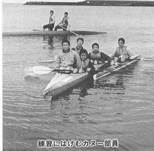
練習にはげむカヌー部員

いよいよ海のシーズン、国体連続六回出場の大輝かしい実績を誇る名門寺泊高校カヌー部が、新一年生七名の部員を迎えて、まだ肌寒い潮風にむかって艇を漕ぎだし連日練習にはげんでいます。 九月に行われる京都での国民体育大会並びに山梨での全国高等学校カヌーレーシング選手権大会への出場をめざし、同校の江龍田・五十嵐両先生指導のもと男子七名女子六名の部員は、カヤック・シングル・同ペア・同フォア・カナディ