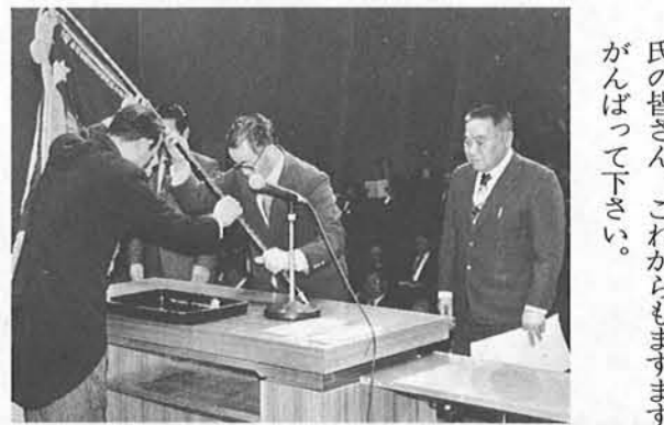
氏の皆さん、これからはますますがんばって下さい。

昨年の九月に真野町の県栽培漁業センターから、体長十センチ・体重二十グラムほどの稚魚三千匹を譲り受け、町の水族博物館で中間飼育をしていましたが、このほど体長が約二倍の十九センチ・体重も約六倍の百十六グラムと順調に育ったので、クロソイの生態等を追跡調査するために必要な標識を付け、寺泊港の灯台沖合に、放流しました。 クロソイは別名「黒ハチメ」とも呼ばれ、岩礁に生息する寒流系の魚で、北日本（北海道、秋田、新潟、富山）に多く分布しており、全長四十センチにもなり、肉は白身で、刺身、塩焼などにするとおいしい魚です。 これからも町と寺泊漁協と連絡をとりながら、稚魚の中間飼育、並型魚礁の設置等により、魚礁漁場を造成し漁業資源の確保につとめ、生産量の増大を図っていきたく考えております。