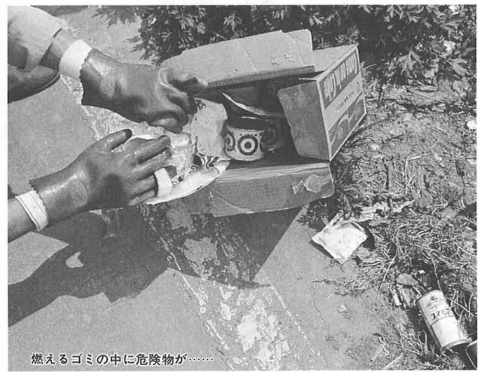
燃えるゴミの中に危険物が……