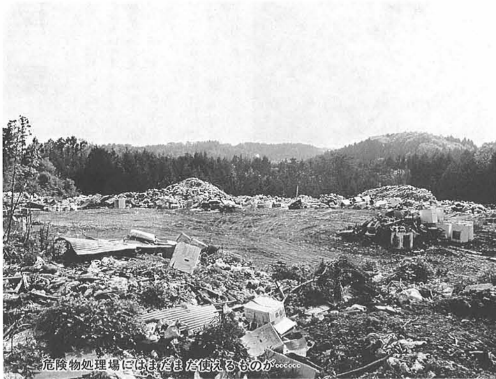
危険物処理場にはまだまだ使えるものが……

先日、和島村の危険物処理場を見てきました。寺泊町・和島村・出雲崎町・与板町・中之島町の五ヶ町村で運営しているのですが、その危険物の量と捨てられている品物にあらためて驚きました。テレビ・冷蔵庫などの家電品はいうに及ばず、まだまだ使用できるものが多いのです。