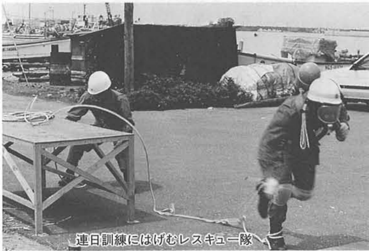
連日訓練にはげむレスキュー隊

最近、テレビ等でもよく紹介されているオレンジ色の服を着た消防救助隊をご存知ですか。消防救助隊は、大小災害時ほとり、交通事故や火災などによる人命救助等に対し消防隊や救急隊とは別に特殊装備や技術を用いて救助活動を行うものです。都市では、早くから編成されあらゆる救助等に活動しており、エルサルバドル地震の際には東京消防庁の救助隊員が国際救助隊として派遣され活躍したことは世界的にも報じられました。 各地で増加する、特殊災害や交通事故などに備え六十一年から消防救助隊の設置が法令化され地方の消防本部においても救助隊を編成することになりました。 当本部としても、職員を派遣し隊員の育成を図るとともに特殊器材の充実をすすめています。 また、来たる七月には、上越市での第五回新潟県消防救助技術大会へ出場するなど毎日の体力練成や訓練を通じ、強い精神力と体力・技術の練磨に励んでいます。