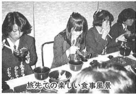
旅先での楽しい食事風景

楽しい企画がいっぱい！ 寺泊高校修学旅行・バス遠足 10月2日、二年生の修学旅行は紅葉のはじまった東北地方、NHK大河ドラマで人気を博している伊達政宗の青葉城跡、松島、巖美溪、中尊寺等を見学し、「奥の細道」の句碑で芭蕉翁をしのび、宮沢賢治や啄木をたずねる一方、アーチェリーや乗馬を体験、わんこそば食いにも挑戦するなど盛り沢山の内容で、楽しい思い出に残る意義深い修学旅行でした。