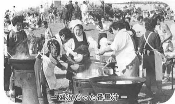
— 盛況だった番屋汁 —

シーサイドマラソンに出場したのは、今回で三回目でしたが、いつも、走り終えたときの気持は最高です。「順位はともあれ最後まで全力で走りぬくぞ」という気持ちで、今回もがんばりました。まさか、十位以内に入れるとは思っていませんでしたので、びっくりしたと同時に、すばらしい思い出になりました。