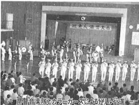
県警音楽隊とカラーガーズによるドリル行進