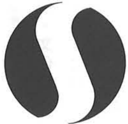
新潟県交通安全シルバーマーク

このマークは自動車専用のものであり、数に制限もありますが、町総務課で用意してありますので65才以上の高齢ドライバーの希望者は、お申込み下さい。