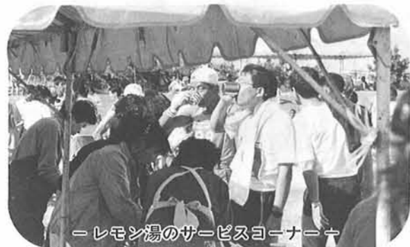
— レモン湯のサービスコーナー —