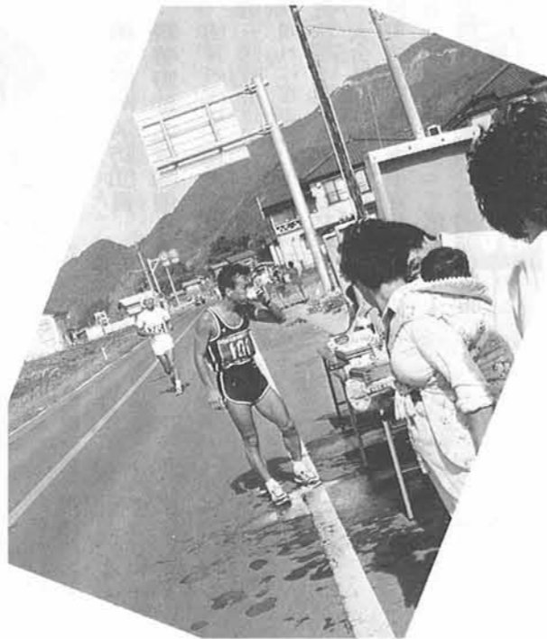
— 野積中浜でのお茶とおにぎりのサービス —