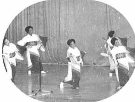
寿クラブのみなさんによる「会津磐梯山」

今年も、一年間練習を重ねた唄や踊りを、町内11老人クラブの代表と民謡教室の人たちが参加して、10月16日町体育館において、五〇名の観衆を集め盛大に開催されました。 今年、友情出演としてコロナ白岩の里入所生や保育所児童に、加えて、新潟県警察音楽隊とカラーガーズが参加して、華麗な演技を披露し、老人演芸大会に花を添えました。