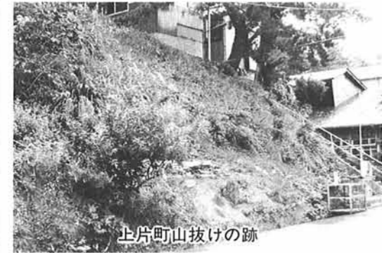
上片町山抜けの跡

大字寺泊の大町地内急傾斜防災工事が、昨年から年次計画で施工されている。寺泊の海岸地層は軟弱で、古来山抜けの災害が多い。「町御用留」によると、宝暦十年(一七六〇)三月、上片町に大きな山抜けがあり、長善寺と家数二軒が全潰、興琳寺の庫裡と人家八軒半潰の惨事が起きている。この地域は、時々小規模の山崩れが発生するので、同地内にあった生福寺は、正徳四年(一七一四)、大町の現在地に移転して、この難を免れている。 この時の山抜けは「興琳寺御堂上ヨリ吉村道筋迄八十間、町並軒下ヨリ山ノ中腹割レ留リ迄百間ニ及ブ」大規模なもので、街道は土砂に埋まって通行止めになった。そのために、各町内に人足が割り当てられ、延五五七五人の手によって復旧工事が進められた。 安永八年(一七七九)十月の上荒町の山抜けは、火災が発生したから被害は更に広がる。「上荒町長善寺附近ノ山抜けニテ家数二十軒余、町並潰レ候。男女三・四人如何相成候哉。未タ相見エ申サズ 候」。更に「潰家ノ内ヨリ出火、折悪シク西風強ク田福寺ト家数六十軒焼失」の古文書の記録は、災害の恐ろしさを今に伝えている。背後が山、前面が海の寺泊は、火災が発生すると大火となる。 明治元年(一九二六)九月、大町の庄兵衛宅より出火、火は折柄の強い西風に煽られて延々十四時間燃え盛り、磯町の川迄、寺院四、家数四九二軒、他に多くの土蔵、小屋、舟などを舐め尽くした。火元の始末書によると「昼飯ノ支度ラシテ竈ニ火ヲ焚キ候処大風ノタメニ階ニ置キ候焚付ニ飛火」したので出火原因で、消防設備もないままに大火になったのである。 町年寄は救援活動に奔走し、お上から御手当米三八〇俵、自らも大枚三百両の義捐金を拠出する一方、五ヶ月にわたって毎日二百人の人足を調達して復旧工事に努めたという。明治五年にも、大町から出火した大火があり、二ヶ寺と人家百軒近くが焼失している。 寺泊の災害は海からも襲来する。船の遭難はもとより、海岸の人家を襲う涛害もまた恐ろしい。