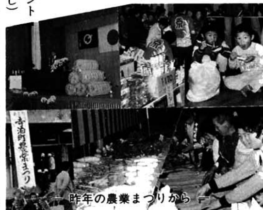
—昨年の農業まつりから—

「生産と消費の相互理解で 」をスローガンに、町と農 協が共催して、実り多い秋に 開催しております。2回目の 今年は昨年以上に盛り沢山の 企画を準備しておりますので 是非おいでください。 とき 11月8日(日)午前10時 ところ 寺泊町体育館 主催 寺泊町農産物品評会 農産物即売会 ◇モチつき大会 (その場で試食) ◇演芸大会 ◇コシヒカリプレゼント 抽選会(空くじなし)