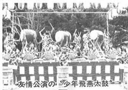
友情公演の「少年飛燕太鼓」