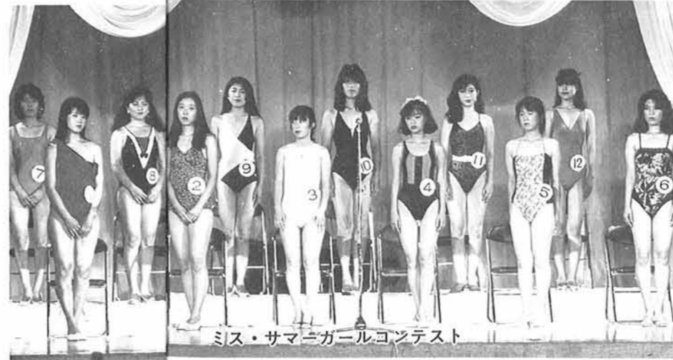
ミス・サマーガールコンテスト