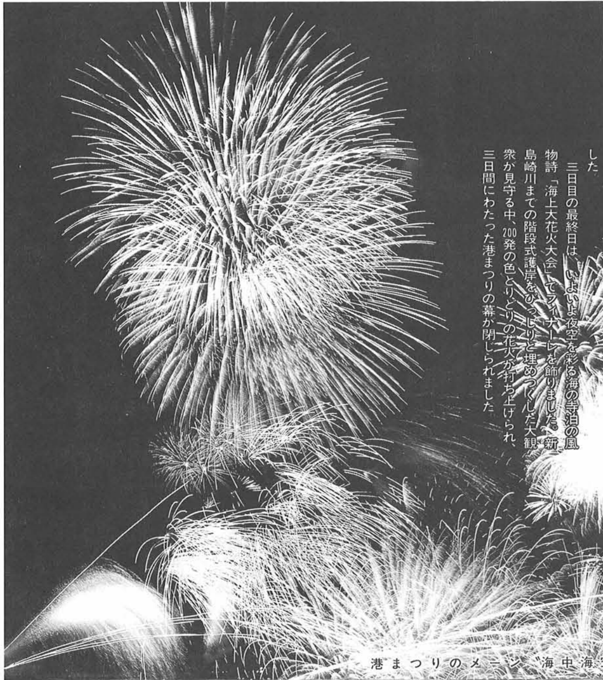
港まつりのメイン「海中海空大花火」

三日目の最終日は、いよいよ夜空を彩る海の寺泊の風物詩「海上天花火大会」でクライマックスを飾りました。新島崎川までの階段式護岸をのびりと埋めつくした大観衆が見守る中、20発の色とりどりの花火が打ち上げられ、三日間にわたった港まつりの幕が閉じられました。