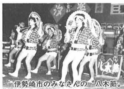
伊勢崎市のみなさんの「八木節」