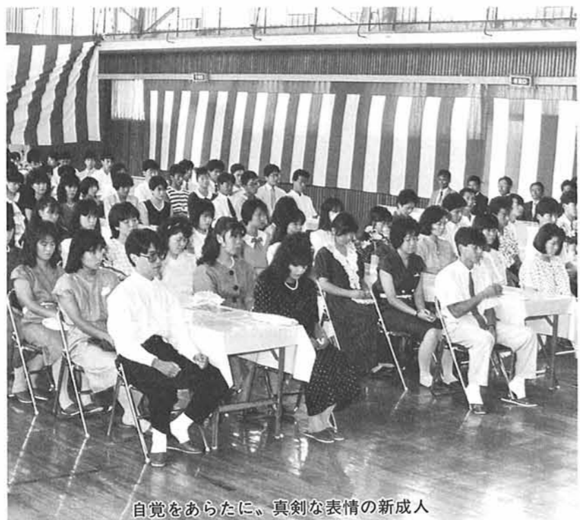
自覚をあらたに、真剣な表情の新成人