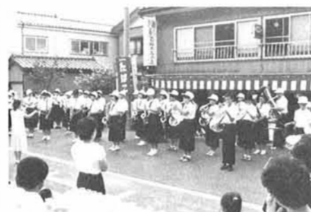
寺泊・大河津両中学校