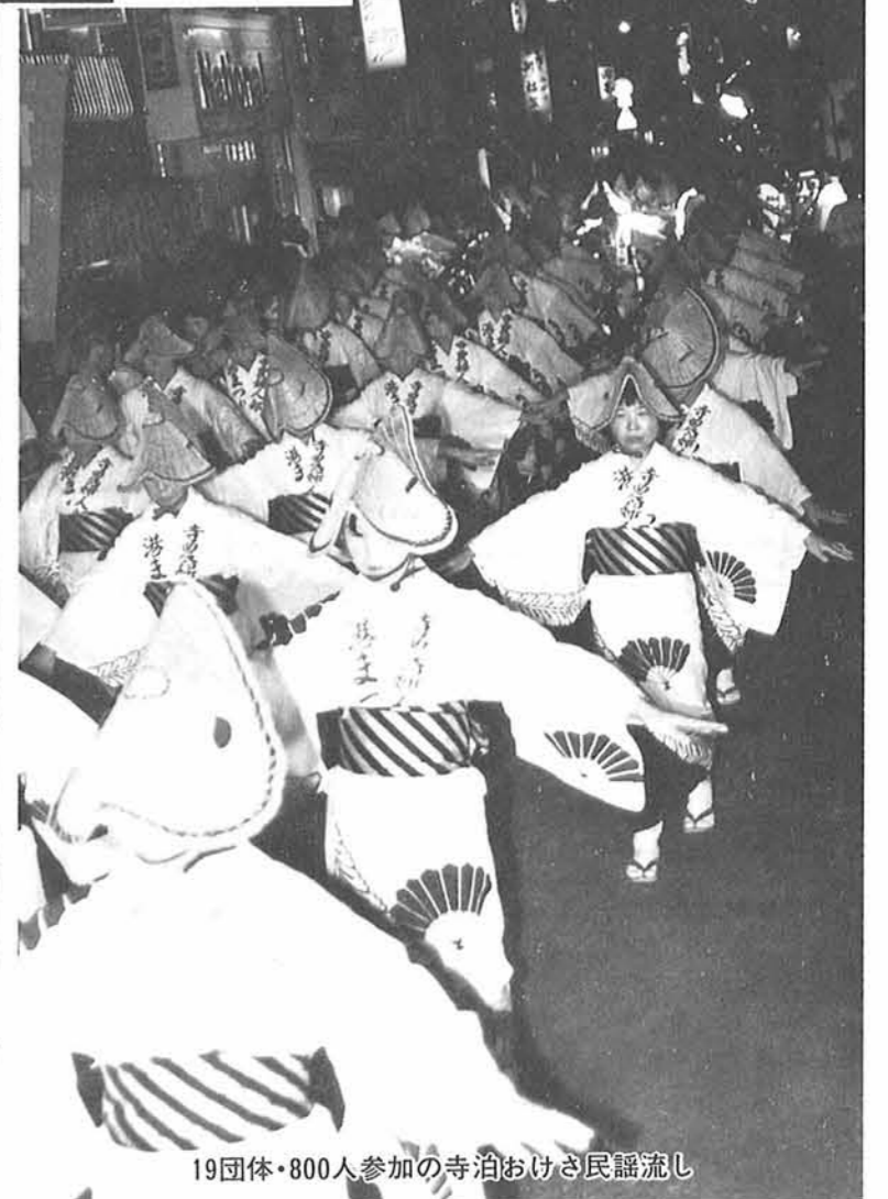
19団体・800人参加の寺泊おけさ民謡流し