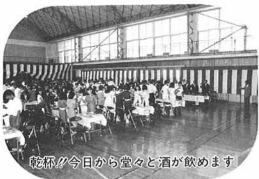
乾杯!! 今日から堂々と酒が飲めます