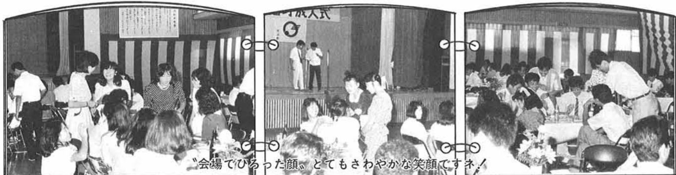
会場でひらった顔、とてもさわやかな笑顔ですネ!