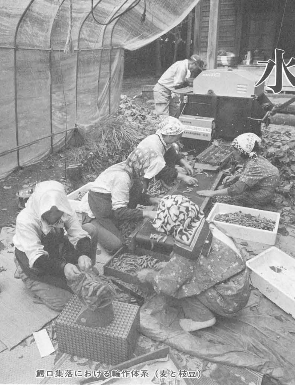
鱈口集落における輪作体系(麦と枝豆)

昭和62年度転作等目標面積(町分として) 266.2ヘクタール 転作率 19.6パーセント