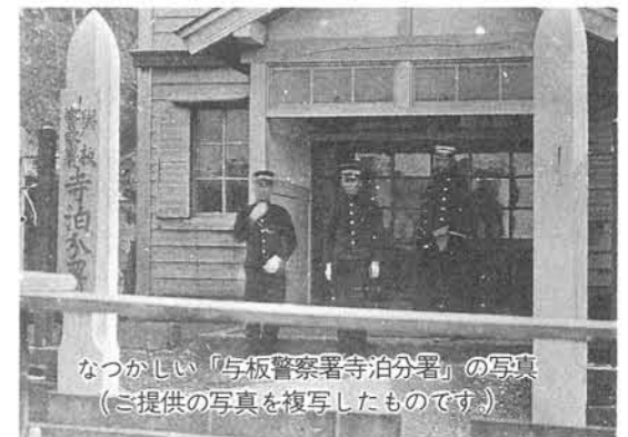
なつかしい「与板警察署寺泊分署」の写真 (ご提供の写真を複写したものです)

わが町の古い歴史や貴重な資料を後世に伝えるために、町史編さん作業が着々と進められています。町民の皆さんから親しまれる町史にするためできるだけ多くの写真をお寄せいただきたいと思います。先月号でご協力をいただきましたところ、さっそく数点の貴重な写真のご提供をいただきました。ご家庭のアルバムにまだまだ古い珍しい写真がたくさん残っているのではないのでしょうか。ぜひ一度おための上ご提供をお願いします。 むかしの行事や、まち・むらの様子などどんなものでも結構です。お持ちの方は至急ご連絡願います。