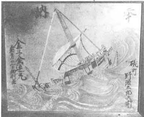
海難船絵馬(円福寺所蔵)

海上で仏を拾うと大漁があると、福が舞込むとかいわれるが、これなどはまさしく直截的な招福事例というべきであろうか。