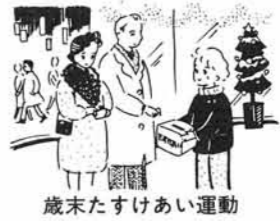
歳末たすけあい運動

万七千九百九十九円集まり、町長はじめ各民生委員が皆さんを代表して、長期入院患者、寝たきり老人重症心身障害者、生活保護世帯、施設入所者、老人ホーム、国療入所者、コロン入所生などに歳末慰問をし、善意を伝えました。ありがとうございました。 私たち一人ひとりのあたたかいたすけあいの心が、大きな力となっておりです。 今年の配分計画に基づく目標額は百三十万円です。恵まれない人も「あたたかい歳末」を迎えられるよう、多くの方々のご協力をお願いいたします。