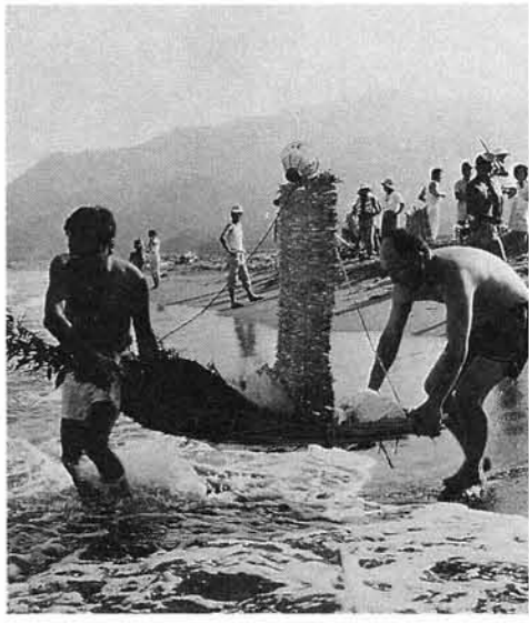
野積地区における「精霊ながし」

◆葬式、野送り、火葬場、祭壇飾りつけなど ◆蔵開き、船霊まつり、大漁風景など ◆庚申講、御嶽講、米山講などの講の行事 ◆その他、町や村の昔の学校、家、橋、道路、町並み、工事など みなさんからお借りしました写真は複写し、編集会議を経て後世に残る町史のページを飾ることになります。 お借りした写真は、後日お返しいたします。 ※写真お持ちの方は、町教育委員会へ直接お持ちいただくか、もしくはご連絡ください。 75-2446