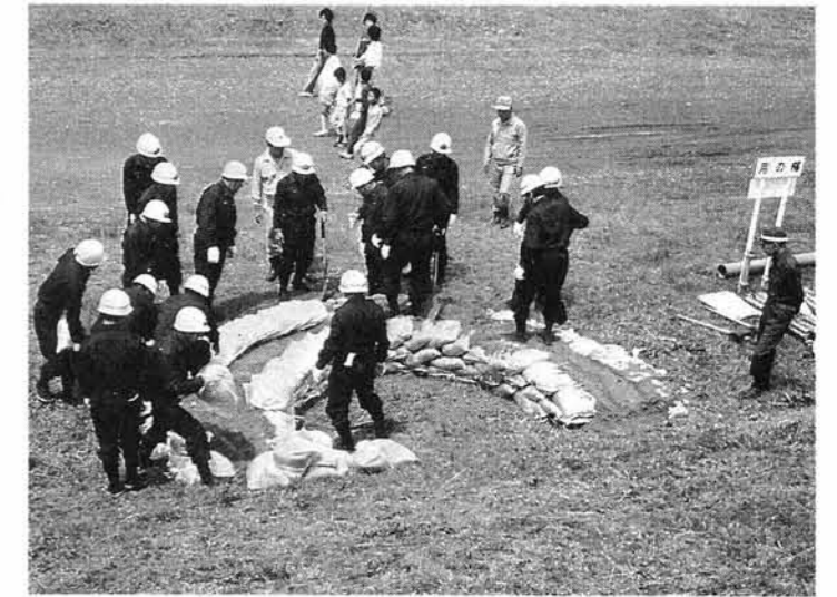
▼月の輪工法に取り組む団員のみなさん