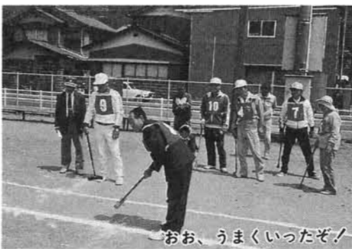
おお、うまくいったぞ!

康づくりに、コミュニケーションの場に、また来年のゲートボール大会に備え、腕まえを一層向上させますよう期待します。