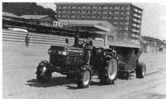
活躍中のビーチクリーナー

今までは手作業によつた清掃ですが、年々広がる砂浜と、観光客の増加にもなうゴミの増量に追いつかない状況でした。今年はビ