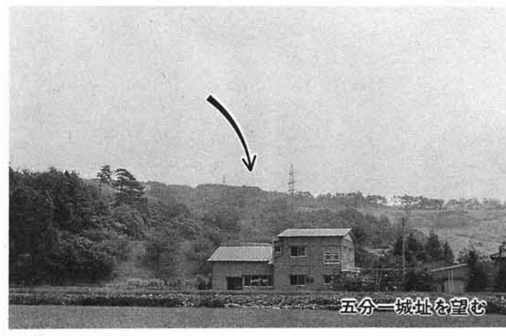
五分一城址を望む