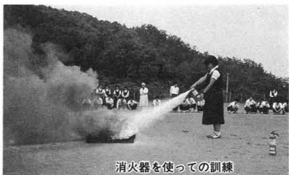
消火器を使つての訓練