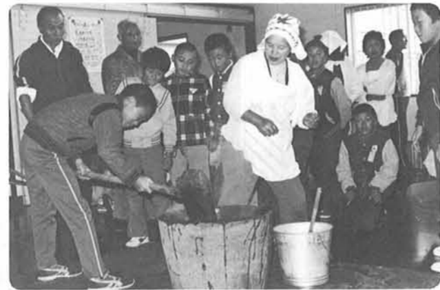
ソラツ、ヨイショツ おいしいおもちが できました。

一年間の勤労生産活動をふりかえり、生産の過程や労苦・喜びを發表し、みんなで収穫を祝う収穫祭が11月17日、山ノ脇小学校で子どもたちの手により行われました。一年生はとうもろこし、二年生さつまいもと枝豆、三年生小豆、四年生じゃがいもと大根、五・六年生は米をそれぞれ四月から、一生懸命育ててきました。山ノ脇学区でも親子ふれあい活動を推進しているため、当日はお父さん・お母さんあるいはおばあ