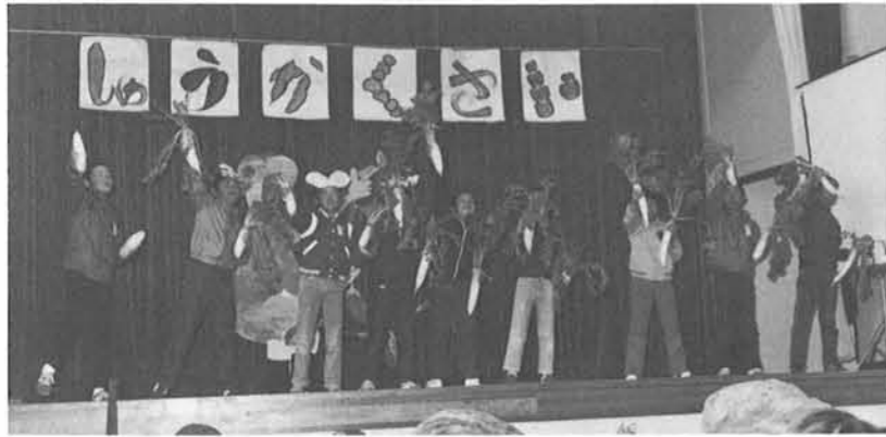
▲自分たちの手によって収穫した大きな大根をもってよろこぶ児童

一年間の勤労生産活動をふりかえり、生産の過程や労苦・喜びを發表し、みんなで収穫を祝う収穫祭が11月17日、山ノ脇小学校で子どもたちの手により行われました。一年生はとうもろこし、二年生さつまいもと枝豆、三年生小豆、四年生じゃがいもと大根、五・六年生は米をそれぞれ四月から、一生懸命育ててきました。山ノ脇学区でも親子ふれあい活動を推進しているため、当日はお父さん・お母さんあるいはおばあ