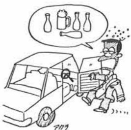
酒酔運転厳禁「正月だから」は許されません