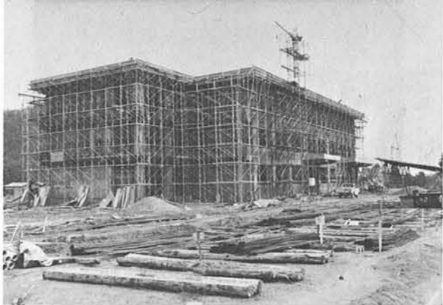
全貌を表わした分校校舎

大河津方面から寺泊海岸に向けて来て吉の堤のあたり、小高く大きな烏帽子平に鉄筋三階建て工事の建物の一部が下の道路からチラリと見えます。これが与板高校寺泊分校独立校舎の偉容です。 「広報てらどまり」八月号で地鎮祭までの経緯をお知らせしましたが、十月末現在で写真のような状態まで順調に進捗しています。竣工は明年二月に予定されていますので、来春四月からは全町民積年の夢であった寺泊小学校校舎脇からは独立し、名実ともにりっぱな寺泊分校としますますの教