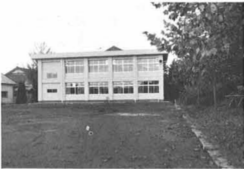
白亜の容姿に近代的な内部施設となり、すっかり生れ変わった教室に生徒も大喜びです。

体育館に併設されていた工作室等特別三教室三七〇㎡が木造建築のため腐食もひどく、危険な状態となつたので危険建物として围庫補助を受け、三千九百五十三万円で改築工事が進められておりましたが、この度、工作室、音楽室、被服室の三教室が完成いたしました。