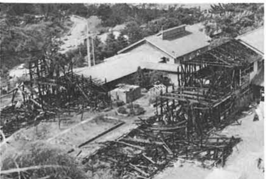
▷復旧がまたれる寺中学校舎

◆土地取得について…国療用地の先行取得として、大字下桐地内四万一千八十八平方メートルの土地を予定価格二億四千五百六十六円(用地取得費、造成費、附帯工事費、借入金利息、登記手数料、事務費等)で県央土地開発公社から購入したいと言っております。