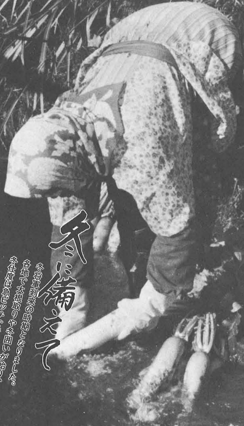
（とじて保存しましょう）