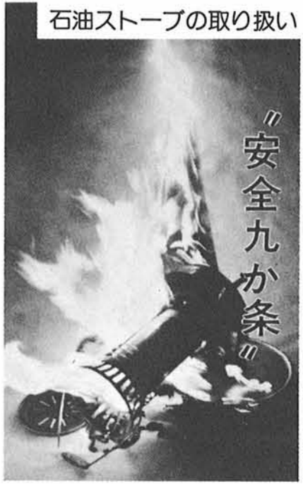
石油ストーブの取り扱い

十一月から三月にかけての冬場は、石油ストーブなどの暖房器具を使うことから、一年のうちでも最も火事の多い季節です。 火災の原因は、暖房器具の中で一番多いのは、なんとと言っても石油ストーブです。 昭和五十三年の統計では、ストーブによる火災二千七百六十六件（全国）のうち、七十五%にあたる二千七百六十六件が石油ストーブによるものです。今年も、十一月二十六日から十二月二日までの一週間、秋の全国火災予防運動が繰り広げられます。