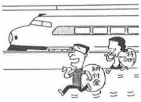
これで通いつつます!!