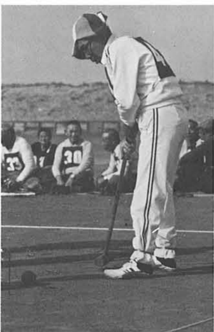
「うまくいったぞ。真剣そのものです。」