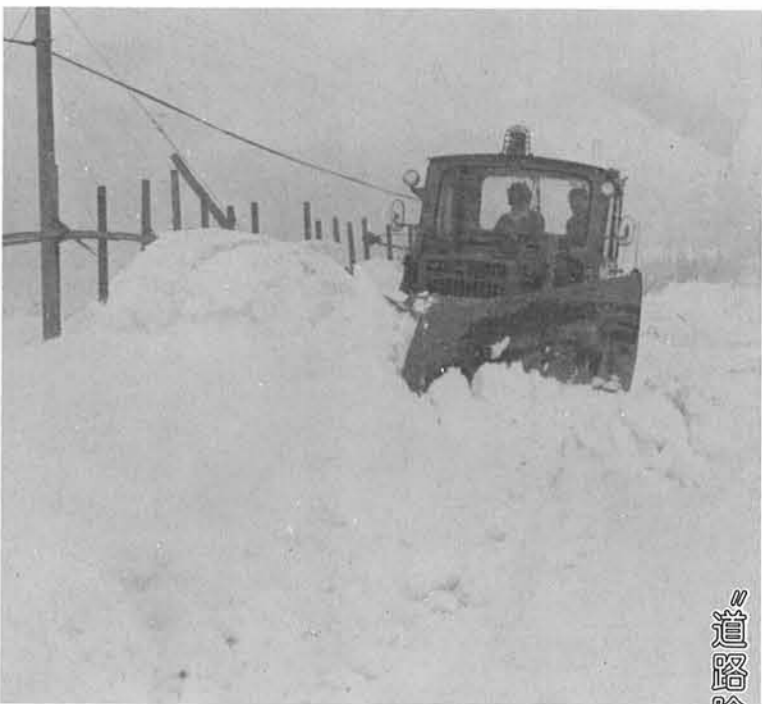
道路除雪についてのお願い