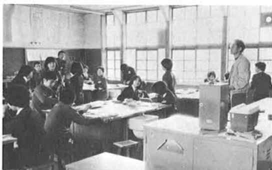
不自由な借り物机でも明るく一生懸命勉強しています。

八月二十九日未明の寺泊中学校火災に際しては早速かけつけてくださり、消火活動に、用具の搬出にご尽力をいただき、心からお礼申し上げます。