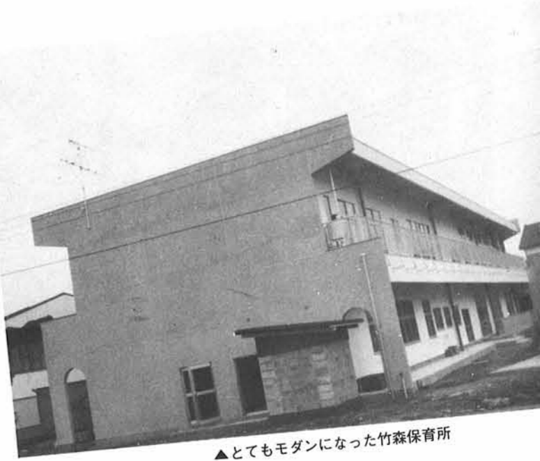
▲とてもモダンになった竹森保育所

五月から工事を進めてきた竹森保育所がこのたび完成しました。竹森保育所は昭和四十三年に建設された木造平屋建ての建物ですが、地盤が悪く危険なため、このたび場所を少し動かして全面改築することになったものです。 こんどの建物は、今までのもの