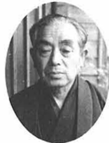
小 越 渡 氏