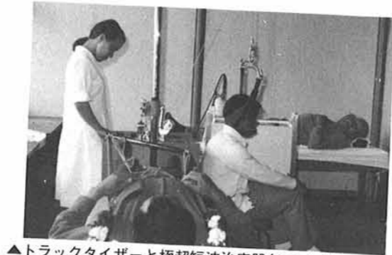
▲トラックタイザーと極超短波治療器(むこう側)