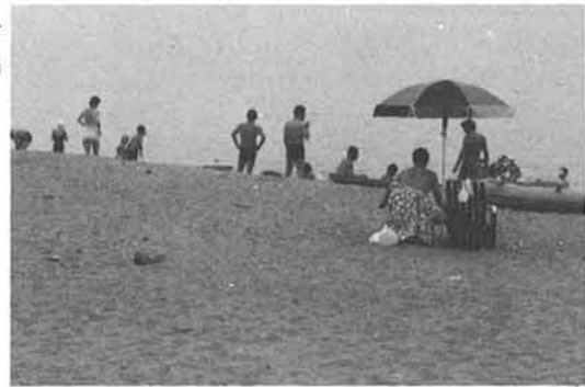
51年度海水浴場入込状況(推定)