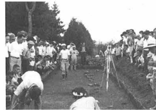
▲切石の列が発見された

つかり、それはたいへん古い墓の形式で、中央に仏を安置し、その周辺を正方形に溝を掘って墓地を区画したもののだが、部分的で全体の姿をつかめなかった。 四、ぶたい塚は自然の山ではなくて、土を盛り上げながら作ったものであることがわかったが、なんのために作ったのかは、たしかめることができなかった。