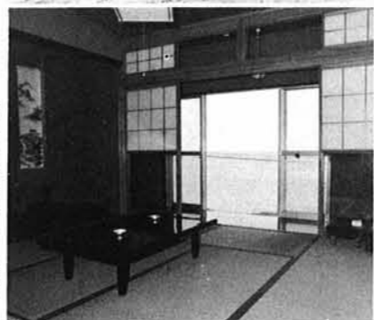
窓越しに広がる日本海

のスマートな建物で、床面積五三〇平方尺、不老、長生、高砂、養老と各室(八畳)があり、夕映荘じまんの超音波風呂や一〇〇名収容できるステージつき大広間にはマイク施設も備えられています。各室からは佐渡を一望でき、海辺の美しい自然に囲まれており、