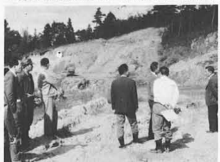
▼採取現場を視察する協議会の人たち

工事現場へピストン輸送を続ける山砂や山砂利を満載したダンプカーが通る沿線の住民や、採取現場附近の人