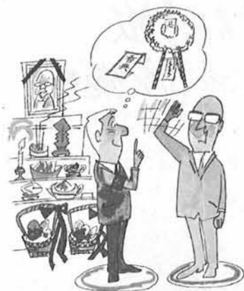
お葬式の香典、花輪、供花

ただし、政治家、候補者などやその後援団体が、政治活動のための事務所に掲示するもの(数に制限があり、選管の定める表示が必要)や、ベニヤ板、プラスチック板を使わないポスターなど、認められるものもあります。こんどの改正について、不明の点は町の選挙管理委員会へ。