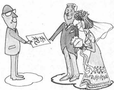
結婚のお祝い金やお祝い品