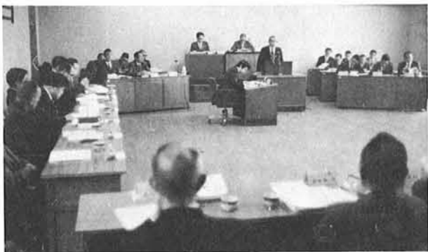
▲初議会で提案理由を述べる町長

二十六回目を迎える両泊大会が今年も赤泊村で開催され、各種目に熱戦が繰りひろげられます。また、五日夜には参加者全員が