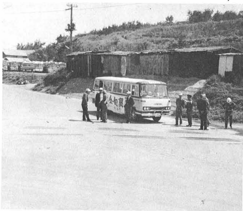
▼ここには一時停止の標識を…

ことにし、国、県道については警察にその実情を訴え、措置を講じてもらうよう関係機関に働きかけることにしました。しかし、いくら安全施設を講じたからといって事故をなくすためには一人一人の自覚がなによりもいちばんです。住民総ぐるみで交通事故をなくしましょう。