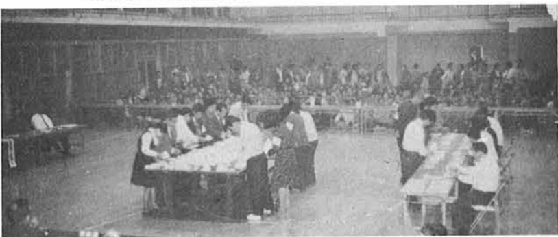
▼体育館での開票風景

の道とすべきは道に非ず、名の名とすべきは名に非ず」とこれは例え、保守と革新とは何ぞや。日本での保守とはソ連では革新ということになるなどを思えばわかる、積極、消極ともに絶体はないし、平等の中に差別があり差別の中に平等があるとすればお互いに地方自治行政の中にイデオロギーの論争より住民本位に住民の幸福を目標に努力精進を期待申し上げてご挨拶いたします。