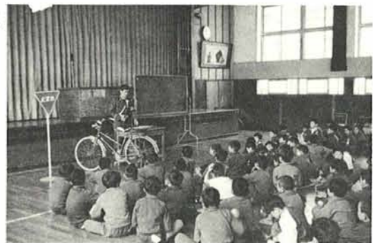
▶ブレーキはよくききますか？ みんな真剣

全国交通安全運動期間中の五月十六日に大河津小学校で正しい自転車の乗り方講習会が開かれました。 屋内運動場に全校児童が集り、与板警察署の交通課長さんから実際に自転車を使って正しい乗り方の講習を受けました。 警察では、多く発生している自