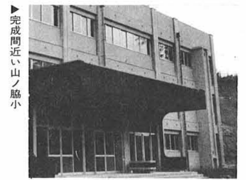
完成間近い山ノ脇小

昭和五十年一般会計予算は、九億四千五百万円で、前年当初予算にくらべ十六割増となりました。なお一般会計予算のあらまは別項グラフのとおりです。次に、一般会計予算のうちからおもな事業を紹介します。